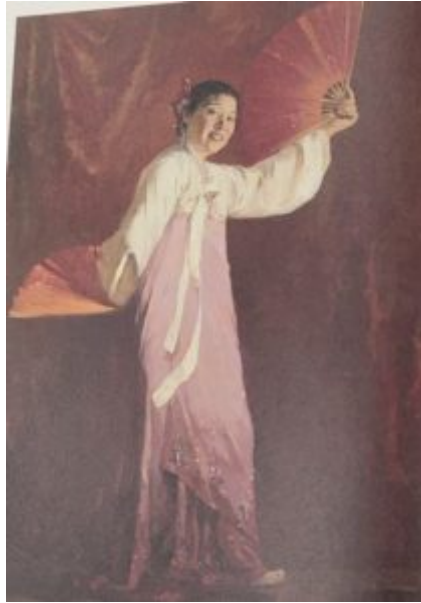
Портрет танцовщицы Чхве Сынхи, 1954.