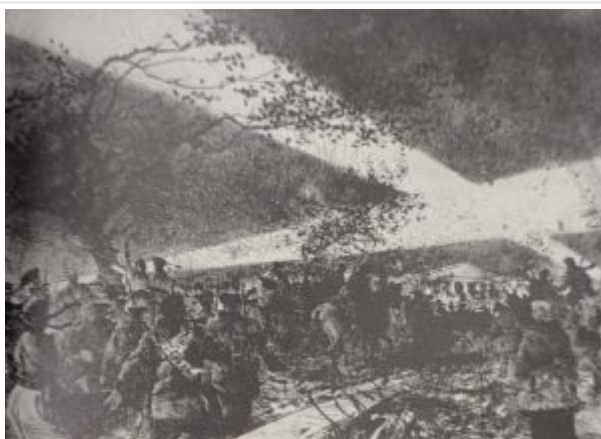
К Смольному, 1977.

Пена Варлена называют «корейским художником русской национальности». Как художник он сформировался в лоне западноевропейского искусства, при этом не забывая исследовать искусство Востока, в частности традиционное искусство Кореи. Он был отрезан от Южной Кореи, но поддерживал связь с северокорейскими художниками, на которых оказал сильное влияние. Творчество Пен Варлена является своеобразной связующей нитью, которая объединяет в единое целое современное искусство Кореи.