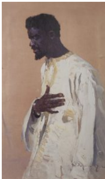
Портрет йеменского студента, 1977.