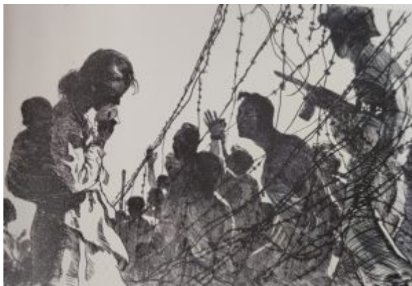
Трагедия разделения Кореи, 1962.