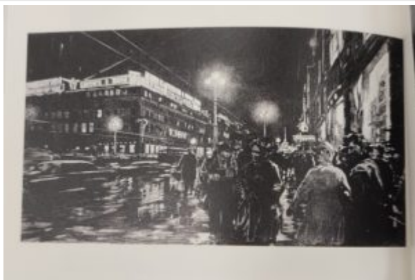
Ночь на Невском проспекте, 1964.

Спустя несколько лет после ретроспективы Национального музея современного искусства Южной Кореи творчество Пен Варлена снова привлекло к себе внимание. В 2022 г. в Музей искусств округа Лос-Анджелес (LACMA) была открыта выставка «Пространство между: современное корейское искусство» (The Space Between: The Modern in Korean Art). Для этой выставки Ким Намджун (также известный под псевдонимом RM), лидер корейской музыкальной группы BTS, записал специальный аудиогид на корейском и английском языках. Являясь знатоком искусства и коллекционером, Ким Намджун лично выбрал десять работ, о которых он захотел подробнее рассказать в своём аудиогиде.