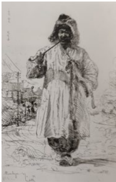
Корейский крестьянин с трубкой, 1958. Источник: Пен Варлен. Офорты = Pen Varlen : etchings / сост. Ольга Пен. Санкт-Петербург : Borey art gallery, 2007.