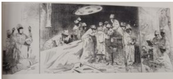
Врачи, 1972.