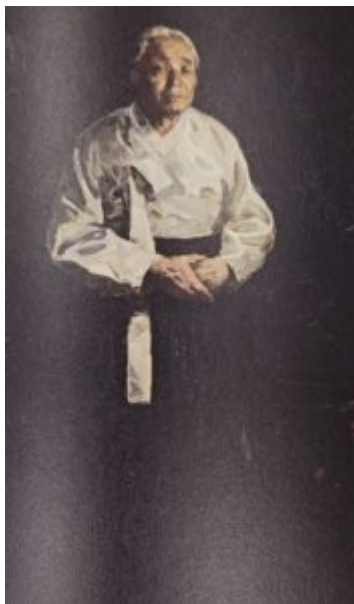
Мать, 1985.