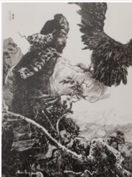
В горах Тянь-Шаня, 1960.

Российский искусствовед Антон Успенский в своих работах приводит следующий эпизод из жизни художника. Пен Варлен написал портрет Михаила Дудина, не только поэта, но и переводчика, открывшего советскому читателю такое имя как Эдит Сёдергран. Пен Варлен получил в подарок от поэта сборник стихов «Янтарь» с надписью: «Отображай, талантом греясь, / интернациональный век, / полуфранцуз, полукореец, / а в общем, - русский человек». Михаил Дудин считал, что имя живописца звучит на французский манер.