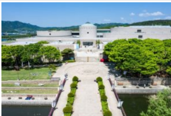
Национальный музей современного искусства (Сеул, Квачон).

В 2017 г. в Отдел литературы стран Азии и Африки (ОЛСАА БАН) поступил каталог выставки «Пен Варлен 1916-1990» Национального музея современного искусства (Сеул, Квачон, 2016). Это первая выставка из цикла «The 100th Anniversary of the Birth of Korean Modern Masters», посвященного столетию рождения современного корейского искусства. Наряду с изданным в Санкт-Петербурге альбомом «Пен Варлен. Офорты» этот каталог является прекрасным источником информации о жизни и творчестве замечательного художника советской эпохи.