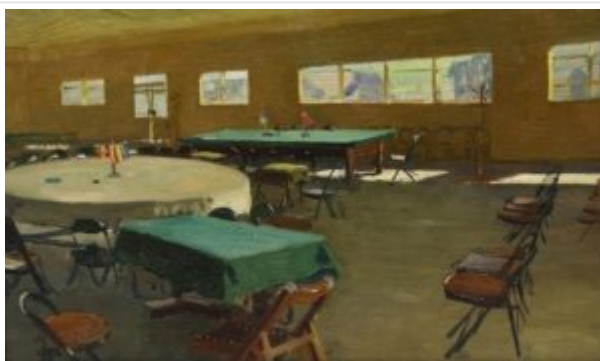
«Зал переговоров о перемирии в Пханмунджоме в 1953». Картина Пена Варлена на выставке в Лос-Анджелесе.

Среди этих десяти работ картина Пена Варлена «Зал переговоров о перемирии в Пханмунджоме в 1953». С оригинальным аудиогидом и его переводом на русский язык можно ознакомиться, перейдя по ссылке из списка наших источников (№ 5).