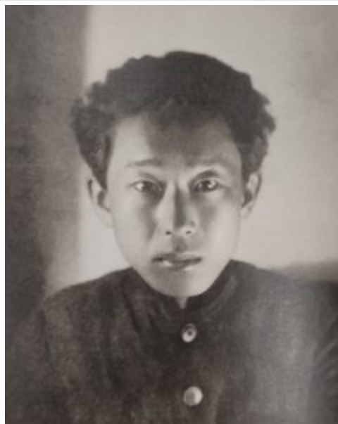
Пен Варлен. Источник: Пен Варлен. Офорты = Pen Varlen : etchings / сост. Ольга Пен. Санкт-Петербург : Vorey art gallery, 2007.