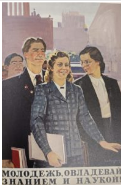
Молодежь, овладевай знанием и наукой! 1949. Источник: [ ] = Pen Varlen = Пен Варлен / [ ]. [ ] : [ ], 2016.