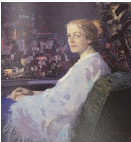
Портрет балерины Ирины Александровны Колпаковой, 1971. Источник: [ ] = Pen Varlen = Пен Варлен / [ ]. [ ] : [ ], 2016.