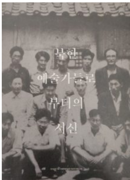
Альбом писем северокорейских художников. Источник: [ ] = Pen Varlen = Пен Варлен / [ ]. [ ] : [ ], 2016.