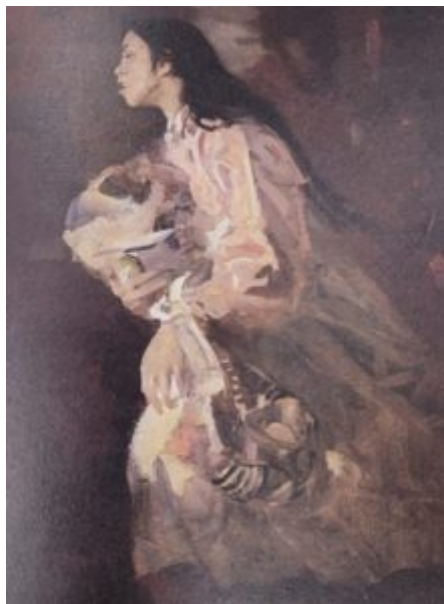
Этюд для «Освобождения» (Бегущая женщина), 1958.