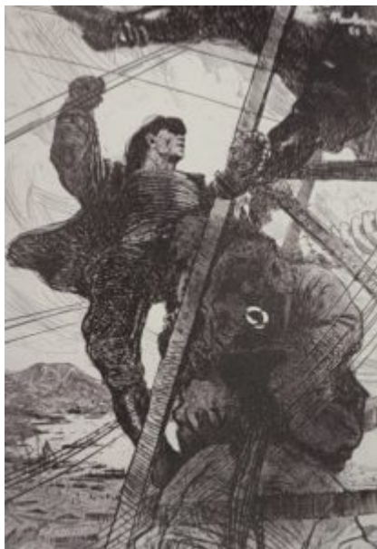
Строительство Приморского края, 1962.