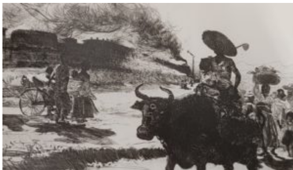
Под Пхеньяном, 1959.