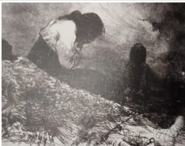
Трагедия Корейской войны, 1962.