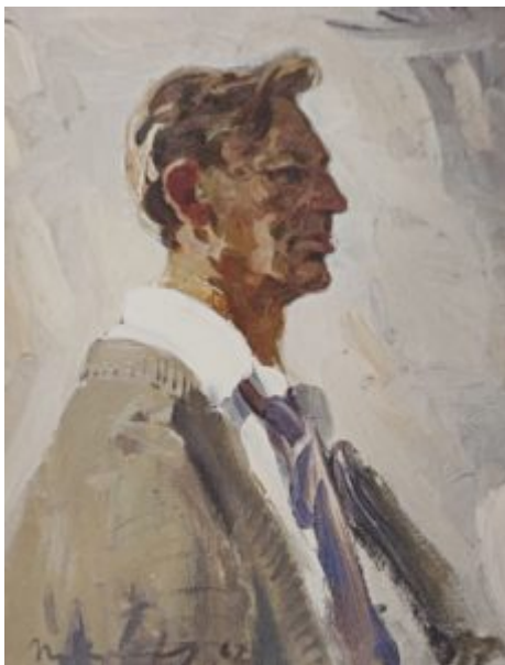
Портрет поэта Михаила Александровича Дудина, 1962.