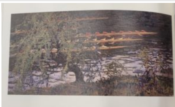
На реке Невке, 1983. Источник: [1] = Pen Varlen = Пен Варлен / [2]. [3] : [4], 2016.