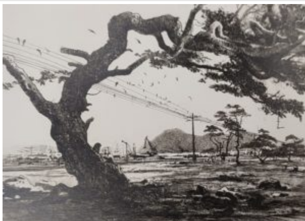
У Находки, 1961. Источник: Пен Варлен. Офорты = Pen Varlen : etchings / сост. Ольга Пен. Санкт-Петербург : Borey art gallery, 2007.