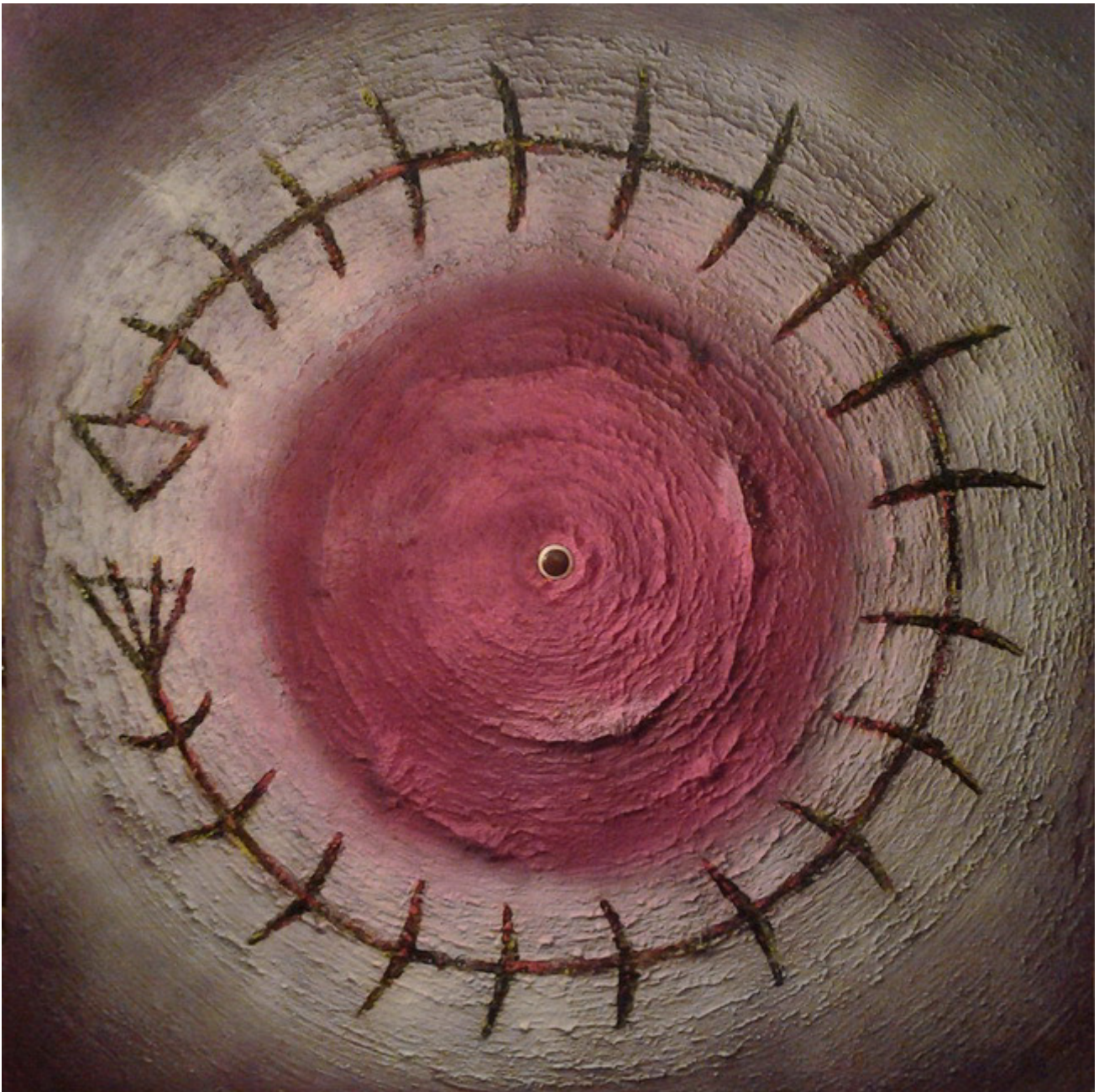
Е. Гегузин/Е Gegouzin. Рыба Пу/Fish P. 2016. Холст, акрил/Acrylics on canvas. 100x100 см

Интересно толкование истории человечества не как цепочки событий, но как цепочки рассказов о событиях, причем рассказов человеческих, со всеми вытекающими деталями. Объем доступной человеку информации достаточно невелик, синергия умов практически отсутствует, круговорот веществ на планете интенсивен, а искусственный интеллект человекообразен и откровенно слаб. В итоге, события 5000-летней давности выглядят глухой архаикой, хотя некоторые подробности и привносит археология. Но следует понимать, что умение игнорировать любые сведения есть краеугольная основа человеческой психики. Таким образом, может рождаться вся история, которая есть лишь точка зрения конкретного индивидуума на проблему.