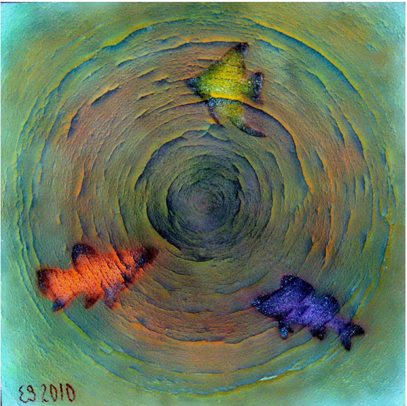
Е. Гегузин/E Gegouzin. Рыбы 1/Fishes 1. 2010. Холст, акрил/Acrylics on canvas. 100x100 см

Глядя беспристрастно, современный человек — кроманьонского типа — весьма звероподобен, и по внешности, и по поведению. А человеческое общество напоминает стадо зверей-обезьян, что и немудрено, учитывая генетическое сходство человека и обезьяны. Звериные эмоции позволяют выжить в природе и в стаде не только Зверю, однако важно помнить, что человек современного типа — это гибрид Зверя и Творца, а Творец независим от природы и управляет ей. Homo sapiens, по большому числу своих качеств, остался зверем с доминантой инстинктов типа секса и голода, и именно на них базируется современная греко-римская культура. Иное дело, что не все в человеке от Зверя, есть малая толика и от Творца, однако качества эти, типа добродетели, мало того, что весьма эксклюзивны, носят смутный и плохо объяснимый характер.