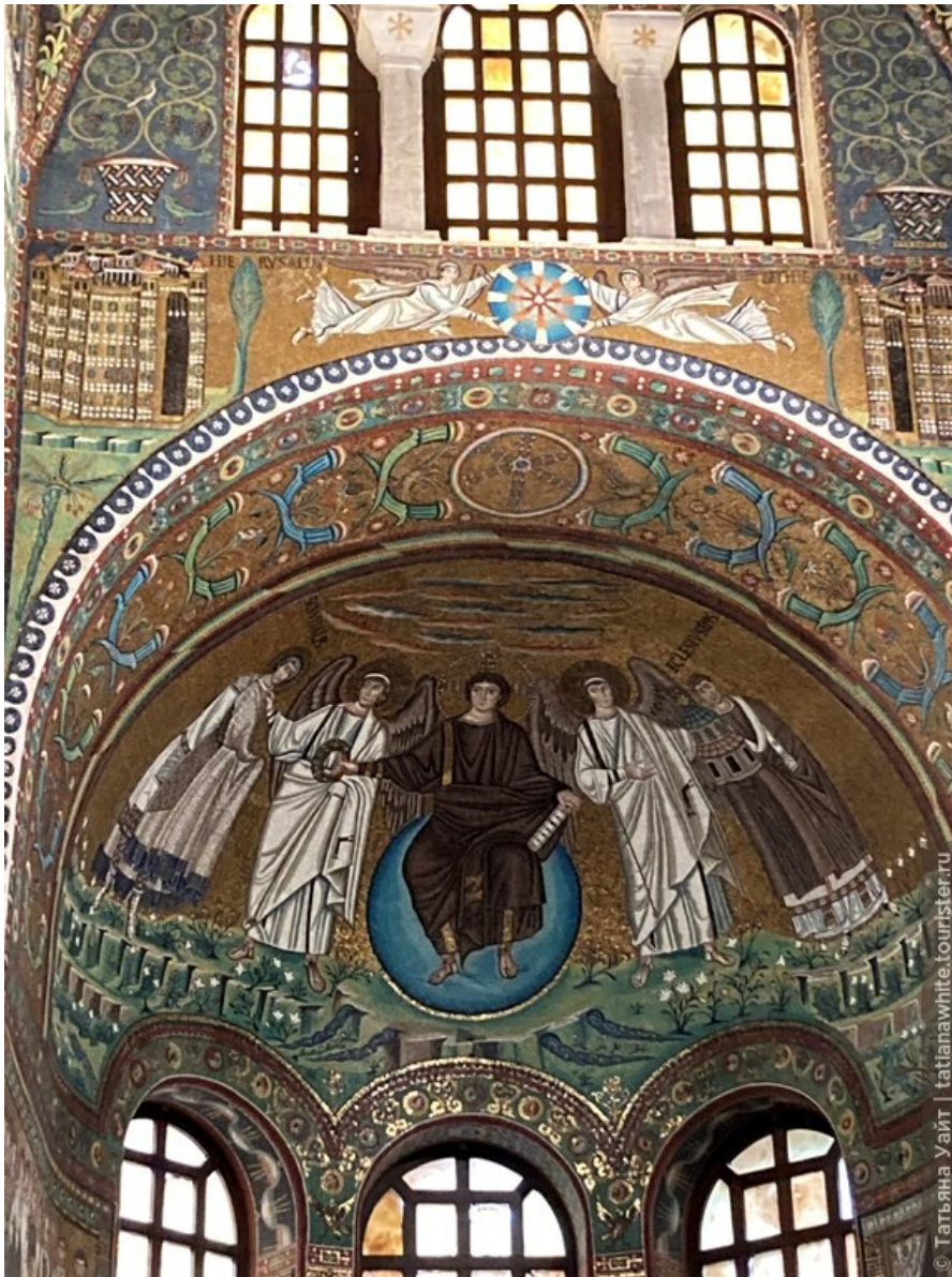
Христос с предстоящими ангелами, мучеником Виталием и святым Экклесием Равеннским