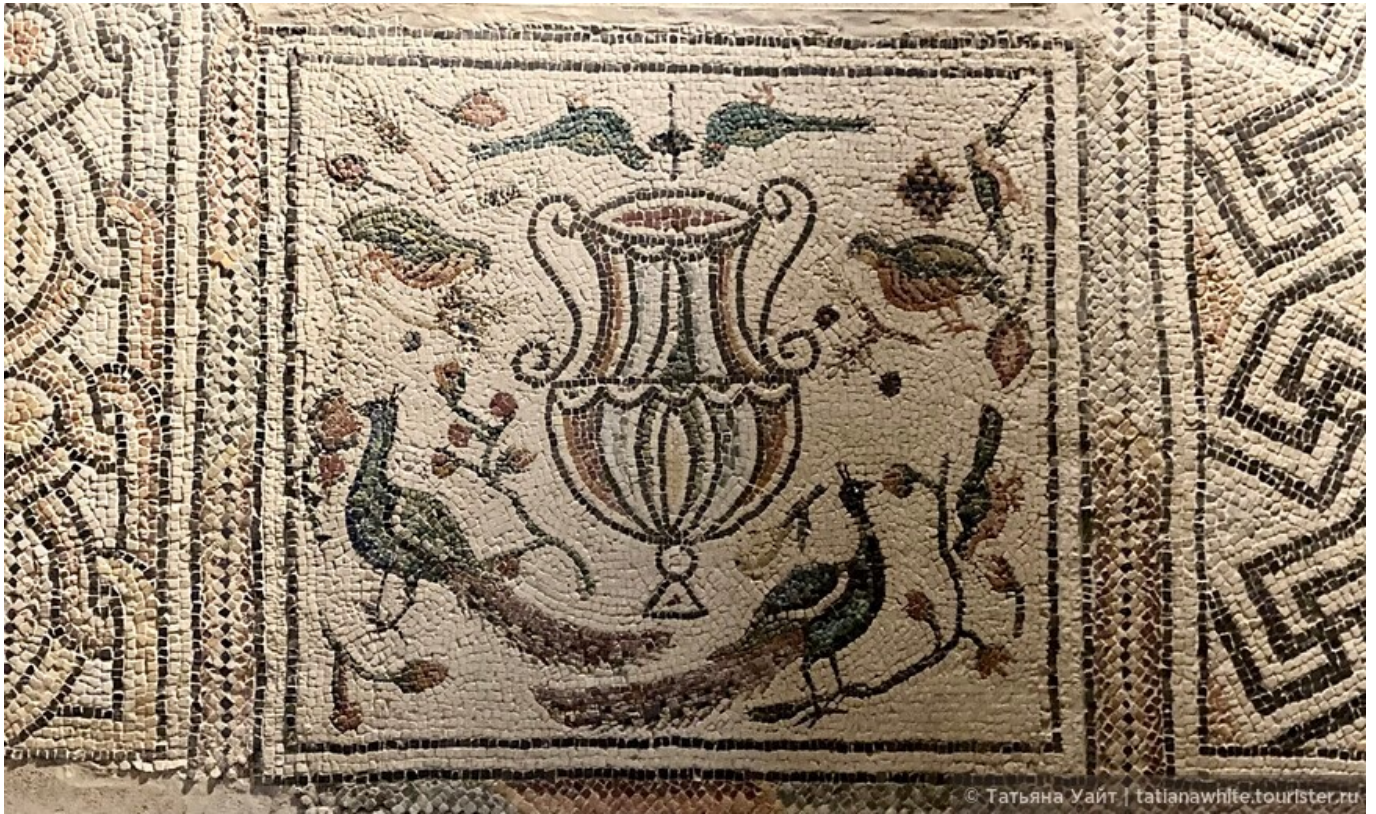
Павлины, райские птички вокруг древнеримской амфоры. Мозаика выполнена из мрамора и различных камней тессеры.