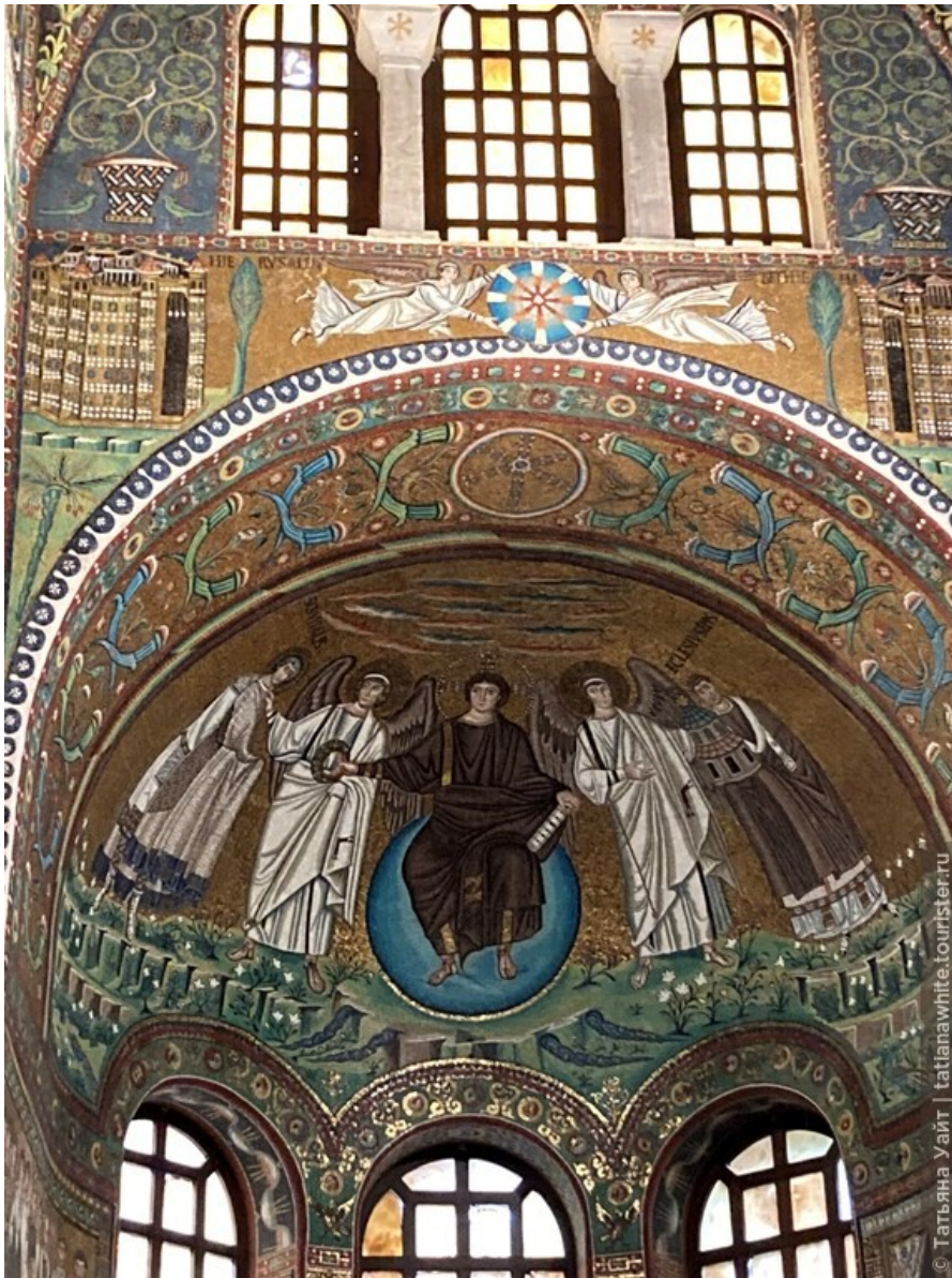
Христос с предстоящими ангелами, мучеником Виталием и святым Экклесием Равеннским