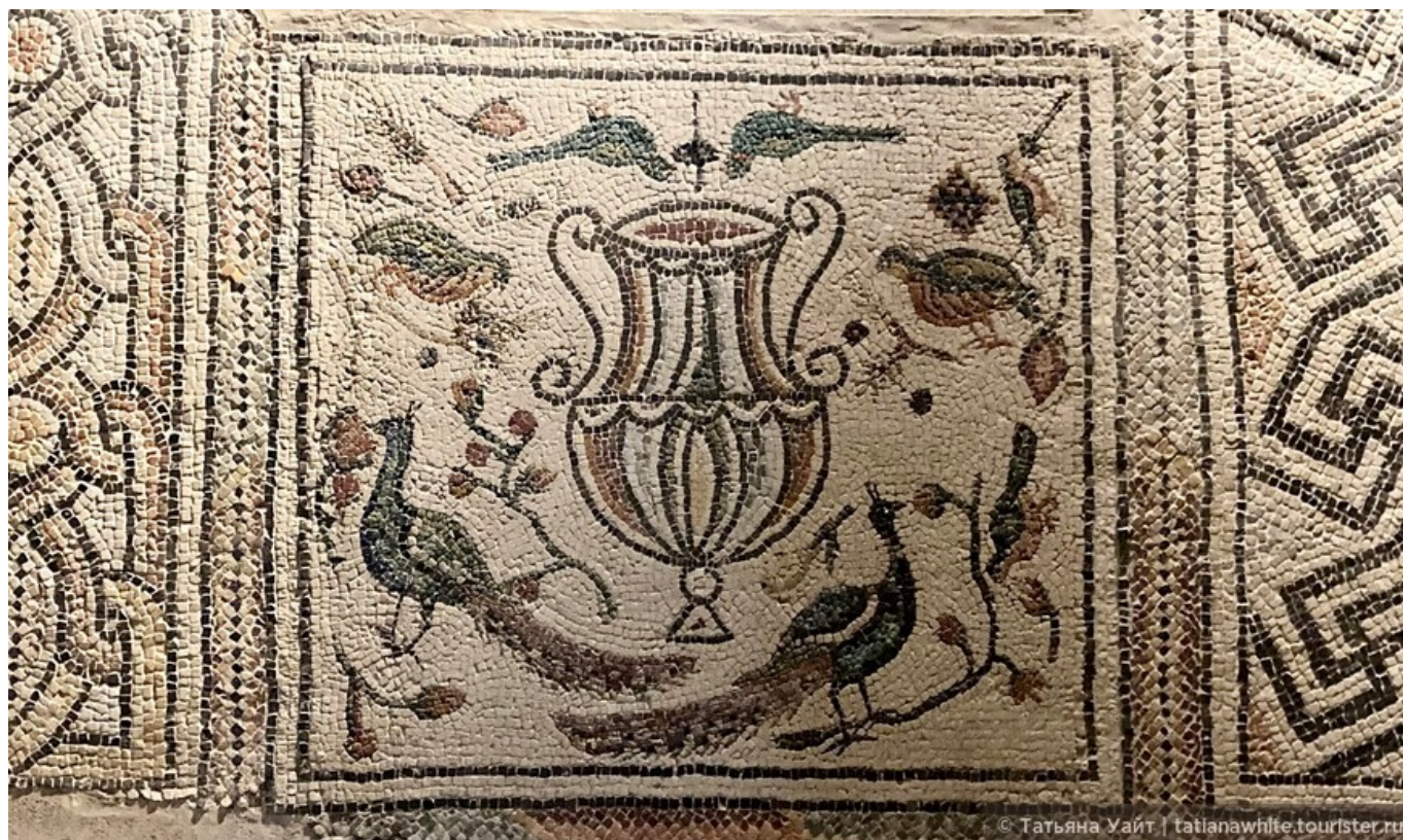
Павлины, райские птички вокруг древнеримской амфоры. Мозаика выполнена из мрамора и различных камней тессеры.