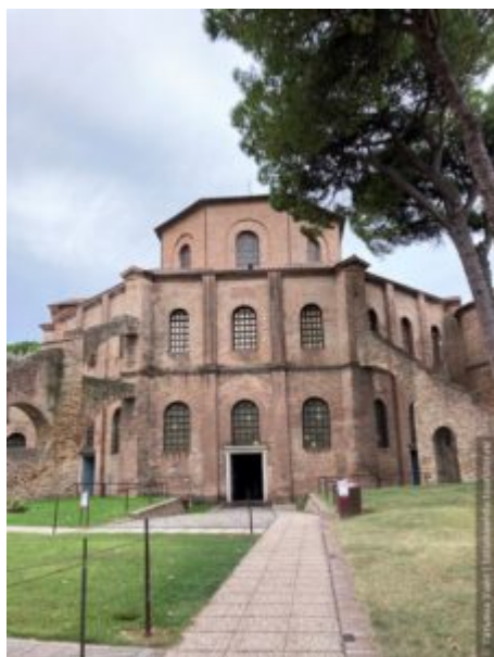
Сан-Витале, Равенна, вид с Галлы Плацидии

Равенна – это настоящая жемчужина северной Италии. Главным сокровищем Равенны являются мозаики, которыми украшены базилики. Среди этих сокровищ – Сан Витале, один из наиболее важных сохранившихся образцов восточно-римской архитектуры, где сохранились византийские мозаики за пределами Константинополя (современный Стамбул). Сан Витале был освящен в 548 году, ставшим своеобразным символом того, Равенна возвращена под Византийский патронат.