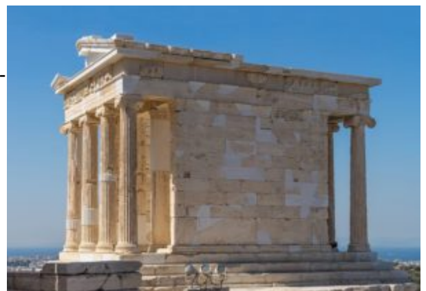
Храм Ники Аптерос

Открывает вход ряд парадных колонн (пропилеи-снаружи дорика, внутри ион). С запада: слева крупные и массивные ворота Пропилеи с колоннами, справа легкий и небольшой храм Ники Бескрылой. Храм Ники Аптерос /Бескрылой Победы (амфипростиль, ионика, в честь победы над персами), стоящий на выступе оборонительной стены Акрополя, своими легкими формами и пропорциями контрастирует с Пропилеями.