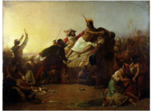
Дж. Э. Милле. Писарро берёт в плен Инку Атауальпу. 1845 г. Лондон, Музей Виктории и Альберта

детализация и внимание к точности показали, что тяжелая работа и преданность делу были вложены в их картины, и, таким образом, продемонстрировали достоинства работы, в отличие от «свободного, безответственного обращения» с техниками старых мастеров или «вызывающая праздность» импрессионизма. Кроме того, они считали долгом художника выбирать предметы, иллюстрирующие те или иные моральные уроки. Ранние работы прерафаэлитов были отмечены включением цветов, которые хорошо соответствовали своему назначению. Цветы можно было использовать практически в любой сцене, их можно было использовать для передачи сообщений на популярном в то время языке цветов, а точная их иллюстрация показала приверженность художника научной точности.