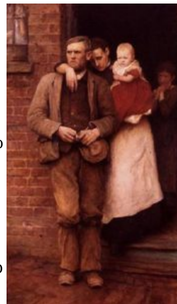
Херкомер. Забастовка. 1891

В Англии второй половины века примеры высокого живописного мастерства представляли, пожалуй, только работы двух подолгу живших там американцев — Уистлера и блестящего, хотя и поверхностного светского портретиста Д.-С. Сарджента. Уистлер оказал воздействие на таких художников, как Уилсон Стир (1860—1942) и Уолтер Сиккерт (1860—1942), основателей Нового английского художественного клуба, но это уже относится к следующему периоду в истории изобразительного искусства Англии.