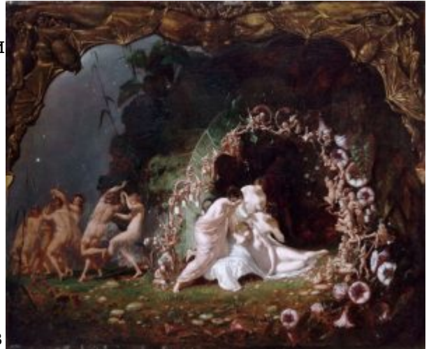
Ричард Дадд. Спящая Титания , 1841

На момент вступления Виктории на престол самым значительным из британских художников был Дж. М. У. Тернер. Тернер сделал себе имя в конце XVIII века благодаря серии хорошо известных пейзажных акварелей, а первую свою картину маслом выставил в 1796 году. Будучи верным союзником Королевской академии на протяжении всей своей жизни, он был избран полноправным королевским академиком в 1802 году в