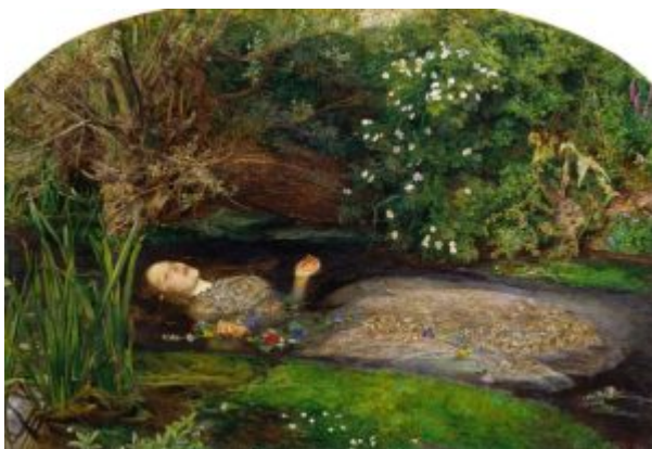
Джон Эверетт Милле. Офелия .

К 1854 году прерафаэлиты распались как организация, но их стиль продолжал доминировать в британской живописи. Со второй половины 50-х гг. начинается новый этап истории прерафаэлитства, связанный с новыми именами. Хант едет в Палестину