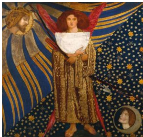
Данте Габриэль Россетти. Любовь Данте. 1860

субъективным и мистичным. Из всех впечатлений действительности остается в его живописи и поэмах только образ его возлюбленной. Он изображает один и тот же вдохновляющий его женский тип то в виде Венеры, наподобие Венер Ренессанса, то в виде Дантовой Беатриче или прекрасных дам из сказаний о короле Артуре и рыцарях Круглого стола. Вне всякого реального пространства, заполняя весь холст, располагаются на нем однообразно красивые лица, руки, узорчатые ткани старинных костюмов, детали утвари. Изломанно декоративным становятся у Россетти линии и фантастическими краски («Любовь Данте», 1859, Лондон, галерея Тейт; «Сон Данте», 1870—1871, Ливерпуль, галерея Уокер, и др.). В живописи Россетти, как и в его литературном творчестве, все более выступают черты будущего декаданса. Но сама пылкость, с какой Россетти воспекает в противовес уродству современности поэзию раннего Ренессанса и эпохи средневековья, завербовывает ему новых союзников.