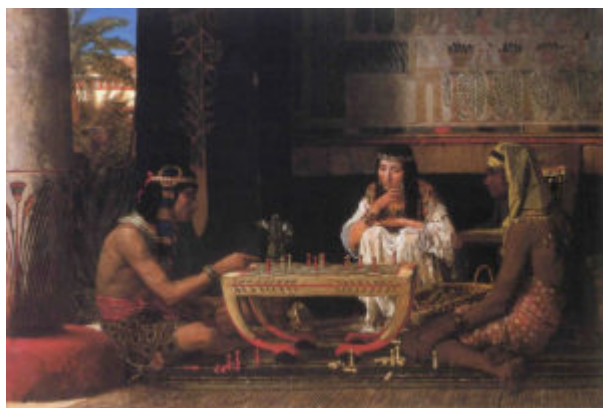
Альма-Тадема. Египетские шахматисты, 1865

В течение столетия сочетание механизации, экономического спада, политического хаоса и религиозной веры делало Великобританию все более неприятным местом для жизни, и население все чаще обращалось к доиндустриальным временам как к золотому веку. В рамках этой тенденции художников привлекали доиндустриальные предметы и техники, а покупателей произведений искусства особенно привлекали художники, которые могли установить связь между сегодняшним днем и этими идеализированными временами, такими как Средневековье, которое считалось периодом в котором зародились ключевые институты современной Британии и который был популяризирован в общественном сознании благодаря романам сэра Вальтера Скотта.