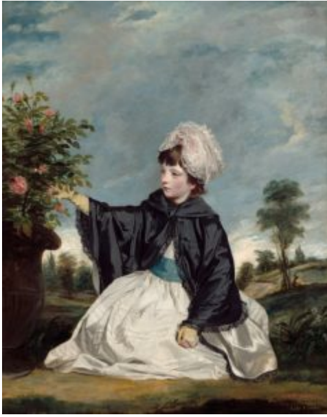
Рейнольдс. Леди Каролина Говард, 1778

не могли позволить себе купить картину, но и стимулировало рост рынка гравюр.