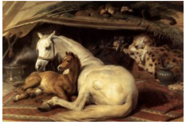
Лендсир. Арабская палатка, 1866 г.

поднималась. Она дает ряд примеров покорности художника мещанским вкусам и требованиям; картина нередко пишется так, чтобы все в ней говорило о затраченном времени, по которому следует оценить ее, подобно товару. Так, Эдвин Лендсир (1802—1873) в лучших своих вещах — крепкий мастер-анималист, продолжатель Морланда создал себе славу и огромное состояние не этими серьезными работами, а созданием умильных сценок, в которых домашние животные, написанные со всей достоверностью, действуют и поступают как добродетельнейшие из людей.