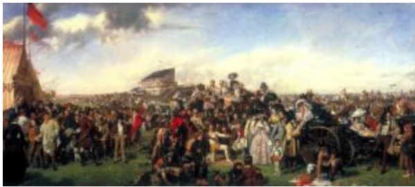
Фритт. День скачек. 1856-58

Жанрист Уильям Фрит (1814—1909) в больших принесших ему известность композициях «День скачек» (1858; Лондон, галерея Тейт) и «Железнодорожный вокзал» (1862; Энглфилд-Грин, Королевский колледж Холлоуэй) выступил как обстоятельный и суховатый хроникер жизни английского общества, а в последующих более мелких вещах стал очень сентиментальным.