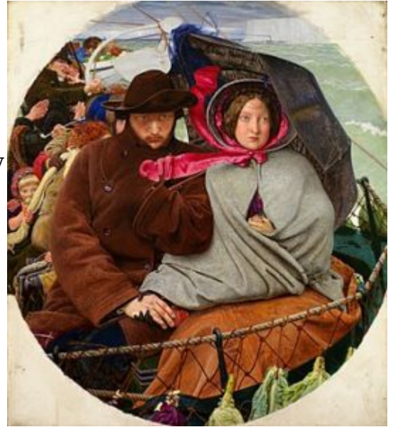
Форд Мэдокс Браун. Прощание с Англией. 1855

Форд Мэдокс Браун (1821— 1893) был менее, как видно из дальнейшего, стойким из этих двух последних романтиков. Браун учился в Антверпене у Вапперса, был в Париже, где испытал влияние Делакруа и начал работать над исторической темой. Но в 1844 г. он едет в Италию и попадает под влияние назарейцев. С тех пор он обращается к религиозности, как к началу, возвышающему искусство («Богоматерь и дитя», 1847 и «Христос, омывающий ноги апостолу Петру», 1852; Лондон, галерея Тейт). Мэдокс Браун отказывается от иллюзии реального пространства; ставит на первом плане крупные фигуры, подчеркивая силуэт и не давая глубины. Браун переносит эти приемы в историческую картину, и в картину с поэтическим сюжетом («Лир и Корделия», 1849; Лондон, галерея Тейт), и в некоторые свои полотна, посвященные современности. Таковы его «Прощание с Англией» (1852—1855; Бирмингем, Художественная галерея) и многофигурная композиция «Труд» (1852—1865; Манчестер, Художественная галерея). «Прощание с Англией» затрагивает тему расставания с родиной