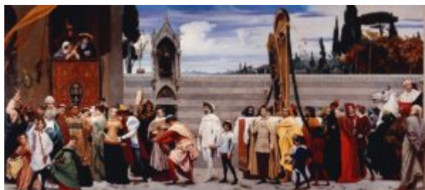
Лейтон. Знаменитую Мадонну Чимабуэ несут процессией по улицам Флоренции, 1853-1855 гг.

своей свидетельством измельчания творческих интересов и деградации мастерства. Пользовавшийся особым успехом при дворе королевы Виктории Фредерик Лейтон (1830—1896) и его последователи — художник голландского происхождения Лоуренс Алма-Тадема (1836—1912) и Эдуард Пойнтер (1836—1919) — даже жизнь древних греков и римлян преподносили как некое комфортабельное, мещански мелкое и благополучное существование; они заполняли выставки своими, как говорит один из современных авторов, «отполированными и чисто вымытыми мраморными залами». Фредерик Уотс (1817—1904) писал портреты