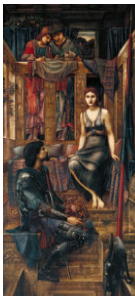
Эдвард Бёрн-Джонс. Король Кофетуа и нищенка. 1884

Эдуард Коли Бёрн-Джонс (1833—1898), как и его учитель, обращался к мифам и средневековым легендам. Он бесконечно варьировал в своих картинах не только мотивы Россетти, но и самый тип лиц, найденный им; в подражание Боттичелли Бёрн-Джонс удлинял свои фигуры, и драпировал он их также наподобие боттичеллевских. Все его произведения написаны в одном эмоциональном ключе — это тоскливое томление, мистическое ожидание чуда, постоянное, но абсолютно бездеятельное и вялое. Мы найдем все это и в сравнительно раннем «Милосердном рыцаре» (1863), и в более поздних картинах — «Король Кофегуа и нищенка» (1880—1884; Лондон, галерея Тейт), «Любовь среди развалин» (1893; там же) и др. В сущности, то отношение к художественному образу, к мифу и легенде, которое дал еще в 50-х гг. Россетти и распространил своими многочисленными полотнами Бёрн-Джонс, было родственно позднему символизму. Характерно, что прерафаэлиты высоко оценили творчество Блейка.