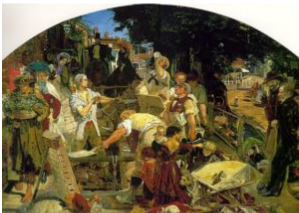
Форд Мэдокс Браун. Труд. 1852—1865

эмигрантов, тему весьма актуальную для того времени. Молодая чета с палубы парохода смотрит на родной берег. Грустная романтичность обстоятельств оправдывает необычную композицию этого тондо. Более нарочитым, искусственным кажется построение картины «Труд», завершённой сверху полукружием. Центральную и наибольшую ее часть занимает группа рабочих, прокладывающих на городской улице газовые трубы. Вокруг них разворачивается хорост других фигур. Тут прохожие, нищий, устыдившийся просить милостыню и принесший цветы на продажу, дети и в глубине — аристократическая чета, подъехавшая верхом посмотреть на работы. Здесь можно найти очень конкретные характеристики, вполне английские, принадлежащие именно 50-м гг. фигуры и даже портреты (один из руководителей работ,