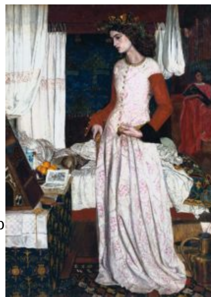
Моррис. Прекрасная Изольда, 1858

борьбы за социализм. В ранний период своей деятельности, период сближения с Россетти, Рёскином и Бёрн-Джонсом, Моррис смотрит на искусство как на главное средство пропаганды возврата к творческому труду и возлагает на эту пропаганду очень большие надежды. Вернуть человеку радость труда можно, как кажется ему и всем прерафаэлитам, возродив художественное ремесло. Он видит в простых старинных сельских домах и их убранстве произведения «благородного народного искусства» и поднимает вопрос об их охране, а в 1877 г. создает Общество Защиты старых зданий. Друг Морриса архитектор Ф. Уэбб проектирует для него в 1859 г. так называемый «Красный дом», который был первой рациональной попыткой использовать для современного индивидуального жилища тип скромных английских коттеджей. Моррис сам осваивает различные ремесла: делает мебель, учится ткать. В 1861—1862 гг. он вкладывает много сил в организацию