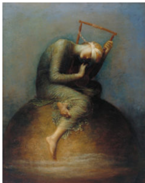
Уотс. Надежда. 1886

наиболее популярных своих современников и претенциозные аллегории: «Надежда» (1886), «Так проходит слава мира» (1892), «Любовь и смерть» (все в лондонской галерее Тейт), — в которых нет ни признака какого-либо собственного видения: это безвкусная смесь впечатлений от старых мастеров и от фантазий прерафаэлитов. Развлекательно-интригующие сюжеты из жизни высших слоев общества создавали жанристы типа модного У. Орчардсона (1832—1910).