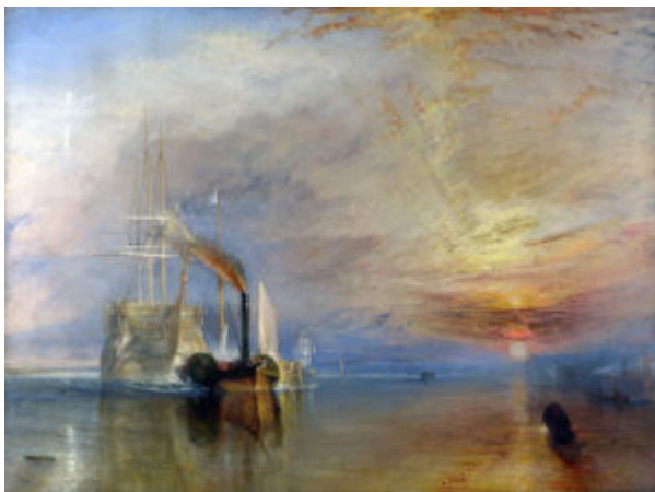
Тернер. «Последний рейс корабля „Отважный“», 1838

возрасте 27 лет. В 1837 году он ушел в отставку с поста профессора перспективы в Королевской академии, а в 1840 году впервые встретился с Джоном Рёскином. Первый том «Современных художников» Рёскина был защитой Тернера, утверждая, что величие Тернера развилось вопреки, а не благодаря влиянию Рейнольдса и последующему желанию идеализировать сюжеты его картин.