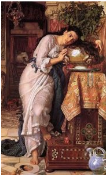
Хант. Изабелла и горшок с базиликом, 1867

В 1848 г. под влиянием Мэдокса Брауна и через него — немецких назарейцев — возникает «братство