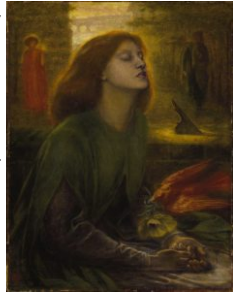
Россетти. Beata Beatrix , 1864—1870. Портрет Элизабет Сиддал

Марии», 1849; «Благовещение», 1850; «Беата Беатрикс», 1863; «Сон Данте», 1870—1871) и Э. К. Берн-Джонс (1833—1898; «Золотая лестница», 1876—1880; «Король Кофетуа и нищенка», 1880—1884; «Любовь среди развалин», 1893; иллюстрации к сочинениям Дж. Чосера, 1896) тяготели к символизму, к декоративному изыску. Холман Хант (1827—1910; «Светоч мира», 1852—1854; «Пробуждение совести», 1853—1854) и Д. Э. Милле (1829—1896; «Лоренцо и Изабелла», 1849; «Христос в доме родителей», 1850; «Офелия», 1852; «Страж Тауэра», 1876) — достигали почти натуралистической достоверности в своих картинах на литературные и религиозные сюжеты с их резкими цветовыми соотношениями и тщательно выписанными деталями. Для прерафаэлитов вообще характерна дилетантская смесь натурализма со стилизацией — при слабом рисунке, подчас невнятной композиции и отсутствии пластической ясности.