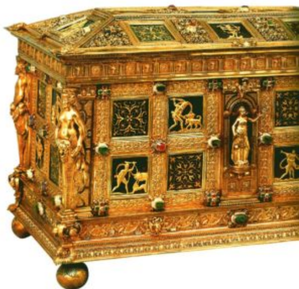
Ларец для драгоценностей с изображением подвигов Геракла. Венцель Ямницер, 1550 — 1560 гг. Золото, бриллианты, рубины, изумруды, гелиотропы

Самой большой известности достигли золотых дел мастера Нюрнберга. Особенной популярностью в Европе пользовались изделия семьи Ямницер. Самым выдающимся из них был Венцель Ямницер, организовавший собственную семейную мастерскую — тонкий виртуоз ювелирного искусства, но в то же время манерный и вычурный художник. В мастерской изготовлялись роскошно декорированные кубки , рукомои, кувшины, блюда и настольные украшения. Типично ренессансное изделие — кубок-наутилус, в виде раковины, оправленной серебро, на скульптурной ножке.