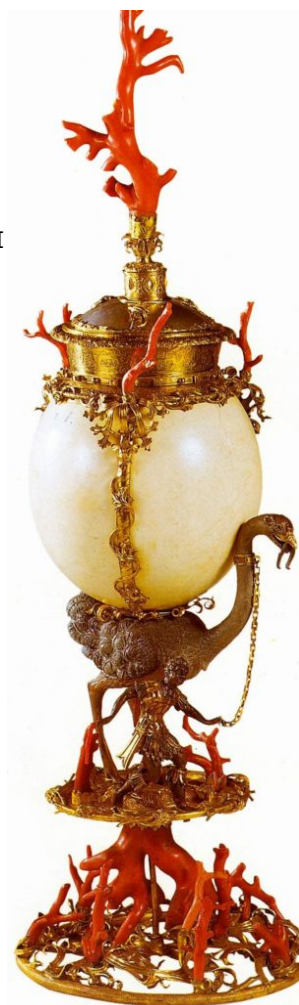
Кубок, 16 в. Кораллы, страусиное яйцо. Художественно- исторический музей, Вена

В ювелирном деле эпохи Возрождения, как и во всей художественной культуре эпохи нарастает процесс индивидуализации творчества. Мы знаем все больше имен создателей замечательных произведений ювелирного искусства этого времени.