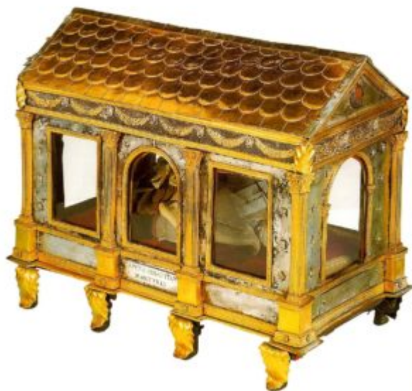
Реликварий Святого Себастьяна. 15 в. Серебро, позолота, эмаль. Собор Святого Петра, Рим

В эпоху Возрождения ювелирные украшения в больших количествах производятся как из драгоценных, так и из простых материалов, распространяясь во всех слоях общества.