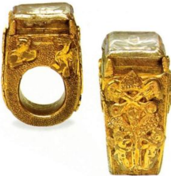
Кольцо-рыбка. Конец 15 в. Бронза, горный хрусталь; позолота, гравировка. Рим. Принадлежало папе Сиксту IV

Самыми распространенными видами колец в эпоху Ренессанса были тяжелые, массивные формы с камнями и геммами в оправках из благородного металла и кольца-печатки. Живому интересу к естественным наукам в это время отвечали кольца с часами и математико-астрономическими инструментами. Существовали также «кольца-близнецы», которые порознь украшали руки обрученных. По заключении