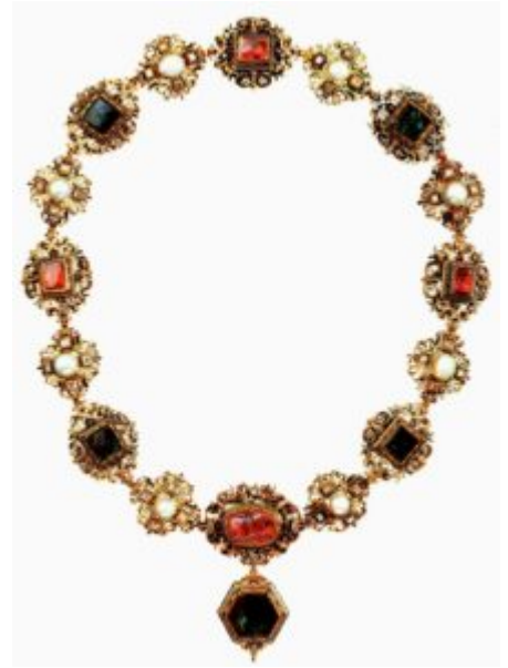
Орнаментальная цепь. Ханс Милих, 1575 г. Золото, жемчуг, бриллианты, рубины- шпинели; эмаль. Мюнхен

Нарядная ренессансная мода пробудила и серьги . Особенное развитие они получили на севере Италии. Для украшения женских головок использовали драгоценные камни и крупные грушевидные жемчужины. Именно отсюда любовь к серьгам постепенно распространяется по всей Европе. К началу XVII столетия серьги становятся исключительно женским украшением.