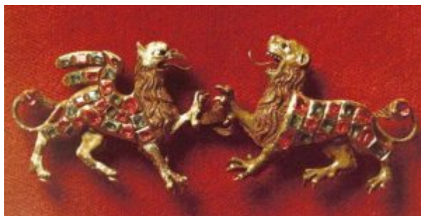
Застежка «Лев и грифон». 16 в.

Золото, драгоценные камни; литье, эмаль. 3,5 x 9 см. Московский Кремль, Оружейная палата. Изготовлено в Западной Европе