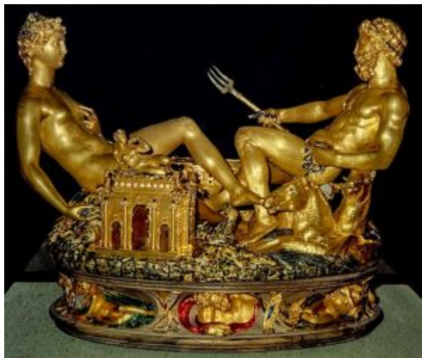
Солонка Франциска I «Нептун и Церера». Б. Челлини, 1543 г. Золото, эмаль. Имперская сокровищница, Вена

Замечательный памятник ювелирной работы этого времени – знаменитая золотая солонка Франциска I , выполненная флорентинцем Бенвенуто Челлини. Крышку солонки венчает скульптурная группа: Нептун с трезубцем, в окружении морских коней, и Церера, возле которой размещена модель храма (перечница). Основание композиции составляет рельефный фриз, обнимающий тулово солонки. Здесь размещены аллегорические фигуры – Утро, День, Вечер, Ночь, навеянные образами Микеланджело из гробницы Медичи во Флоренции. Лежащие фигуры чередуются с символическими изображениями ветров.