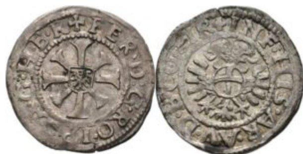
Пфенниг. 1533-54 гг.

На развитие форм подвесок Ренессанса оказали влияние великие мастера - живописцы и граверы - Альбрехт Дюрер, Ганс Гольбейн, Мартин Шонгауэр. Своеобразными «фаворами» являются немецкие жалованные пфенниги с портретом государя, которые носили на груди на жалованной цепи.