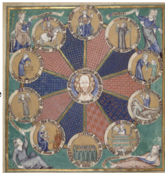
Псалтырь Роберта де Лиль, f.126v

В 14 в. окончательно выработались принципы украшения страницы. В орнамент введены стрельчатые арки и другие архитектурные детали готической архитектуры, удлинены пропорции фигур. Четко написанный текст украшен красочными инициалами. Иногда инициалы заполняют собой всю длину листа и содержат несколько миниатюр; чаще инициалы-сценки находятся непосредственно в тексте, а вся страница украшена рамкой, разнообразной по оформлению. Особенную ценность представляют комические дролери — жанровые сценки, расположенные за рамкой или внизу листа. Им присущи народный юмор и жизненность исполнения.