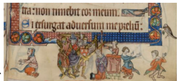
Псалтырь Лутрелла, f.51r

конце строчек очень характерны для этой рукописи, а также для известной псалтыри Лутрелла (1340, Британский музей). Изображения работы на полях под бичом надсмотрщика, стрижки овец, соревнования в стрельбе из лука и бракосочетания следуют одно за другим и создают картину жизни различных слоев английского общества. Рукопись имеет не только художественную, но и познавательную ценность; это, по существу, вершина развития английской миниатюры.