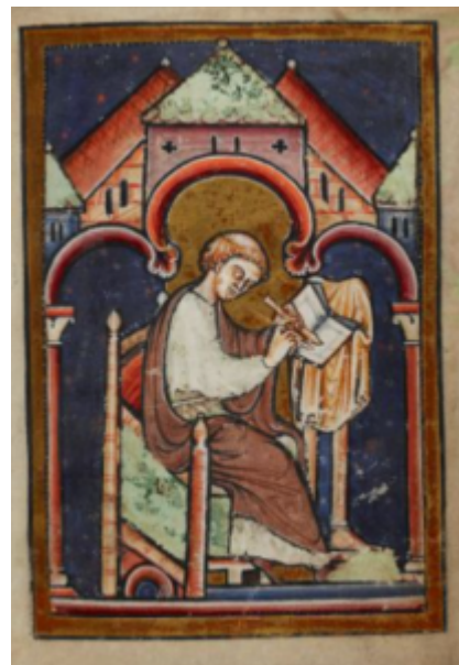
Житие св. Кутберта, 2v

переписывалось большое количество полусветских произведений. Например, Житие св. Кутберта (12 в., Британский музей) украшено небольшими миниатюрами — сценками, лишенными орнамента, но исполненными с живым воображением и наблюдательностью. Миниатюра «Св. Кутберт пишет завещание» напоминает вместе с тем своей лаконичностью и простотой росписи церковью романского периода. Такие миниатюры, как «Жизнь св. Гутлака», насыщенные действием и движением (например, эпизод мученичества святого), в дальнейшем нашли отклик на страницах более поздних европейских Апокалипсисов.