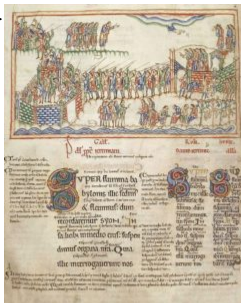
Псалтырь Эдвина , f.243v

— новыми по тематике и по композиционному решению. Сравнительная характеристика двух рукописей (подлинника и копии) позволяет выявить свойственные кентерберийской школе черты, внесенные переписчиками. В данном случае художники смело соединили библейские сюжеты со сценами из жития саксонских и кельтских святых, украсили инициалы персонажами легенд о короле Артуре. Превосходна миниатюра, на которой изображен монах-переписчик Эдвин; несмотря на декоративность драпировок, его фигуре, склоненной над манускриптом, присущи сосредоточенность, сдержанность, монументальность. Чуть подцвеченные коричневым и голубым, миниатюры лаконичны по рисунку и необычайно выразительны.