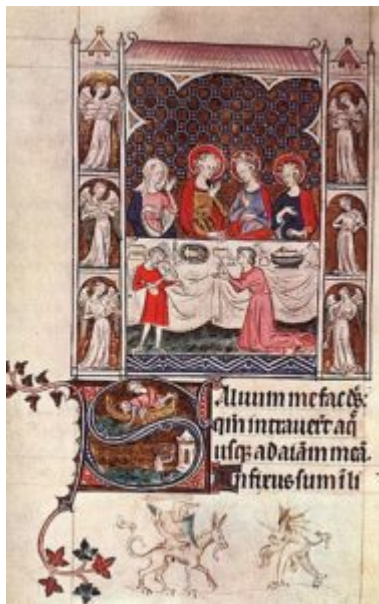
Псалтырь королевы Мари, f.168v

Крупнейший памятник восточноанглийской школы — так называемая псалтырь королевы Марии (Британский музей) — создан в 1320 г., очевидно, для короля Эдуарда II. Рукопись содержит 60 больших миниатюр, 233 раскрашенных рисунка и более 400 рисунков пером. Религиозные темы, например «Брак в Кане Галилейской», тракуются как современные художнику события: слуги и музыканты одеты в костюмы Англии 14 в. Характеристика персонажей удивительно жизненна: мы узнаем почти каждого из них, когда он появляется в другой миниатюре.