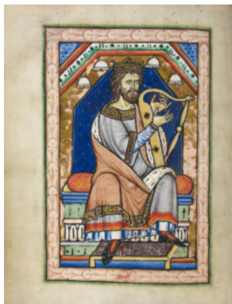
Вестминстерская Псалтырь, 14v

Вестминстерская Псалтирь, несколько псалтирей Питерборо, в том числе Линдси, Псалтирь для настоятеля Ившема, иллюминированный экземпляр для монахини Амсбери середины XIII века, богато украшенный Псалтирь Оскотта, который, возможно, был сделан для будущего папы Адриана V, который занимал свое место только 36 дней в 1276 году, и Псалтирь Альфонсо.