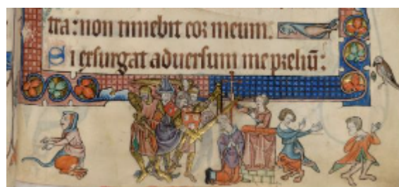
Псалтырь Лутрелла, f.51r

конце строчек очень характерны для этой рукописи, а также для известной псалтыри Лутрелла (1340, Британский музей). Изображения работы на полях под бичом надсмотрщика, стрижки овец, соревнования в стрельбе из лука и бракосочетания следуют одно за другим и создают картину жизни различных слоев английского общества. Рукопись имеет не только художественную, но и познавательную ценность; это, по существу, вершина развития английской миниатюры.