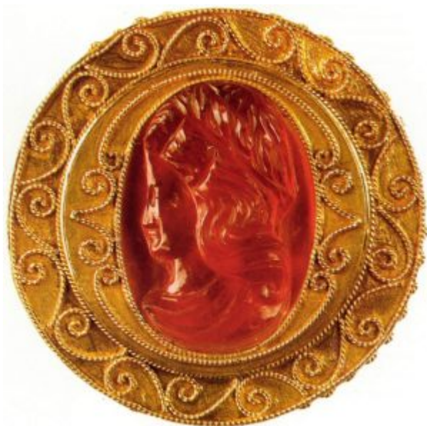
Каменя. Фрагмент украшения скипетра «Длань справедливости французских королей». 12 век. Сапфир. Лувр, Париж, Франция

В других странах Европы в это время особенно процветает