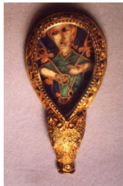
Драгоценность короля Альфреда/ Золото, эмаль. 871-899 гг. Оксфорд, музей Эшмолеан

Декоративные искусства этого времени во всех странах Европы имели две категории заказчиков: церковь и феодальная знать. Духовенство в свою очередь делится на белое, представители которого заказывают художественные изделия, и черное – монахов, которые, как и мирские ремесленники, создают их сами. Некоторые аббатства снискали славу именно благодаря работам своих мастеров, среди которых были и ювелиры.