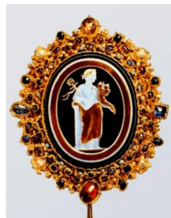
Шаффхаузенский оникс, брошь. Около 1230 г. Золото, позолоченное серебро, сапфиры, бирюза, гранаты, жемчуга, сардоникс. Высота 15 см; ширина 12,5 см. Музей Шаффхаузен. Сама камея была создана в 1 в., а оправа в романскую эпоху

В Романскую эпоху искусство Ирландии развивается уже не так изолированно, как в предшествующий период. Это ничуть не вредит оригинальности произведений ирландских мастеров. В это время среди ирландских ювелиров распространен декор из кабошонов и характерной плетенки . Так декорированы знаменитый посох из Клонмакнойса и футляр колокола из собора Сен-Дени в Дублине с декором из кабошонов и характерной ирландской плетенки. Именно в Ирландии родилась традиция почитания священными реликвиями колоколов первых христианских проповедников и отшельников. Здесь же впервые для их хранения стали изготавливать пышно украшенные футляры - реликварии.