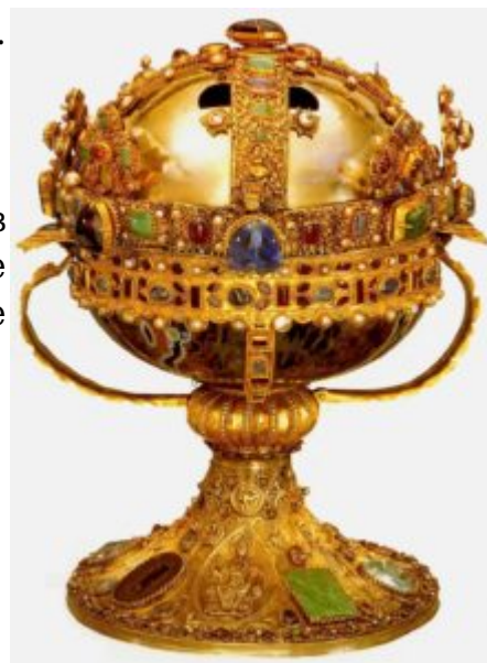
Реликварий Святой Елизаветы. 11 — середина 13 века. Золото, серебро, агат, драгоценные камни, геммы. Государственный исторический музей, Стокгольм

Ювелирное искусство развивалось и в романской Франции. Выдающееся по замыслу и прекрасное по выполнению произведение — ваза из порфира в золотой чеканной оправе, напоминающей по форме орла с раскрытыми крыльями и хвостом (Париж, Лувр); эта ваза происходит из сокровищницы Сен-Дени и свидетельствует о смелом вкусе аббата Сугерия. К романскому стилю принадлежат и такие превосходные произведения, как реликварий в форме креста с двумя перекладинами из монастыря Ла-Рош-Фулк близ Анжера, декорированный с лицевой стороны кабошонами в филигранной оправе, а с оборотной стороны — растительным завитком.