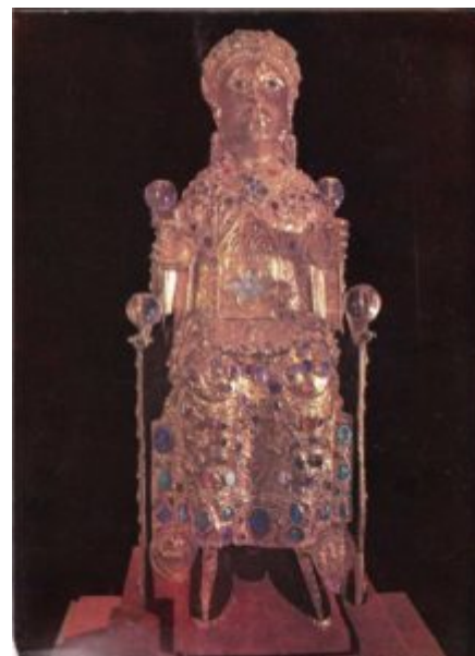
Статуэтка-реликварий св. Веры. Дерево, плакированное золотыми листьями с чеканным узором. Франция. Конк

Орнаментально-декоративные формы искусства этого времени отличались чрезвычайным богатством. Особенно высоко стояла техника художественной обработки металлов, в частности ювелирное дело. Памятники этого искусства распространены на огромном протяжении, от берегов Черного моря до Британских островов, и во множестве были найдены в погребениях и кладах. Чаще всего встречаются фибулы (застежки, пряжки), украшения, оружие, декоративная утварь, а со времени принятия христианства — также предметы культа: чаши, кресты, оклады церковных книг. Археологические открытия последних пятидесяти лет подтвердили, что это искусство не было создано в эпоху переселения народов, оно уходит корнями в глубь веков.