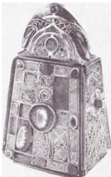
Футляр для колокола из собора Сент-Патрик. Ирландия

Романские ювелиры владели всеми техниками, известными со времен античности: ковкой, чеканкой, филигранью, соединение клепкой. Большое распространение получает эмаль по чеканному рельефу. Яркие цвета эмали великолепно сочетались с блеском золота. В романскую эпоху широко бытовали застежки для плащей , восходящие к ранним дисковидным, круглым и квадрифольным фибулам. Они изготовлялись из тонкого золота в технике филигрании с эмалью и украшались драгоценными камнями со сферической поверхностью, жемчугом. Для центральных вставок нередко использовали античные камеи, далеко не всегда соответствующие своему новому сакральному предназначению. Они применялись для одежды духовенства, вплоть до XIII века.