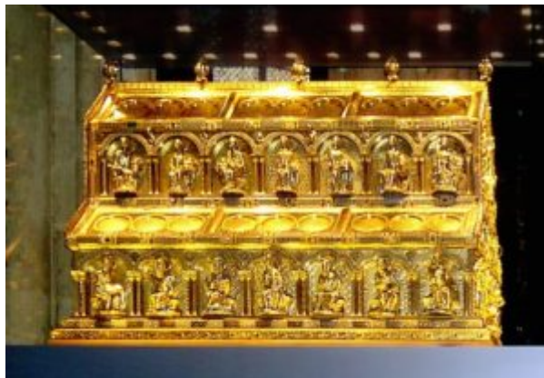
Рака трёх царей-волхвов

В Италии наряду с обильным ввозом ювелирных изделий из Византии производятся прекрасные ларцы и реликварии из чеканного серебра, как, например, образцы из Чивидале (Фриуль) или из Нонантолы близ Модены. Они имели разнообразный декор; то довольно строгий, то обильный, но гармоничный. Чаши украшались изысканными филигранными полуциркульными арочками с Деисусом и фигурами апостолов под ними, реже они бывали гладкими. Массивное яблоко под чашей также могло быть либо гладкое, либо филигранное. Ножку украшали медальонами с фигурами евангелистов.