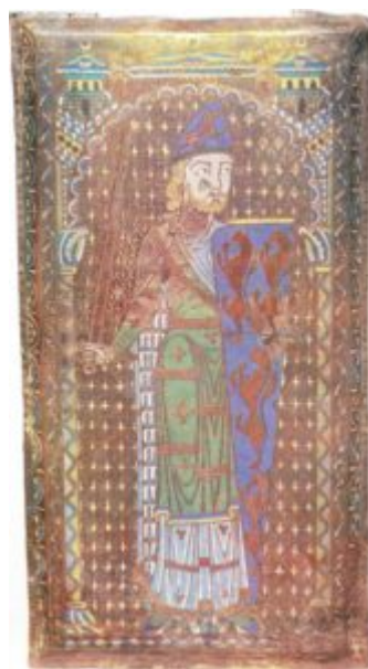
Надгробная плита с изображением Жоффруа

Громкую славу далеко за пределами Франции снискали изделия лиможских эмальеров.