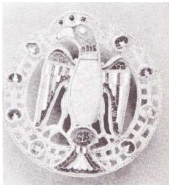
Брошь с геральдическим орлом, предположительно принадлежавшая императрице Гизеле; золото и перегородчатая эмаль. Германия

в которую вправлялась римская гемма или камея, или драгоценный камень – плоский или кабошон.