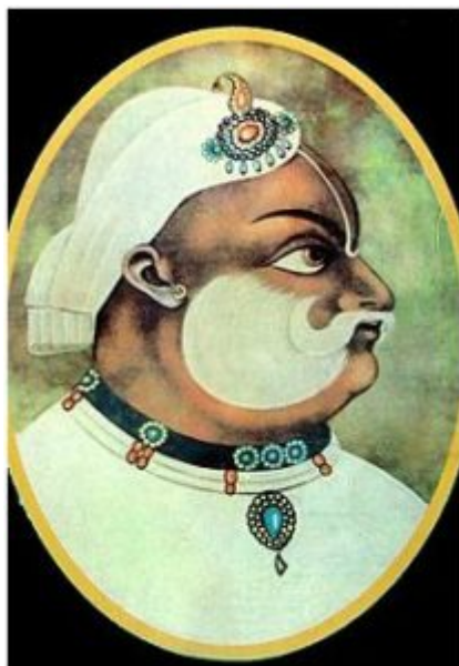
Таков же портрет раджи Бирбала кисти художника Нанха.

Нередко фигура обрисовывалась одной текучей контурной линией светлого цвета, а голова выписывалась тщательно и с применением расцветки. Эта техника «сахи калам» применена, например, в портрете (ок. 1630 г.) неизвестного знатного мужчины. Этот прием создает уравновешенность цветовых сочетаний. Главный результат техники сахи калам – сосредоточение внимания на лице и голове портретируемого.