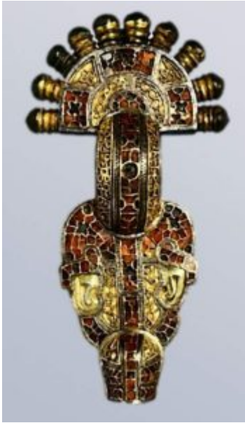
Фibuла из Виттислингена. Около 625 г. Золото, серебро, гранаты. Длина 16 см. Национальный музей ранней истории Баварии, Мюнхен

бытовали подвески из благородных металлов, украшенные цветными и резными камнями, эмалью, чернью, филигранью, зернью, рельефными и живописными изображениями. Установлением христианства драгоценные изделия стали широко использоваться для оформления богослужения (чаши, кресты, оклады церковных книг) и как votivные предметы. К ним относятся бляшки паломников раннего средневековья, мощевики в форме креста и ларчики - футляры.