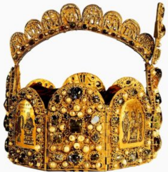
Корона Германской Империи. Около 960 — 980 гг. Золото, самоцветы, жемчуга, перегородчатая эмаль. Высота 15,6 см; диаметр 20,9 x 22,2 см. Художественно-исторический

Государственный исторический музей, Стокгольм. Изделие могло служить амулетом или ценным даром при заключении соглашений между верховными вождями в Скандинавии в этот период. Один изображен в состоянии шаманского экстаза, с закинутыми назад ногами. Найдена на острове Уппланд