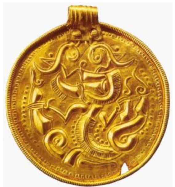
Подвеска из Содебрю. 4 — 6 век. Золото; филигрань.

Драгоценные украшения были связаны с древней магией и выполняли функцию знаков отличия королей и вождей, свидетельствующих об их богатстве и могуществе. У германских племен, как и у других народов времен великого переселения,