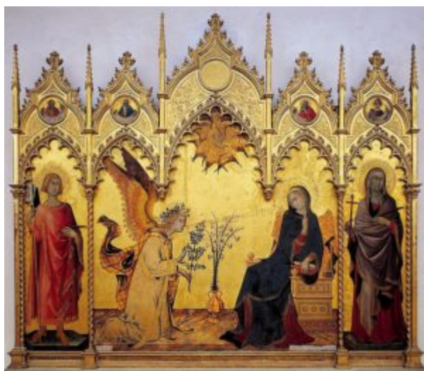
Симоне Мартини и Липпо Мемми. Благовещение. 1333. Уффици. Флоренция

После смерти Джотто в 1337 году его влияние постепенно ослабевает, и кажется находит отклик только у сиенских мастеров, в особенности у Симоне Мартини [6] . Усиливаются реакционные тенденции готического искусства, кажется канон вновь начинает преобладать и отвоевывать свое, но в конце триченто мы можем упомянуть двух живописцев - Авацо и Альтикьеро, венецианцы, работавшие по всей Италии, особенно в Падуе, где вероятно и могли воспринять наследие Джотто (фрески Капеллы дель Арена), что явно отражается в цикле фресок в капелле Сан Джорже в Падуе, в которых художники продемонстрировали мастерство наблюдения и собрали галерею ярких образов городских жителей своей