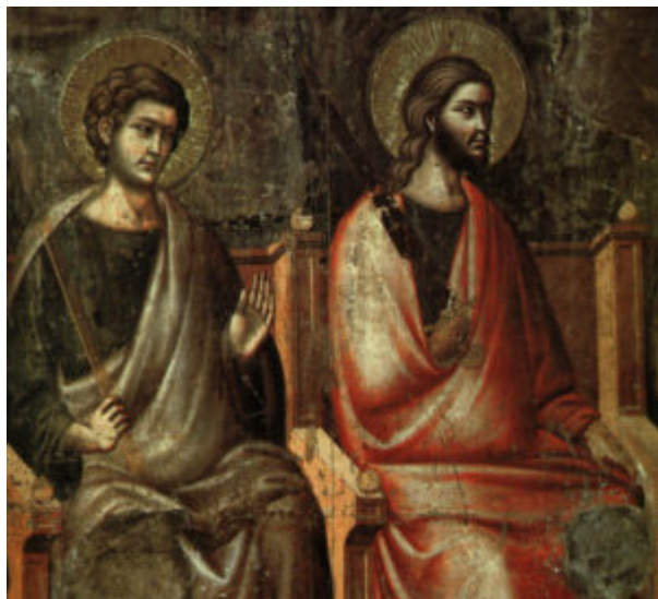
Страшный суд (деталь), Пьетро Каваллини (1295-1300)

Та наблюдательность, которая приписывается Вазарию Джотто была освоена сначала на севере (Страсбург, Наумбург) в скульптуре. Именно скульпторам удалось первым решить задачу подбоя, отрешившись от проблем создания пространственной глубины. А вот перенести этот опыт в живопись получилось итальянцам. Гомбрих связывает это с «эллинистическим наследием», которое сохранилось в византийской живописи и переходила из века в век [4]. «В отвлеченных, статичных канонах были законсервированы античные приемы светотеневой моделировки и ракурсных сокращений». Потому также принято искать истинного учителя Джотто не в скованном традициями Чимабуэ, а в Каваллини. Именно им были проторены первые дорожки, которые Джотто превратит в пути. Так Каваллини в первую очередь был римским мастером и явно работал с античными образцами. Во фресках в церкви Санта Чечилия ин Трастевере в Риме, он решает проблему формообразования весьма смело: сильная светотеневая моделировка, превращающая фреску в «рельеф». Он дает особенную живость лицам, но оставляет тела статичными, его образы выделяются из общего числа, но остаются отстранёнными и холодными. Джотто воспринял у него светотеневую моделировку, особое понимание пространства, а римская традиция, тяготевшая в многофигурным композициям (прежде всего развивавшаяся в скульптуре, вспомним хотя бы рельефы Джованни Пизано), помогла ему в преодолении многих условностей византийской традиции.