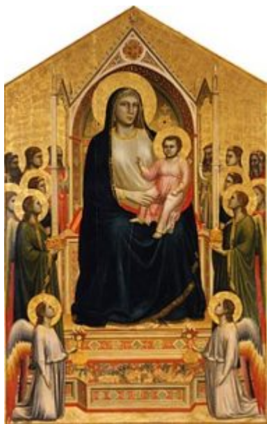
Мадонна Онъисанти. Около 1310 г. Уффици, Флоренция

С именем Джотто также связаны и одни из первых (но не дошедших до нас) светских портретов, а также образцы великолепной алтарной живописи — «Мадонна Онъисанти» (1306-1310, галерея Уффици, Флоренция), «Погребение