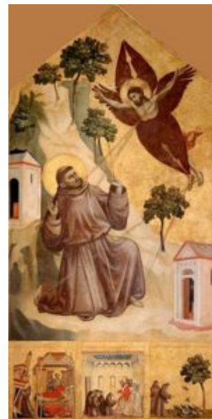
Стигматизация св. Франциска. 1295-1300гг. Лувр, Париж

Не всем художникам удалось порвать с традицией, но влияние Джотто распространялось и постепенно преобразовало итальянскую живопись. В « Благовещении » Симоне Мартини и Липпо Мемми фигура Мадонны хотя и кажется чрезмерно одухотворенной и бестелесной, но в драматичном развороте тела, в экспрессивном жесте и буйстве драпировок ее одежд и одеянии архангела Гавриила, уже нет той отстраненности, какая была присуща мастерам начала века. Мастера стремятся добавить жизнеподобия и потому вводят роскошный мраморный, вполне реальный пол и правильно смоделированную вазу.