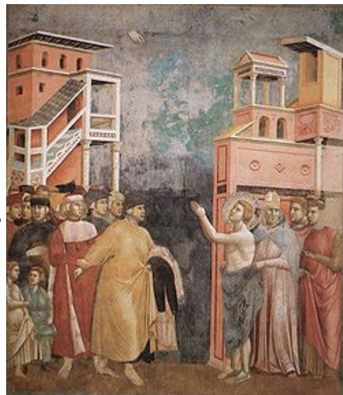
Франциск Ассизский отказывается от имущества. Фреска в церкви Сан-Франческо в Ассизи

В цикле фресок посвященных житию Франциска Ассизского Джотто