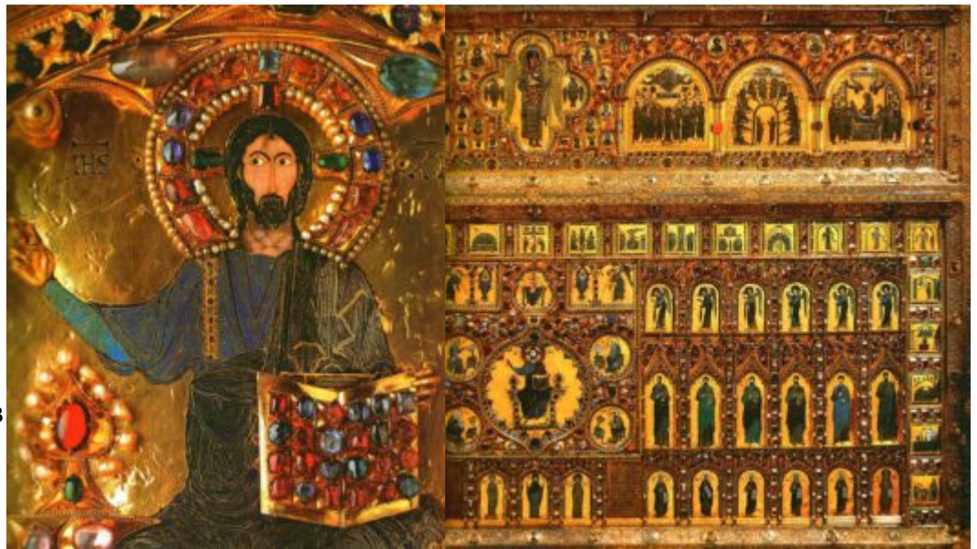
Центральное клеймо с изображением Христа Вседержителя на троне. 10 — 12 век. Золото, драгоценные камни, жемчуг;

произведение искусства византийской эмали — знаменитый Золотой алтарь Пала д'Оро , привезенный из Византии в Венецию и хранящийся ныне в соборе св. Марка. Это золотая с серебром пластина (2 X 3 м), украшенная драгоценными камнями и эмалевыми медальонами с