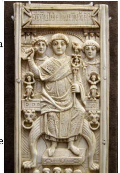
Створка диптиха из слоновой кости Ареобинда Дагалаифа Ареобинда, консула в Константинополе, 506 г.

датировать, относятся к периоду 406-540 годов. Однако многие из них дошли до наших дней не целиком, а в разрозненном виде, отдельными створками. Обычно на створках изображались игры, происходившие в честь консула на ипподроме. На одной из таких створок, хранящейся в Государственном Эрмитаже, представлен консул Ареобинд, избранный в 506 году в Константинополе. Диптихов этого консула сохранилось довольно много. Они принадлежат сейчас собраниям музеев Милана, Цюриха, Безансона. На эрмитажной створке консул, одетый в роскошно орнаментированное платье, изображен в тот момент, когда он дает знак к началу состязаний на ипподроме. В левой руке у него скипетр, на котором помещены две маленькие фигурки. У одной из них в руках свиток. Именно этому консулу, Ареобинду, император Анастасий пожаловал кодекс его прав, о чем и напоминает фигурка со свитком. На поле же ипподрома в тот момент, когда консул изображен дающим знак к началу состязания, уже показан следующий момент: игры в полном разгаре. Один гимнаст перепрыгивает через палку, другой — упражняется на турнике. Карусель с двумя корзинами, в которых сидят люди, крутит медведь. Актер декламирует, патетически жестикулируя.