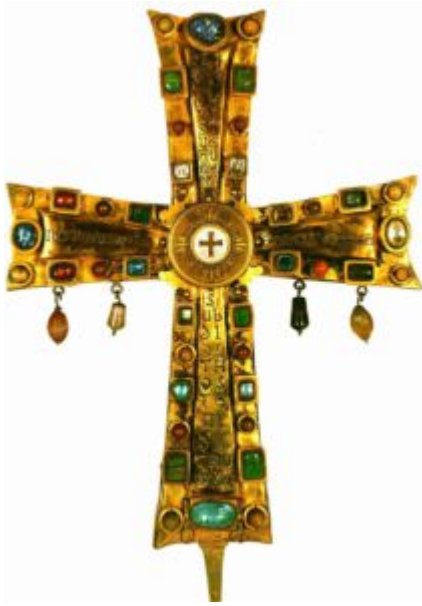
Ватиканский Крест. 2-я пол. VI века. Серебро, медь, изумруды, яшмы, агаты, перламутр, аквамарины, стеклянная паста; позолота, гравировка. Капитул собора Святого Петра, Рим

Расцвета Византия достигает в эпоху правления императора Юстиниана (527 - 565 гг.).