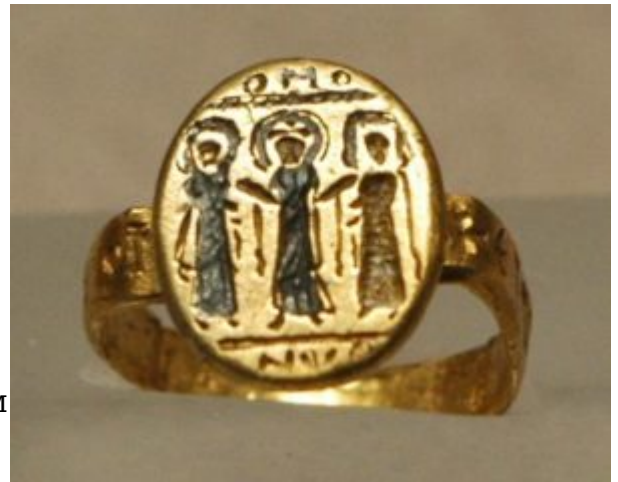
Золотое обручальное кольцо, VII век

Наибольшую славу византийским златокузнецам и ювелирам принесли эмали. Отсюда они проникли в Европу, как западную, так и восточную. К числу шедевров византийской эмали относится вотивная корона с изображением императора Василия I среди апостолов, датированная началом X века и пластины книжных окладов из библиотеки Св. Марка в Венеции и Сиенской библиотеки.