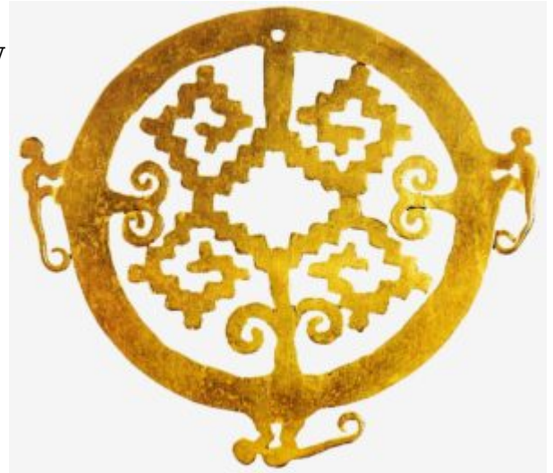
Круглое украшение. 650 — 1200 гг. Золото. Музей золота, Лима. Подвеска или нашивка на одежду. Принадлежит цивилизации Нариньо, существовавшей на границе теперешних Колумбии и Эквадора

Боготе. В этой коллекции есть антропоморфные нагрудные украшения культуры кимбая (около V века) из района Толимы, состоящие из золотых пластинок с резным рисунком. Там имеются также тонкие ажурные кольца для носа из Долина реки Сину, выполненные литьем по восковой модели, ожерелья, ложки, колокольчики, пинцеты для удаления волос, фигурки животных, декоративные булавки для одежды, зооморфные фигурки из тонкого листового золота, склепанного по краям. Колумбийские ювелиры умело использовали сплав золота с медью – «тумбага».