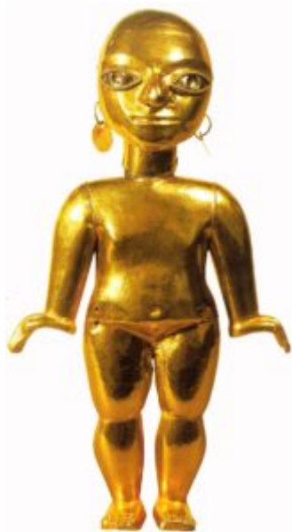
Женская фигурка. 600 до н.э. — 400 н.э. Золото; литье по восковой модели.

На территории Центральной Америки к рубежу н. э. образовались четыре направления в изобразительном искусстве, соответствовавшие сложившимся в то время племенным объединениям: майя, ольмеков, тольтеков и санотсков.