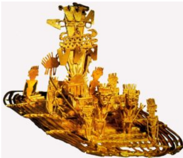
Скульптурная миниатюра с символическим изображением ритуального облачения вождя племени муиска. 700 — 1500 гг. Золото; филигрань. Длина 20,5 см. Музей золота, Богота. Ритуал совершался на озере Гуатавита в Колумбии

Изделия из него золотили, предварительно «проклеивая» соком какого то, неизвестного нам растения, а затем нагревая. Похожую технологию использовали и в Древнем Египте.