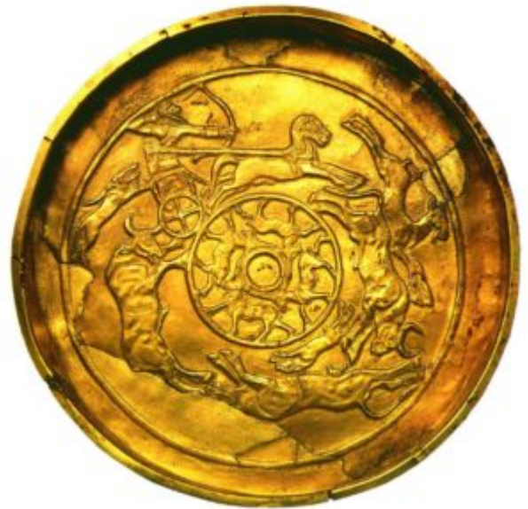
Золотая чаша с охотничьими сценами. 15 — 14 век до н. э. Золото; ковка, чеканка

сохранялся и в наиболее популярном техническом приеме, сочетающем ковку, которой пластический рельеф в целом выполнялся с оборотной стороны, и чеканку, которой детали дорабатывались с лицевой. Эта условность форм, как и их расстановка в ряд на манер торжественного шествия, создающая эффект протяженности всей композиции в пространстве времени, типична для месопотамской культуры. На основании этих формальных признаков многие изделия из сокровищ, найденных Генрихом Шлиманом при раскопках Трои, датируются теперь на тысячу лет раньше и причисляются к памятникам художественной культуры Месопотамии.