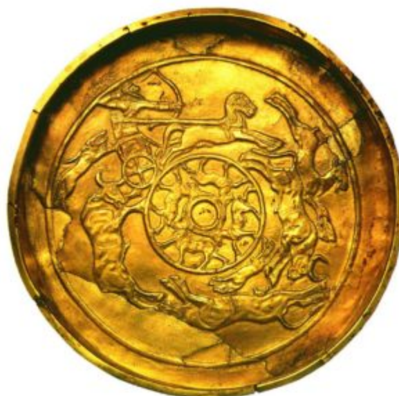
Золотая чаша с охотничьими сценами. 15 – 14 век до н. э. Золото; ковка, чеканка

Изделия финикийских ювелиров, не обладавших самобытным художественным стилем, демонстрируют своеобразное смешение египетских и месопотамских мотивов. Примером может служить пектораль из Библа, точно повторяющая египетский образец – сокол с раскрытыми крыльями. Появление таких произведений не случайно. Взаимовлиянию культур во многом способствовал обычай дипломатических даров, существовавший с незапамятных времен. К тому же страны менее богатые и влиятельные, с завистью взиравшие на прекрасные творения своих могущественных