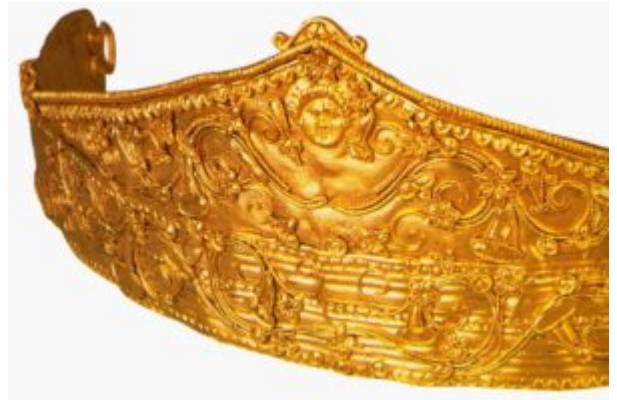
Диадема с рельефным изображением головы Гелиоса

Другим характерным для ювелирного искусства эпохи эллинизма, по сравнению с классикой, было использование колористического эффекта, в чем видно несомненное влияние Востока. В декоре диадемы использованы резные цветные камни, жемчуг, эмаль. Цветовое разнообразие материалов служило развитию как основного натурного мотива.