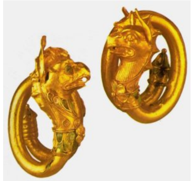
Серьги с грифонами

В середине V века до н. э., после победы греков над персами греческая культура достигла своей золотой эры. Не только всемирно известные шедевры архитектуры, как Парфенон на Афинском Акрополе, но и произведения златокузнецов Классического периода свидетельствуют о том, что в это время были выработаны основополагающие эстетические принципы. Главным из них стала категория Красоты. Идея красоты подразумевала математическую просчитанность пропорций и асимметричную уравновешенность композиции, контраст - принципы, обязательные как для монументального, так и для