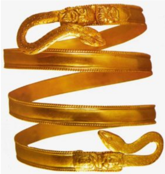
Тройной спиралевидный браслет

Натурализм и открытость композиции свойственны и ожерелью из Малой Азии. Его украшают объемные цветы, зрительно оторванные от фона. Вся композиция менее рациональна и систематична, чем это обычно было принято в классический период.