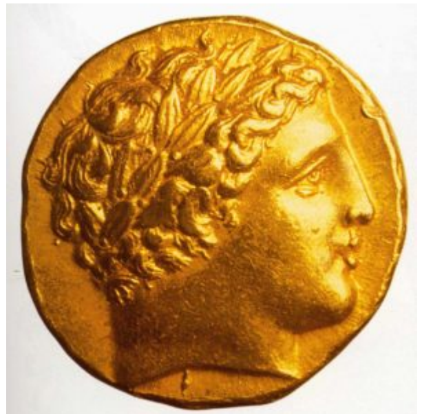
Монета с профилем Филиппа II

первым шагом на пути последующих значительных изменений в Западном искусстве. Александр, в отличие от своих предшественников, не копил сокровища. Захватив персидскую государственную казну (1310 тонн золота и 7598 тонн серебра), часть её он пустил на чеканку монет, другую часть использовал для решения государственных проблем. Остальное он великодушно распределил среди своих солдат, обеспечив тем самым их преданность. Известно, что по случаю своей женитьбы на дочери персидского царя Статерии, он истратил на уплату долгов, сделанных его воинами, 500 000 кг золота.