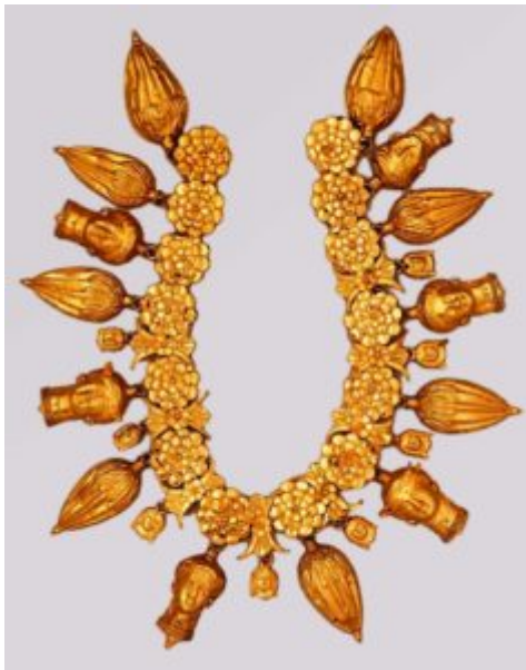
Ожерелье из Таренто

Тарента. Звенья и подвески скомпонованы в центрическую и пластически разнообразную систему, разделенную на два регистра – горизонтальный и вертикальный. На внутреннем ободке элементы в виде розеток и бутонов лотоса располагаются плотной цепочкой, чередуя круглые и удлиненные, особенно популярные в Греции. По сравнению с декором обода, сконцентрированного вокруг шеи, подвески обращены в противоположную сторону, вовне. Противопоставление