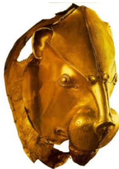
Ритон в форме львиной головы. Листовое золото; ковка; гравировка. Национальный музей, Афины

Серебряный кубок, декорированный чернью и золотым травлением, найденный на Кипре в Энкоми, свидетельствует, о том что и для критских златокузнецов искусство их ближайших соседей представляло несомненный творческий интерес. Как видим, оба культурных центра взаимно влияли друг на друга. Хотя, как известно, более воинственные ахейцы имели в это время несомненное политическое превосходство.