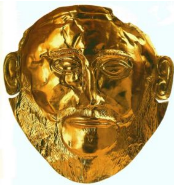
Погребальная маска. 16 век до н. э. Листовое золото; чеканка; гравировка. Национальный музей, Афины. Из гробницы V круга в Микенах.

который предводителя греков во время Троянской войны. И хотя Г. Шлиман ошибся в датировке и маска оказалась на 300 лет старше, чем он предполагал, этот памятник остаётся объектом пристального внимания исследователей. Как и другие микенские золотые погребальные маски, она отличается от знаменитой маски Тутанхамона отсутствием четкой портретной характеристики. Но, в то же время, она воспроизводит этнический тип и мимику персонажа.