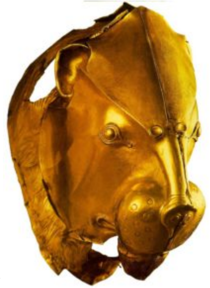
Ритон в форме львиной головы. Листовое золото; ковка; гравировка. Национальный музей, Афины

Серебряный кубок, декорированный чернью и золотым травлением, найденный на Кипре в Энкоми, свидетельствует, о том что и для критских златокузнецов искусство их ближайших соседей представляло несомненный творческий интерес. Как видим, оба культурных центра взаимно влияли друг на друга. Хотя, как известно, более воинственные ахейцы имели в это время несомненное политическое превосходство.