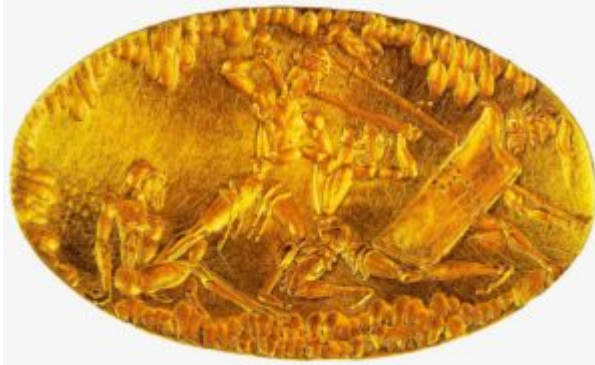
Женский перстень-печатка. 15 век до н. э. Золото; резьба. Национальный музей, Афины

К наиболее ранним из известных украшений относятся изделия из Моклосского клада (2200 г. до н. э.). Это довольно простые вещи: среди них головной обруч с «глазками», выполненными пунктирной чеканкой, шпилька для волос с «головкой» в виде цветка. Такими украшениями критянки, как и жительницы Ура, закалывали волосы.