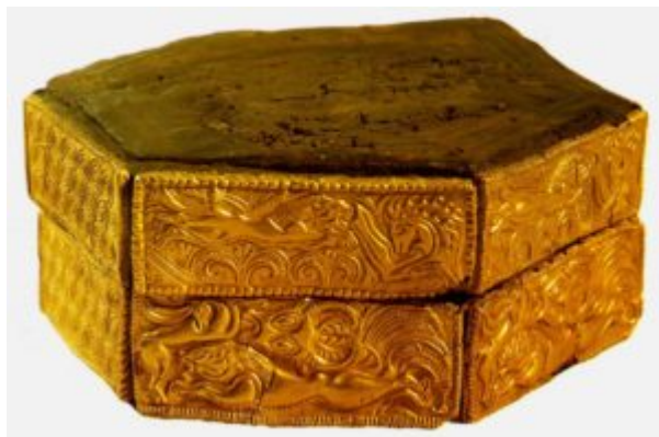
Шкатулка. 16 век до н. э. Дерево, золото. Национальный музей, Афины

Эгейская культура включает в себя искусство Крита, Кикладских островов и Микен, отличающееся исключительным своеобразием. Возможно, в этом одна из причин того, что изделия эгейских ювелиров, впервые в мировой художественной культуре, вошли в моду в Древнем Египте в период Нового Царства (XVI – XI вв. до н. э.). Это было время наивысшего расцвета искусства Микен и Тиринфа, когда минойская и кикладская культуры переживали период медленного угасания.