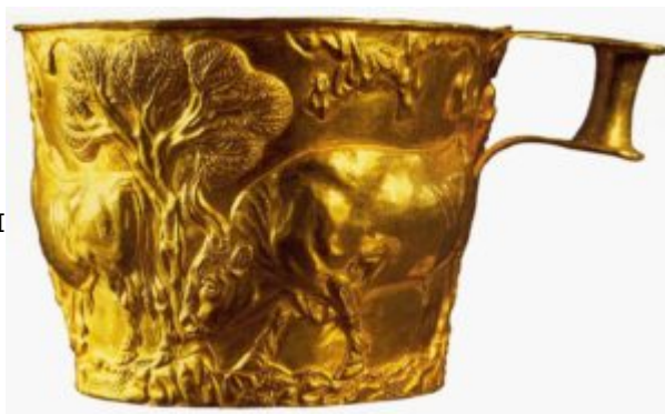
Чаша из Вафио. 15 век до н. э. Золото; чеканка. Высота 8 см. Национальный музей, Афины

они показаны как мирные и ручные, но полные жизненной энергии и напряжения. В отличие от месопотамских композиций, декор минойских чаш более уравновешен и одновременно более выразителен. Он построен по принципу созвучия контрастов. Огромным телам быков противопоставлены стройные фигуры людей, силуэты деревьев и разнонаправленные головы животных; большие поверхности противопоставлены мелким деталям: волнообразные линии земли и деревьев, характерные для критского искусства, подчеркивают впечатление от композиции в целом.