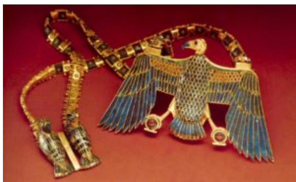
Ожерелье с пекторалью в виде богини Нехбет. Ок. 1334 — 1328 до н. э. Золото, лазурит, сердолик, обсидиан, стекло

породы разрыхлялись разогревом огнем и охлаждением водой. Около 2000 года до н. э. начинают систематически поставлять золото из завоеванной Нубии (около 1,8 миллионов кг необработанного золота, что составляло 750 кг ежегодно).