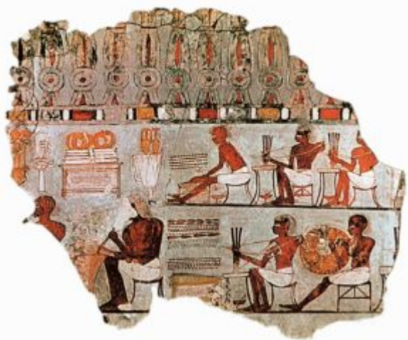
Ювелиры Древнего Египта

Особенно сильное влияние на культуру, быт, ремесла и искусство древних египтян оказала окружающая Природа. Пустыня и Нил, песок и вода – вот основные стихии, извека лежащие в основе их художественной культуры. Пустыня – испытания, несущие смерть, Нил – вечная жизнь. Отсюда контраст как основное художественно-выразительное средство, нашедшее проявление в цвете, рельефе, композиции, рисунке.