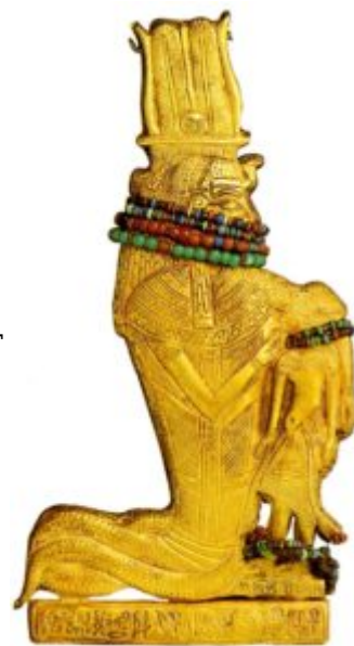
Амулет из гробницы Тутанхамона. Ок. 1334 – 1328 до н. э. Позолоченное дерево, сердолик, полевой шпат

Влияние этого стиля очевидно в статуэтке, изображающей богиню Сенкет, охранявшую гробницу Тутанхамона. Под складками одежд тело прочитывается довольно отчетливо, но его органическая структура не раскрыта. Ещё более красноречива в этом отношении сцена, изображённая на спинке трона из той же гробницы. Вместо былой неподвижности, иерархичности и фронтальности возникает нежность и даже чувственностью отношений между фараоном и его супругой Анхесетамон.