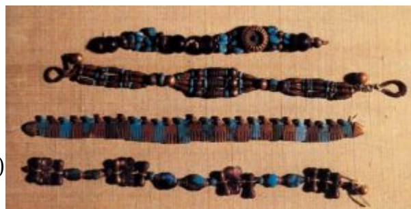
Браслеты из гробницы царя Джера. Начало 3 тыс. до н. э. (1 династия). Золото, полудрагоценные камни, фаянс

царицы Джер с бирюзой, лазуритом и аметистами. Эти изделия, выполненные из золота в технике чеканки и филигрании, и туалетная коробочка в форме раковины с крышкой, укрепленной на шарнире (принадлежала фараону Сехемхету, III династия) – свидетельствуют, что уже в этот период египетские ювелиры умели отливать, чеканить и паять золото.