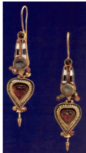
Серьги с египетскими коронами. 3-2 в. до н. э. Золото, полудрагоценные камни, стекло

Экзотический и мистический характер этой древнейшей художественной культуры, необычность и совершенство ее ювелирных украшений имеет непреодолимую привлекательность для европейцев.