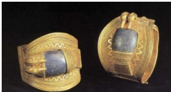
Браслеты Рамсеса II. Ок. 1290 до н. э. Золото, лазурит

периодов уступают место своеобразному «романтизму». Обилие и чувственная пышность декора достигают грани чрезмерности. Характерным примером служит диадема наложницы Тутмоса III (XVIII династия). Это золотой обруч, украшенный цветочками и головками газелей. На лоб красавицы спускались шесть подвесок с иероглифом «нефер» – красота. Их количество указывает на исключительную привлекательность женщины. При движении подвески чувственно трепетали, привлекая внимание к обладательнице украшения.