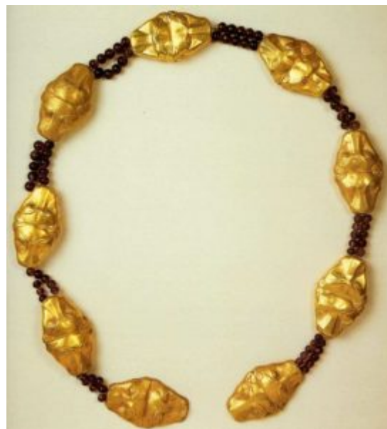
Пояс царицы Меререт. Ок. 1840 до н. э. Золото, аметист

Украшения, принадлежавшие частным лицам не так роскошны, но также отличаются ювелирной работой превосходного качества.