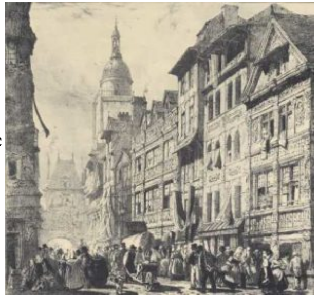
Боннингтон. Улица Больших часов в Руане

романтиз ма в тех странах Европы, где пробужда лось национал ьное самосозна ние, составлял и интерес к местному культурно му и художеств енному наследию, темы народного быта, национал ьной истории и освободит ельной борьбы