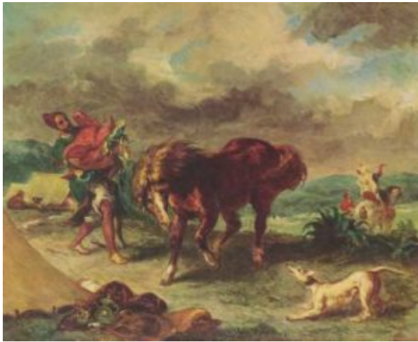
Делакруа. Марроканец и его конь

Жерико. Пейзаж с печью для обжига извести