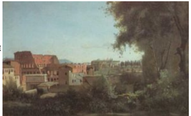
Коро. Рим, Колизей и сады Фарнезе

раннее творчество представителей реализма и импрессионизма – Камиля Коро, мастеров барбизонской школы, Гюстава Курбе, Жана Франсуа Милле, Эдуарда Мане. Мистицизм и сложный аллегориз