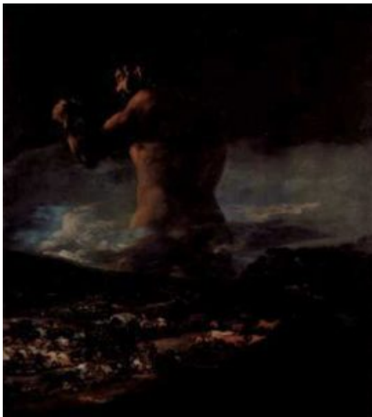
Гойя. Колосс (Паника)

революционные годы героически-взволнованным портретам Жака-Луи Давида, ранним напряженно-драматическим композициям и портретам А.-Ж. Гро , пронизанным мечтательным, несколько экзальтированным лиризмом работам П. П. Прудона, а также противоречиво сочетающим романтические тенденции с академическими приемами произведений Ф. Жерара. В творчестве основателя романтической школы Т. Жерико впервые во французском искусстве выражены протест против окружающей действительности и желание откликнуться на исключительные события современности, которые в его произведениях воплощают