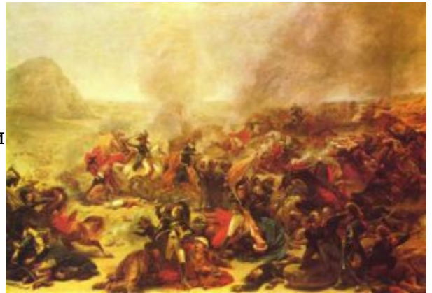
Гро. Битва при Назарете

смену рационализму приходит идеализм. Эпоха Просвещения была оптимистична, жизнерадостность была свойственна и классицизму, романтизм же пессимистичен. Романтики смотрели на прошлое с печалью, но и будущее им виделось не менее трагическим. Основным становилось чувство, а не разум. Своего рода самозащитой от нарастающего нивелирования личности стал присущий романтизму глубочайший интерес к человеку, его миру, понимаемые романтиками как единство индивидуальной внешней характеристики и неповторимого внутреннего содержания. Проникая в глубины духовной жизни человека, литература и