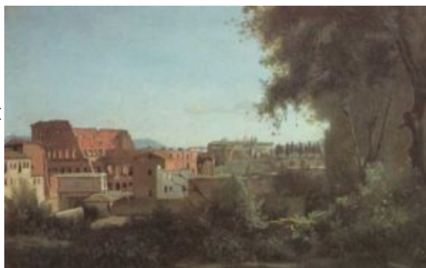
Коро. Рим, Колизей и сады Фарнезе

раннее творчество представителей реализма и импрессионизма – Камиля Коро, мастеров барбизонской школы, Гюстава Курбе, Жана Франсуа Милле, Эдуарда Мане. Мистицизм и сложный аллегориз