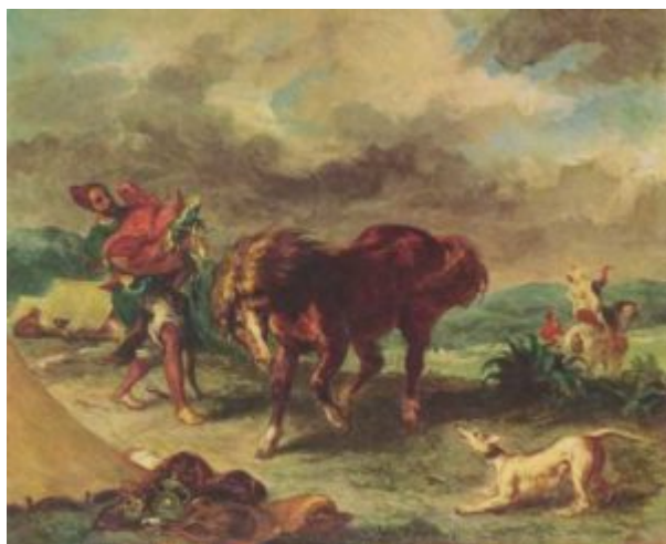
Делакруа. Марроканец и его конь

Жерико. Пейзаж с печью для обжига извести