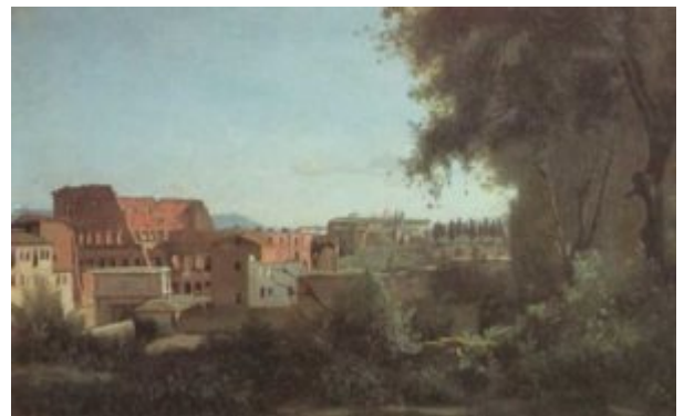
Коро. Рим, Колизей и сады Фарнезе

раннее творчество представителей реализма и импрессионизма – Камиля Коро , мастеров барбизонской школы, Гюстава Курбе, Жана Франсуа Милле, Эдуарда Мане. Мистицизм и сложный аллегоризм, подчас присущие романтизму, нашли отражение в символизме (Гюстав Моро и др.); некоторые характерные черты эстетики романтизма вновь проявились в искусстве модерна и постимпрессионизма.