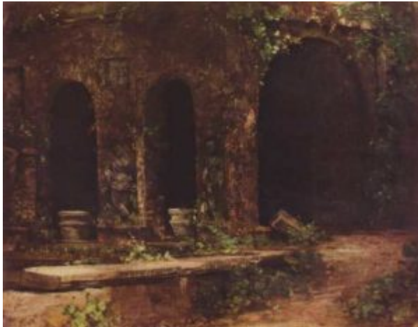
Блехен. Грот в парке виллы д'Эсте близ Рима

также К. Блехена . Романтическая эстетика во многом определила становление творчества Адольфа фон Менцеля, в дальнейшем крупнейшего представителя немецкого реализма. Так же, как и во Франции, поздний немецкий романтизм (в большей мере, чем