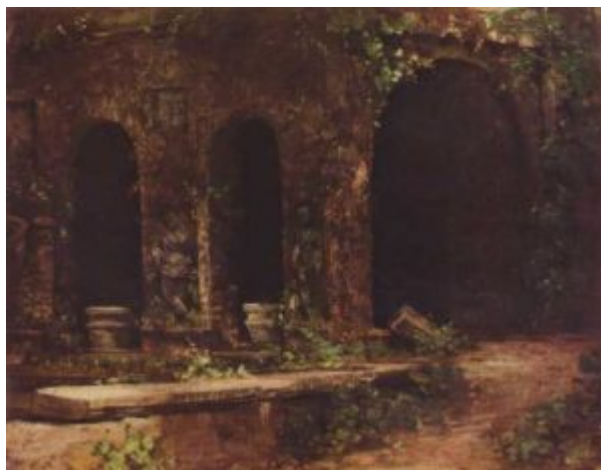
Блехен. Грот в парке виллы д' Эсте близ Рима

также К. Блехена . Романтическая эстетика во многом определила становление творчества Адольфа фон Менцеля, в дальнейшем крупнейшего представителя немецкого реализма. Так же, как и во Франции, поздний немецкий романтизм (в большей мере, чем