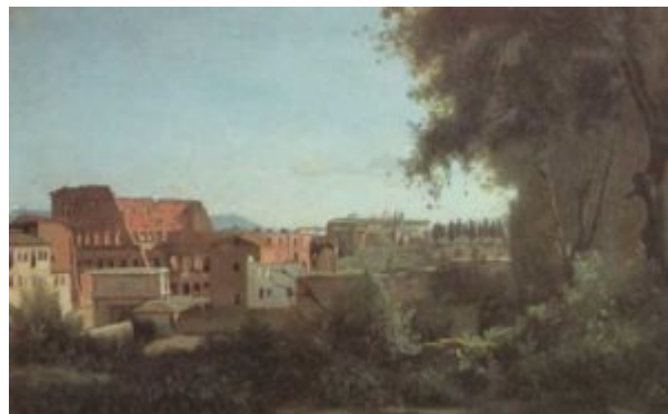
Коро. Рим, Колизей и сады Фарнезе

раннее творчество представителей реализма и импрессионизма – Камиля Коро , мастеров барбизонской школы, Гюстава Курбе, Жана Франсуа Милле, Эдуарда Мане. Мистицизм и сложный аллегоризм, подчас присущие романтизму, нашли отражение в символизме (Гюстав Моро и др.); некоторые характерные черты эстетики романтизма вновь проявились в искусстве модерна и постимпрессионизма.