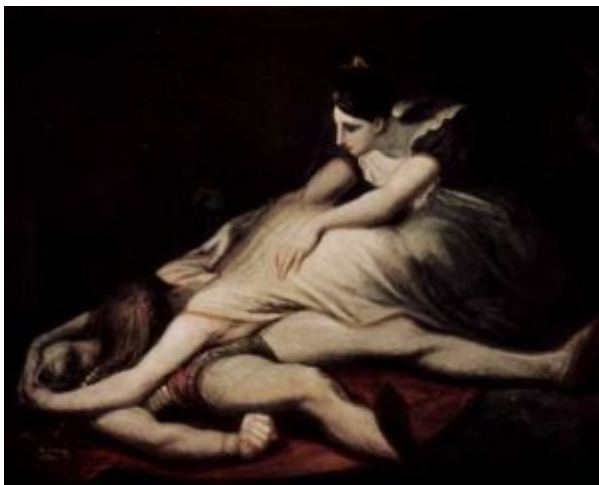
Фюссли. Кримхильда обнимает мёртвого Зигфрида

искусство романтизма переносили это острое ощущение характерного, самобытного, неповторимого на судьбы наций и народов, на саму историческую действительность. Не удивительно, что в эту эпоху появился жанр исторического романа, а в живописи – картины на исторические сюжеты; по всей Европе начинают собирать и изучать народные песни, сказки, легенды (К. Брентано, братья Гримм, братья Киреевские, А. Пушкин, А. Мицкевич и другие).