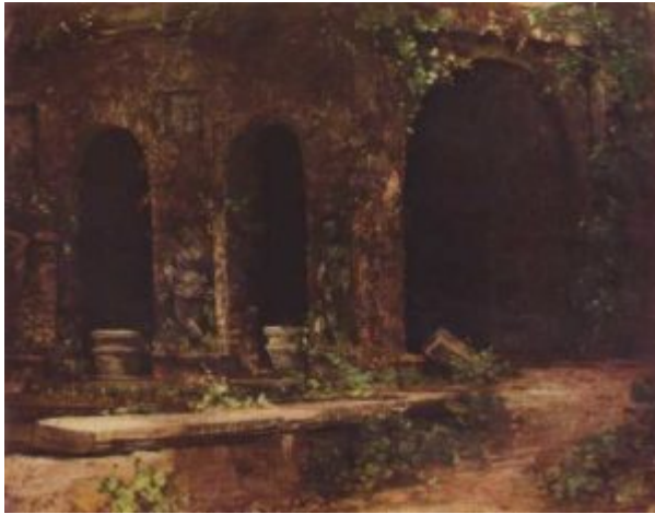
Блехен. Грот в парке виллы д' Эсте близ Рима

также К. Блехена . Романтическая эстетика во многом определила становление творчества Адольфа фон Менцеля, в дальнейшем крупнейшего представителя немецкого реализма. Так же, как и во Франции, поздний немецкий романтизм (в большей мере, чем