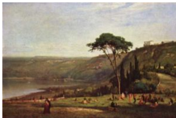
Иннес. Альбанское озеро

Романтизм как культурное выражение социального протеста господствовал около полувека. Однако его идеализация сильной личности обернулась новой бедой: революция, начатая людьми, исповедовавшими романтические идеалы, привела к поражению этих идеалов. И романтизм постепенно сменял реализм.