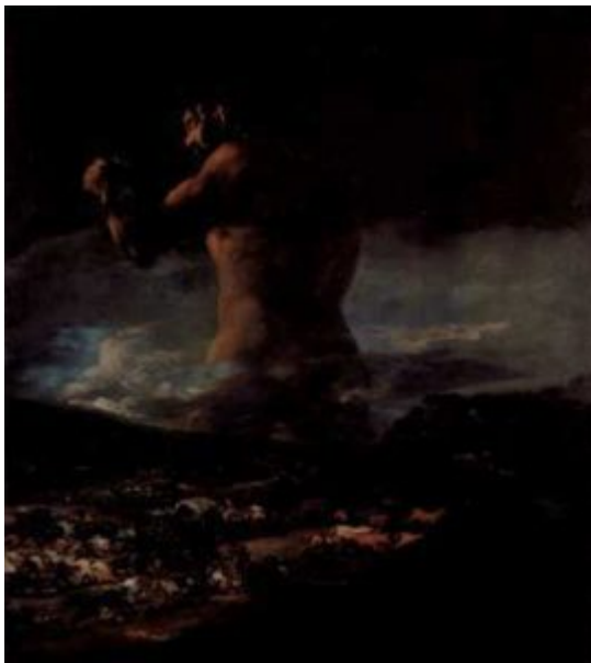
Гойя. Колосс (Паника)

революционные годы героически-взволнованным портретам Жака-Луи Давида, ранним напряженно-драматическим композициям и портретам А.-Ж. Гро , пронизанным мечтательным, несколько экзальтированным лиризмом работам П. П. Прудона, а также противоречиво сочетающим романтические тенденции с академическими приемами произведений Ф. Жерара. В творчестве основателя романтической школы Т. Жерико впервые во французском искусстве выражены протест против окружающей действительности и желание откликнуться на исключительные события современности, которые в его произведениях воплощают