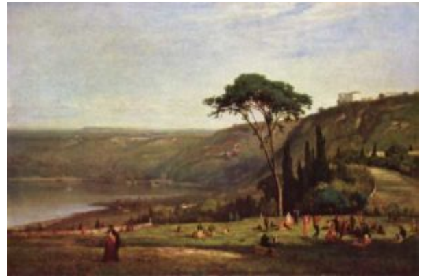
Иннес. Альбанское озеро

Романтизм как культурное выражение социального протеста господствовал около полувека. Однако его идеализация сильной личности обернулась новой бедой: революция, начатая людьми, исповедовавшими романтические идеалы, привела к поражению этих идеалов. И романтизм постепенно сменял реализм.