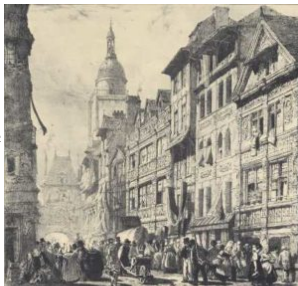
Боннингтон. Улица Больших часов в Руане

романтиз ма в тех странах Европы, где пробужда лось национал ьное самосозна ние, составлял и интерес к местному культурно му и художеств енному наследию, темы народного быта, национал ьной истории и освободит ельной борьбы