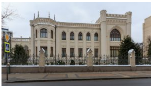
Особняк З. Г. Морозовой (1893—1897)

Архитектура оказалась наиболее богатой творческой мастерской для стиля модерн и определила его типологические черты. Поэтому эволюцию стиля модерн легче всего проследить по тенденциям, господствовавшим в архитектуре.