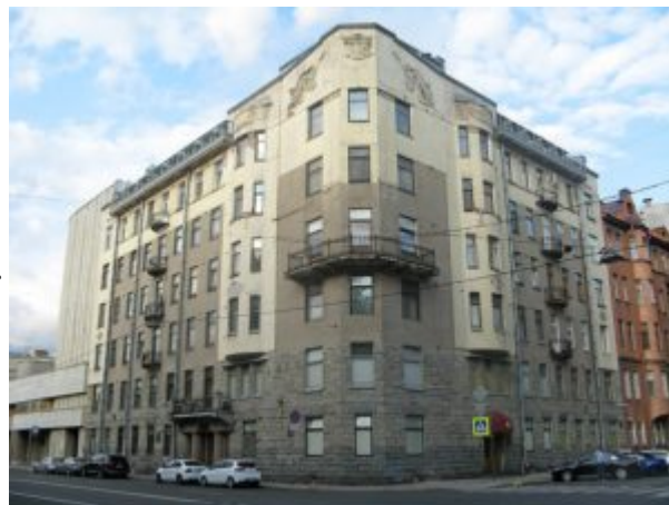
Доходный дом на Таврической улице

Историзм модерна выражается не в буквалистском подходе к историческим стилям, как это свойственно эклектике, а в стремлении воплотить «дух» стиля. Место стилизаторства при таком подходе занимает стилизация, место подражания – гротеск. Дух архитектуры прошлого станет понятным современности именно тогда, когда изменится ее буква, когда сам язык ее станет современным, но так, чтобы все той же осталась сущность. Стилизация, с одной стороны, использует некоторые исторические формы, моменты, мотивы, чтобы символически намекнуть на прошлое, с другой