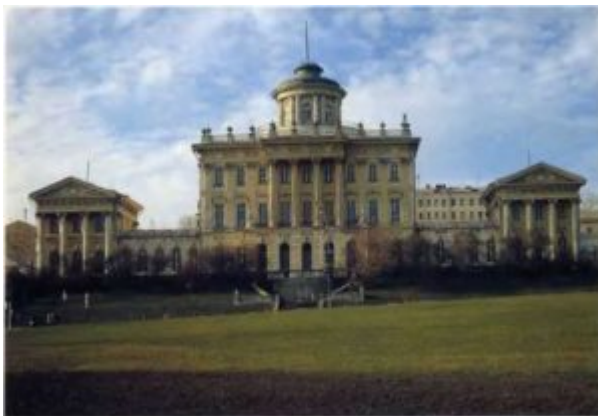
В. И. Баженов. Дом П. Е. Пашкова в Москве. 1784—1786

Последующее развитие показало, что псевдоготике так и не суждено было вылиться в полноценное стилевое явление.