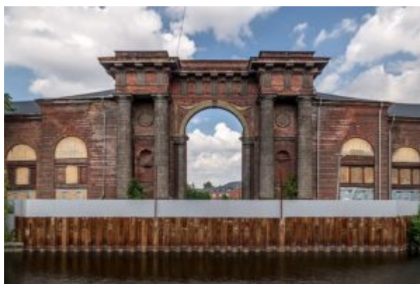
Арка Новой Голландии

Важнейшей государственной задачей 60-80-х годов было оформление набережных основной водной артерии Петербурга - Невы. В связи с этим со стороны Невы была возведена ставшая потом столь знаменитой ограда Летнего сада (1771-1786), автором которой считаются Ю.М. Фельтен (1730-1801) и его помощник П. Егоров. В ней сохранено то же сочетание черного металла и золоченых деталей, как и в типично барочной ограде Большого Царскосельского дворца. Но вместо подвижного, изменчивого, свободного и прихотливого узора в решетке Летнего сада господствует вертикаль: вертикально стоящие пики пересекают прямоугольные рамы, равномерно распределенные массивные пилоны поддерживают эти рамы, подчеркивая своим ритмом общее ощущение величавости и покоя. Фельтену принадлежит также здание Старого Эрмитажа (1771-1787) и галерея-переход над Зимней канавкой (1783-1784).