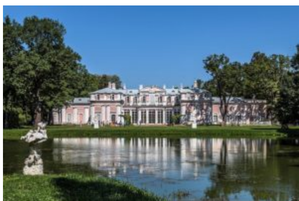
Китайский дворец. Южный фасад

Данью упоминавшемуся увлечению «китайщиной» является Китайский дворец в Ораниенбауме (г. Ломоносов) под Петербургом, построенный Антонио Ринальди (ок. 1710-1794; в России - с 50-х годов). Китайский дворец (1762-1768) - изысканное здание, интерьер которого отделан в формах, близких к рококо, и украшен в «китайском» духе, - «чудо XVIII века», как его называли «мирискусники», с замечательными росписями бр. Бароцци и Торелли Ст., с присланным Тьеполо плафоном. В рокайльном духе были исполнены и парковые увеселения в Ораниенбауме, вроде Катальной горки (1762-1774). В ансамбле рокайльных интерьеров огромную роль играет сочетание разных материалов, разнообразие фактур: живописные