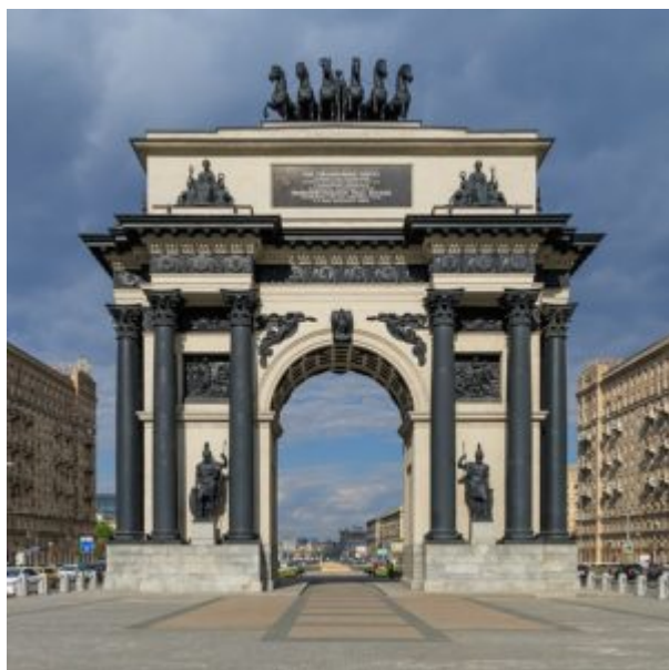
Московские Триумфальные ворота

Ведущая роль в градостроительных мероприятиях, особенно в центральном районе Москвы, принадлежала О. И. Бове. По его проекту в 1814 году реконструируется Красная площадь. Старое здание торговых рядов напротив Кремлевской стены получает новый архитектурный облик — сквозная аркада перетягивается дорическим антаблементом на двоянных колоннах, углы и центр композиции оформляются павильонами с портиками.