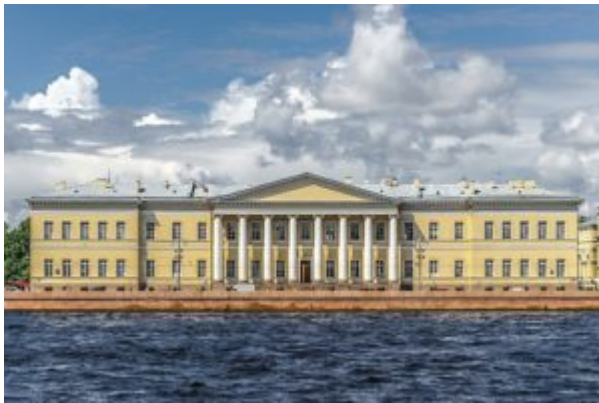
Петербургская академия наук

Говоря о палладианстве Кваренги или Н. А. Львова, не следует понимать их творчество как результат копирования. Скорее, как писал сам Львов, речь шла о создании собственного стиля, отличного от английского или французского вариантов творческой интерпретации заветов Палладио. Из всех разновидностей палладианских композиций для Кваренги наиболее характерно использование упомянутой трехчастной схемы жилого или административного здания, состоящего из главного корпуса и двух симметричных флигелей, соединенных с ним прямыми или скругленными пониженными галереями.