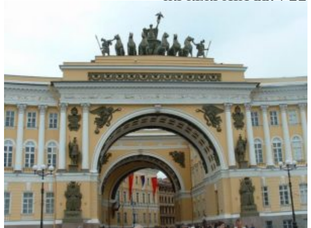
Арка Главного штаба

Петербургу, выдвинуло перед Росси еще более сложный комплекс градостроительных проблем. Колоссальная дуга здания с прямыми, параллельными Зимнему дворцу крыльями окаймляет Дворцовую площадь, придавая ей правильные очертания и скрывая за собой большой массив городской застройки между рекой Мойкой и Невским проспектом. Так как улица выходила под косым углом к оси, соединяющей арку с центром Зимнего дворца, Росси, перекрыв выход с улицы на площадь второй аркой, осуществил этот поворот на стыке осей внутри, под сводами получившегося таким образом арочного коридора, так, что этот излом оси не виден ни со стороны площади, ни со стороны улицы. Благодаря этой остроумной находке зодчего возникает один из самых феерических эффектов созданного Росси «архитектурного театра»: для зрителя, входящего под арку со стороны улицы, вид на Дворцовую площадь, Зимний дворец и Александровскую колонну (установлена в 1834 году) открывается в точке поворота арки внезапно, вдруг, как ошеломляющая своей неожиданностью и грандиозностью архитектурная картина в затененной арочной раме. Кульминацией всей архитектурной композиции является триумфальная арка, задуманная как памятник героической славы народа, победившего в войне 1812 года. Этим обусловлена тематика скульптурного убранства арки— фигуры воинов между колоннами пилонов, военная арматура, колесница победы на высоком ступенчатом аттике, словно парящая в просторе неба.