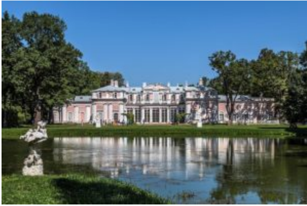
Китайский дворец. Южный фасад

Данью упоминавшемуся увлечению «китайщиной» является Китайский дворец в Ораниенбауме (г. Ломоносов) под Петербургом, построенный Антонио Ринальди (ок. 1710-1794; в России - с 50-х годов). Китайский дворец (1762-1768) - изысканное здание, интерьер которого отделан в формах, близких к рококо, и украшен в «китайском» духе, - «чудо XVIII века», как его называли «мирискусники», с замечательными росписями бр. Бароцци и Торелли Ст., с присланным Тьеполо плафоном. В рокайльном духе были исполнены и парковые увеселения в Ораниенбауме, вроде Катальной горки (1762-1774). В ансамбле рокайльных интерьеров огромную роль играет сочетание разных материалов, разнообразие фактур: живописные панно, лак, фарфор, стеклярус, вышивка, позолота, мрамор. Все это мы видим в Китайском дворце и Фарфоровом кабинете Катальной горки.