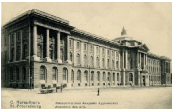
Императорская Академия художеств

Уходящее рококо оказало определенное воздействие на формирующийся сентиментализм, который, в свою очередь, повлиял на романтизм XIX в. Но было бы глубоко ошибочным рассматривать историю искусства как простую смену одного стиля другим. В действительности этот процесс многообразен, а в русском XVIII в. он особенно сложен.