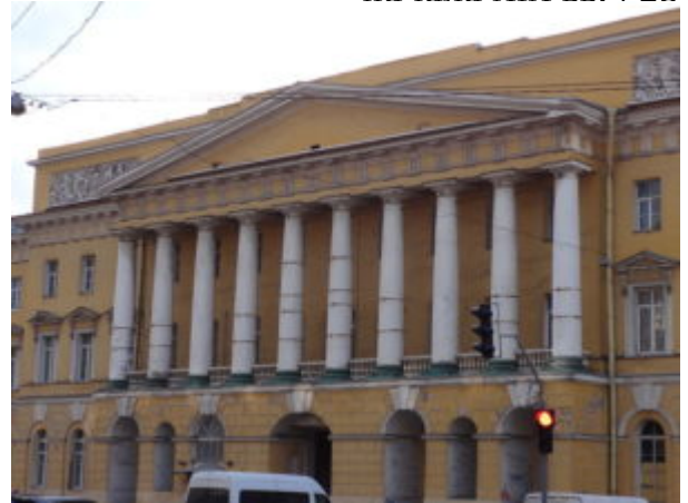
Главный фасад казарм Павловского полка на Марсовом поле

Главный фасад казарм Павловского полка на Марсовом поле (1817—1821) напоминает композицию крыльев Адмиралтейства с шестиколонными дорическими портиками по бокам и двенадцатиколонным в центре. Однако компоновка архитектурных масс лишена захаровской энергичности — портики воспринимаются не столько органическими выпуклостями стеного массива, сколько извне наложенными на плоскость стены. Грузный, сложной формы раскрепованный аттик центрального портика дает неожиданно причудливую ритмическую фразировку монотонным членениям фасада.