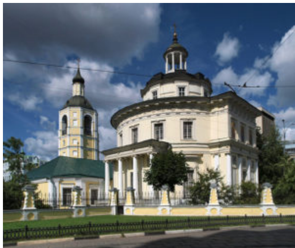
Церковь Филиппа Митрополита

Уже в первых крупных сооружениях Казаков уверенно работает в формах раннего классицизма, давая ему свое толкование. Геометрическая выраженность треугольного плана и компактность объема характерны для здания Сената, построенного в Московском Кремле (1776—1787). Огромный купол, перекрывающий его главный зал, играет важную роль в ансамбле Красной площади. К тому же периоду относится церковь Филиппа Митрополита (1777—1788). В композиционном отношении храм представляет собой цилиндрический объем, увенчанный низким ступенчатым куполом и круглой, украшенной колоннами «беседкой-фонариком». Церковь эта — одна из первых ротонд, построенных Казаковым. Этот традиционный тип круглого в плане здания получает в эпоху классицизма свое самостоятельное выражение. Заложенные в нем идеи гармонии и совершенства ярко воплощают идеалы стиля. Замечателен интерьер церкви. Белый с золочеными деталями, пронизанный светом, льющимся из многочисленных окон, он оставляет ощущение ясности и покоя.