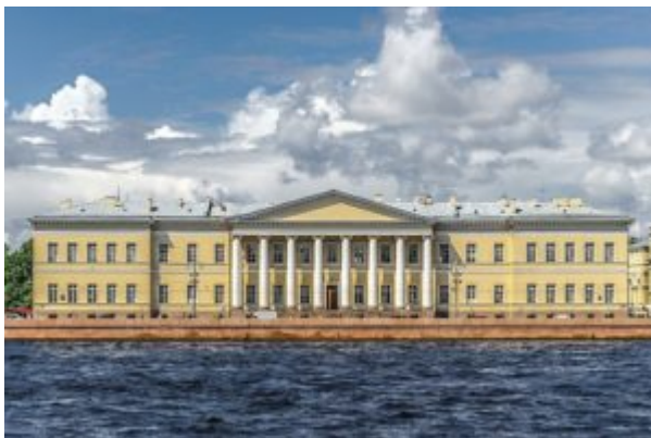
Петербургская академия наук

Говоря о палладианстве Кваренги или Н. А. Львова, не следует понимать их творчество как результат копирования. Скорее, как писал сам Львов, речь шла о создании собственного стиля, отличного от английского или французского вариантов творческой интерпретации заветов Палладио. Из всех разновидностей палладианских композиций для Кваренги наиболее характерно использование упомянутой трехчастной схемы жилого или административного здания, состоящего из главного корпуса и двух симметричных флигелей, соединенных с ним прямыми или скругленными пониженными галереями.