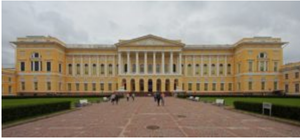
Государственный Русский музей

Градостроительный пафос русского ампира достигает своей кульминации в творчестве К. И. Росси. Первой крупной работой Росси в Петербурге становится строительство великокняжеского Михайловского дворца (1819—1825, ныне здание Государственного Русского музея ). Проектирование дворца, располагавшегося на участке между Невским проспектом и Марсовым полем, понято Росси как задача градостроительного масштаба. По оси главного фасада дворца была пробита улица, выходящая на Невский проспект, с тем чтобы здание просматривалось с парадной магистрали города. Параллельно дворцу проложена улица, соединяющая Фонтанку и канал Грибоедова. Здания, расположенные по периметру образовавшихся улиц и площади, более скромные по архитектурному облику, должны были выполнять роль рамы или кулис для пышно украшенного здания дворца.