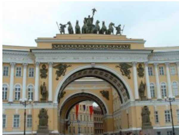
Арка Главного штаба

Петербурга, выдвинуло перед Росси еще более сложный комплекс градостроительных проблем. Колоссальная дуга здания с прямыми, параллельными Зимнему дворцу крыльями окаймляет Дворцовую площадь, придавая ей правильные очертания и скрывая за собой большой массив городской застройки между рекой Мойкой и Невским проспектом. Так как улица выходила под косым углом к оси, соединяющей арку с центром Зимнего дворца, Росси, перекрыв выход с улицы на площадь второй аркой, осуществил этот поворот на стыке осей внутри, под сводами получившегося таким образом арочного коридора, так, что этот излом оси не виден ни со стороны площади, ни со стороны улицы. Благодаря этой остроумной находке зодчего возникает один из самых феерических эффектов созданного Росси «архитектурного театра»: для зрителя, входящего под арку со стороны улицы, вид на Дворцовую площадь, Зимний дворец и Александровскую колонну (установлена в 1834 году) открывается в точке поворота арки внезапно, вдруг, как ошеломляющая своей неожиданностью и грандиозностью архитектурная картина в затененной арочной раме. Кульминацией всей архитектурной композиции является триумфальная арка, задуманная как памятник героической славы народа, победившего в войне 1812 года. Этим обусловлена тематика скульптурного убранства арки— фигуры воинов между колоннами пилонов, военная арматура, колесница победы на высоком ступенчатом аттике, словно парящая в просторе неба.