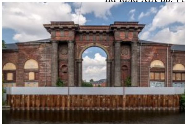
Арка Новой Голландии

Важнейшей государственной задачей 60-80-х годов было оформление набережных основной водной артерии Петербурга – Невы. В связи с этим со стороны Невы была возведена ставшая потом столь знаменитой ограда Летнего сада (1771-1786), автором которой считаются Ю.М. Фельтен (1730-1801) и его помощник П. Егоров. В ней сохранено то же сочетание черного металла и золоченых деталей, как и в типично барочной ограде Большого Царскосельского дворца. Но вместо подвижного, изменчивого, свободного и прихотливого узора в решетке Летнего сада господствует вертикаль: вертикально стоящие пики пересекают прямоугольные рамы, равномерно распределенные массивные пилоны поддерживают эти рамы, подчеркивая своим ритмом общее ощущение величавости и покоя. Фельтену принадлежит также здание Старого Эрмитажа (1771-1787) и галерея-переход над Зимней канавкой (1783-1784).