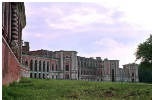
Большой Царицынский дворец