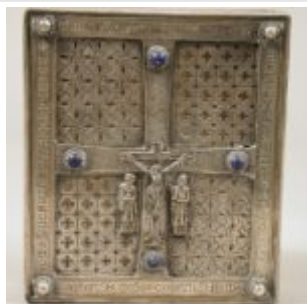
Кумдах Книги Диммы