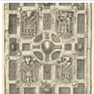
Кумдах Евангелия Молиза