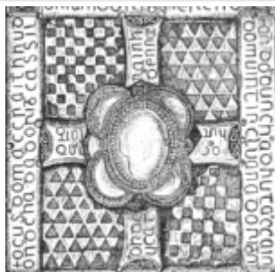
Изображение лицевой стороны кумдах Миссала из Стоу

Самым известным является кумдах Катаха Св. Колумбы, который датируется сразу после смерти Колумбы или Колум-Килла в 597 году, но все еще является, вероятно, самой ранней ирландской книгой, сохранившейся и очень престижной реликвией. Он принадлежал династии О'Доннеллов и был взят ими в качестве боевого оберега (Катах означает «Боец»). Первоначальная работа над ним была сделана между 1072 и 1098 годами в Келлсе, а в 14 веке была добавлена новая лицевая панель с большим сидящим Христом во Славе в окружении сцен Распятия и святых в позолоте.