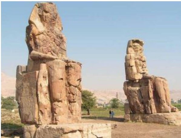
«Колоссы Мемнона» (Статуи Аменхотеп III)

В фиванской скульптуре Нового царства прослеживаются два направления, представленные памятниками официального и частного искусства, причем обе линии взаимосвязаны. В пластике официального направления начала 18 династии развивались традиции искусства Среднего царства (то есть установка на портретность и доминирование человеческого начала). Новые черты появляются только со времени царицы Хатшепсут. Статуи Хатшепсут исполнены в виде тронной и коленопреклоненной фигуры, в образе сфинкса или осирических колоссов. Сравнивая их, можно обнаружить ряд общих приемов передачи портретного облика – сужающийся к подбородку овал лица, маленький рот, миндалевидный разрез глаз. Иконография, сложившаяся в скульптуре времени Хатшепсут, получила дальнейшее развитие и в памятниках последующей эпохи, включая годы царствования Тутмоса III. Несмотря на видимое желание уничтожить все, что напоминало бы о его предшественнице, стилистическая линия скульптуры следовала традициям, заложенным в годы ее правления.