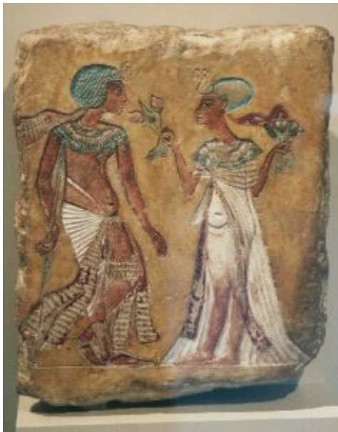
Сменхкара и Меритатон («Прогулка в саду»)

К концу царствования Эхнатона относится рельеф, изображающий Сменкхара, мужа старшей дочери фараона Меритатон, вместе с супругой. Здесь также очевидны характерные особенности стиля амарнского искусства: свободная постановка фигур, переданных в непосредственном общении друг с другом, живая непринужденность поз.