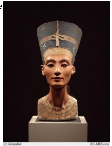
Нефертити в голубой тиаре

характеристик намечается и обратный процесс – тяготение к лирической трактовке образов. Это направление свойственно целой школе мастеров, условно называемой «мастерской скульптора Тутмоса». Скульптурные мастерские обнаружены при раскопках на территории Ахетатона. Лучшее представление о художественном стиле мастерской скульптора Тутмоса создает портрет Нефертити в голубой тиаре.