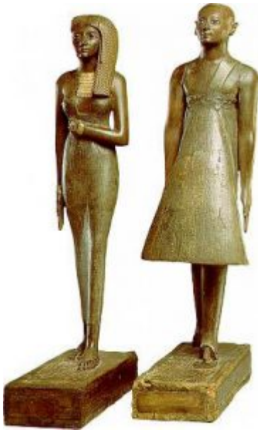
Статуэтки жреца Аменхотепа и жрицы Раннаи

Эти статуэтки исполнены поистине виртуозно, фактура дерева поразительно пластична. Темно-каштановый цвет эбенового дерева усиливается инкрустацией золотыми пластинами ожерелья и браслетов. Высокая посадка головы соответствует стройным формам фигуры. Обе парные статуэтки представлены в канонизированной позе идущей фигуры. Лица тонко моделированы, в обоих случаях ярко выражена портретность.