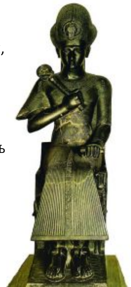
Тронная статуя Рамзеса II из Туринского музея

В то же время в скульптуре Рамессидов постепенно нарастает идеализация образов, выродившаяся затем в несколько холодную академическую манеру изысканности, виртуозной самодовлеющей техники.