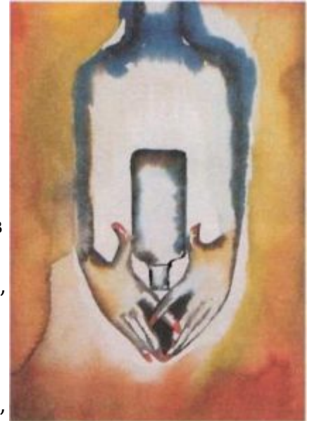
Франческо Клементе. Реклама водки «Абсолют». 1999

для компании «Бенеттон» начала 1990-х, в которых бенеттоновские вещи рекламируются на умирающих от СПИДа или приговоренных к смертной казни, наконец, знаменитую рекламную кампанию водки «Абсолют», начатую в 1985 году при помощи Уорхола (его гонорар составил 65 000 долларов), которая в результате привела к созданию одной из самых ярких коллекций современного искусства. Во всех этих случаях «формой» становятся, как в концептуальном слогане Зеемана, не потребительские качества товара, а способы его понимания и представления, то есть отношения, подходы, которые меняют взгляды на мир и на искусство как его часть. И Кунс своими пылесосами в музее или эротическими билбордами доказывает гетерогенность и взаимообратимость процессов, происходящих в современной культуре. В отличие от «вертикального» возвышенного универсализма, который модернисты, включая и ранних поп-артистов, стремившихся поднять статус вещи или рекламы, унаследовали от романтиков, постмодернистский универсализм горизонтален. Его можно было бы назвать низовым, учитывая особенность стелиться «у земли», нежелание воспарять в ликующие небеса, привычку быть не выше билбордов.