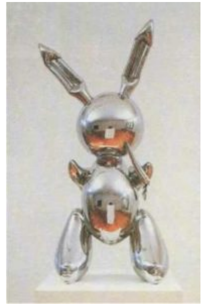
Джефф Кунс. Кролик. 1986