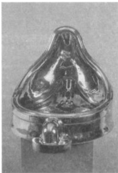
Шерри Ливайн. Фонтан. По Марселю Дюшану. 1991