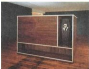
Хаим Стейнбах. Без названия (кушетка, гроб). 1989

Хаим Стейнбах, другой известный американский апроприатор, наоборот, предпочитает отслеживать тонкие отличия социокультурных репрезентаций. Он не трансформирует вещи в скульптуру, а формирует вещевые подборки, погружаясь в поиски значений, возникающих при «случайных встречах» предметов. Неожиданные соположения вещей, спровоцированные художником, открывают в них самих двойные или скрытые смыслы. Стейнбах образует зону смыслового резонанса, где за предметами открывается исторический выбор судьбы человека, социальной группы, часто целого народа. Слово «зона» здесь особенно подходит, потому что пространства, образованные Стейнбахом, — будь то пространства на демонстрационных полочках, как в магазине, или пространства экспозиционных залов, загроможденных стеллажами, — всегда стеснены и несвободны, «зонированы». Акт выбора по Стейнбаху — это не акт свободной воли, каковым он представлялся ранее, но необходимость занять «свою полку». Поэтому звучание и многозначность предмета