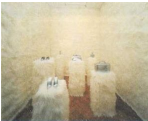
Сильви Флэри. Cuddly Wall. 1998

Стратегия Кунса вызывала неоднозначную критику: одни считали, что он деконструирует рекламный образ общества спектакля, но большинство воспринимало пылесосы Шелдона, вечно парящий в солевом растворе внутри витрины баскетбольный мяч, полуфигуру обнаженной блондинки, обнимающей игрушечную