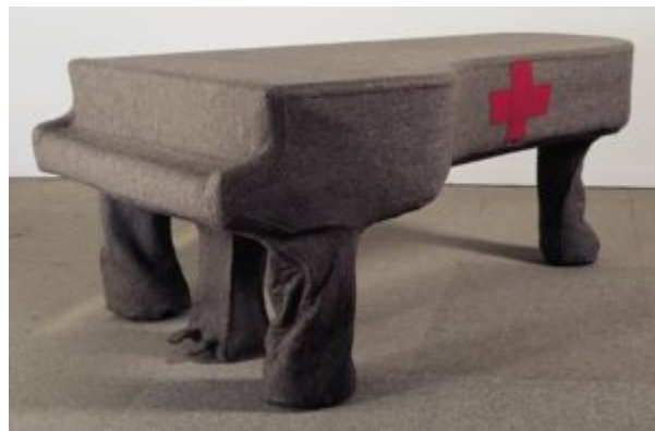
«Гомогенная инфильтрация для рояля». 1966

культов, сближая искусство и сектантство, художника и жреца. Первым жрецом актуального искусства 1960-1970-х годов становится Йозеф Бойс, радикально противопоставляющий свое творчество всей материалистической реальности 1960-х. Понять Бойса как художника современности 1960-х годов невозможно, если не видеть в искусстве протест против уже охватившего мир состояния вещей, против позитивистской прагматики. Бойс — создатель двух стилей позднего XX века, милитари и экологического, объединенных парадоксально его волей, — своими перформансами обращает внимание на то, что тщательно вытесняется современным обиходом: жизнь — это жертва. Бойс медленно переводит акценты в этой теме, уходя от конкретной немецкой истории к общехристианским символам. Свою первую акцию под флагом флюксуса Бойс устраивает 20 июля 1964 года, в годовщину покушения Штауфенберга, которому не удалось убить Гитлера и сам он был замучен гестапо. Бойс выступает в техническом университете Ахена. Он растапливает два куба жира под запись речи Геббельса, призывающего массы к тотальной войне, затем поднимает распятие и осеняет его нацистским приветствием.