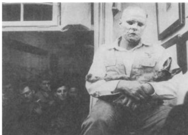
Йозеф Бойс. Как объяснить картины мертвому зайцу Галерея Шмела, Дюссельдорф. 1965

Позднее Бойс выбирает более приемлемый для всех немцев и нейтральный символ — зайца. В перформансе 1965 года он объясняет мертвому животному незримые картины. Сам маэстро, обмазав лицо медом, рассказывал в течение часа по одной из галерей Дюссельдорфа, держа в руках тушку то ли зайца, то ли кролика, купленного в ближайшей мясной лавке. В отличие от св. Франциска, который проповедовал птицам, Бойс берется проповедовать чучелу, доводя до абсурда и без того странную, с точки зрения обычного понимания, ситуацию. Он пользуется традиционным культовым способом создания атмосферы предстояния чуду, скрыв свое лицо под золотой маской. Маска наложена на слой