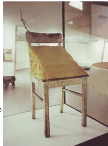
Стул с жиром. 1964