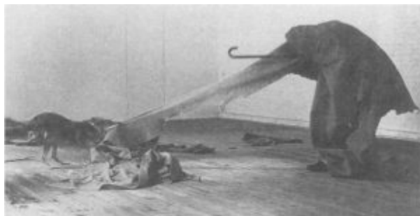
Йозеф Бойс. Койот. Я люблю Америку, и Америка любит меня. Галерея Рене Блока, Нью-Йорк. 20-25 мая 1974 г.

Бойс вернулся в Академию, когда все уже было кончено, и избежал насилия, в отличие от молодых людей, которые по его вине впервые столкнулись с реальными способами формовки в социальной пластике.