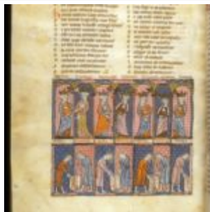
f245v. Семь Добродетелей увенчанные со скипетрами и ниже Семь Пороков