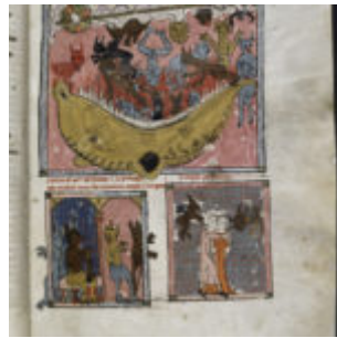
f33. Падение мятежных ангелов, принц дьяволов высылает своих министров, искушение развращением.