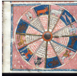
f37. Зодиакальный круг