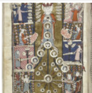
11v. Дерево Любви

Художник этой рукописи также работал в Тулузе (Библиотека муниципалитета, MS 418) и Амьене (Библиотека муниципалитета, MS 355). Рукопись содержит 3 полностраничных миниатюры в цветах и золоте (11v, 30v, 125v). 23 двухколонные миниатюры различного размера и цвета с золотом (7, 33, 34v, 37, 37v, 42v, 50, 51, 53v, 54v, 58v, 67v, 74, 96, 168, 173, 177v, 202, 204, 204v, 245v). Многочисленные небольшие миниатюры в цветах и золоте. Инициалы загадки синие и красные, раскрашенные пером красным и фиолетовым цветом. Маленькие инициалы в синем или красном цвете цветным пером в красном или фиолетовом цветах. Первые буквы стихов выделены желтым цветом. Параграфы в синем или красном.