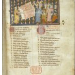
f7. Матфре нструктирует четырех коронованных любовников и трубадуров