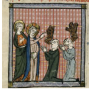
f165v. Христос исцеляет бесов