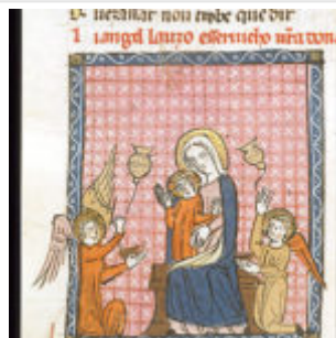
f89. Богоматерь с младенцем между двумя ангелами с кадилами