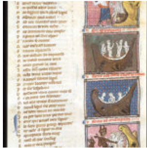
f185v. Четыре сцены ада