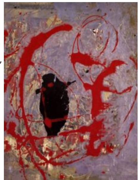
Джексон Поллок. Красный, черный и серебряный. 1956

Ключ к разгадке оригинальности Поллока заключается в определении «конкретное живописное восприятие». Восприятие такого рода, конечно, существенно в любом пластическом виде искусства, но целью Поллока было испытать эти конкретные ощущения, другими словами, освободить их от образов, которые хранятся в памяти и неизбежно вмешиваются в работу воображения, в любую попытку извлечь образы из сферы подсознательного. В 1944 году Поллок как-то признался, что на него произвели большое впечатление некоторые европейские художники (он упомянул Пикассо и Миро), поскольку они считали источником искусства бессознательное. Для сюрреалистов бессознательное было источником символических метафор. Другими словами, они создавали живописные образы, которые могут быть узнаны и идентифицированы, так что от обычных перцептивных образов их отличали только иррациональные ассоциации. Как ассоциируются зонт и швейная машина — можно объяснить, интерпретировать или проанализировать, но