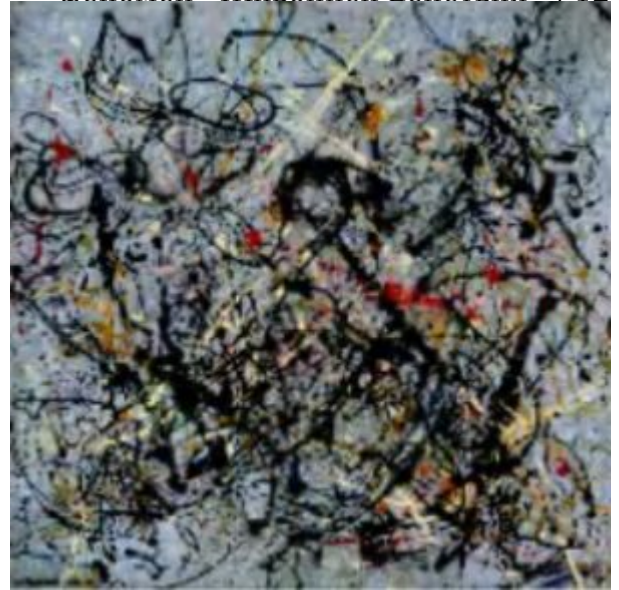
Джексон Поллок. №18. 1950

далекий от людей чудак, занимающийся непонятно чем в уединении своей мастерской. Теперь это свой человек, свой на все сто процентов, решительный и прямодушный. Он швыряет краски на холст и высказывается о себе, о своем искусстве и задачах искусства в целом, о жизни и стране самым резким и недипломатичным образом. Он говорит о силе и энергии, о напоре и победе и не говорит ничего о мысли, о духовности, об углублении в себя или иных тонких материях. Он заявляет, что американским художникам нечего искать в Европе и не нужно вообще туда ездить. Новое искусство может найти для себя наиболее благоприятную почву в Новом Свете. Вероятно, впервые за всю историю искусства художник говорил слова, которые были понятны миллионам соотечественников и находили у них массовую поддержку.