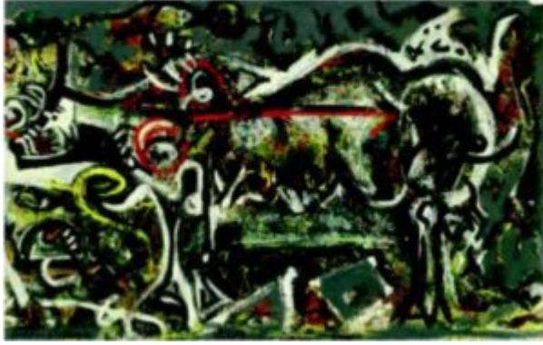
Джексон Поллок. Волчица. 1943

«Быть в картине» означало, как думал Поллок, вернуться к истинному искусству древних цивилизаций — в данном случае индейских цивилизаций Америки. Художник ссылаясь на свое знакомство с художниками-шаманами одного индейского племени, которые приводили себя в экстатическое состояние, а затем наносили магический рисунок на пол специальной хижины, предназначенной для общения с духами. Легко было бы опровергнуть столь «ненаучные» ссылки на искусство «естественных» народов. Индейцы прерий Среднего Запада, практиковавшие общение с потусторонними силами посредством живописи на земле, вовсе не думали о той безбрежной свободе от норм и условностей культуры, о которой мечтал Поллок. Они истово исполняли свои ритуалы, ни на йоту не отклоняясь от их условностей и канонов. Но Поллок, как и другие почитатели «первобытного» или «архаического» искусства в XX веке, хотел видеть там другое. В традиционном искусстве неевропейских племен и народов он усматривал стихию полной свободы, опровержение рациональных методов европейского происхождения.