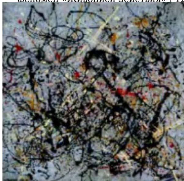
Джексон Поллок. №18. 1950

далекий от людей чудак, занимающийся непонятно чем в уединении своей мастерской. Теперь это свой человек, свой на все сто процентов, решительный и прямодушный. Он швыряет краски на холст и высказывается о себе, о своем искусстве и задачах искусства в целом, о жизни и стране самым резким и недипломатичным образом. Он говорит о силе и энергии, о напоре и победе и не говорит ничего о мысли, о духовности, об углублении в себя или иных тонких материях. Он заявляет, что американским художникам нечего искать в Европе и не нужно вообще туда ездить. Новое искусство может найти для себя наиболее благоприятную почву в Новом Свете. Вероятно, впервые за всю историю искусства художник говорил слова, которые были понятны миллионам соотечественников и находили у них массовую поддержку.