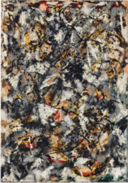
Джексон Поллок. Композиция с красными штрихами. 1950

все это не интересует художника, поскольку его единственное призвание — создание значимых образов. В психоаналитическом смысле эти образы исходят из сравнительно поверхностных слоев