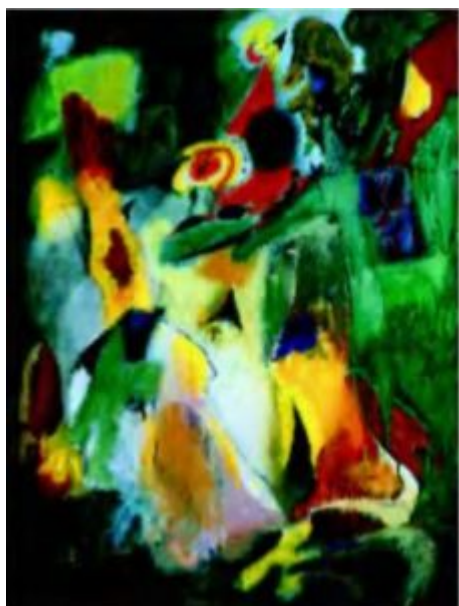
А. Горки. Водопад . 1943

Хотя школа абстрактного экспрессионизма быстро распространилась по всей территории Соединенных Штатов, основными центрами этого стиля были Нью-Йорк и область Сан-Франциско в Калифорнии.