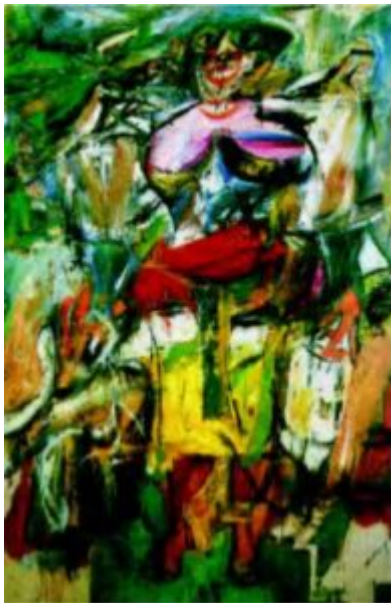
Виллем де Кунинг. Женщина на велосипеде. 1952-1953

Картины вообще стали очень большими. Поллок и Ротко, Ньюмен и де Кунинг верили в то, что они создают новое великое американское искусство. А великое не может быть миниатюрным или камерным, простодушно думали они. Физическая крупноразмерность их картин была, так сказать, метафорическим выражением их амбиций, их веры в свою мировую миссию. Разумеется, никто не стал бы даже в Америке доказывать, будто величие произведения измеряется квадратными метрами. Для обоснования больших размеров изобретались более убедительные аргументы. Например, Клемент Гринберг доказывал, что живопись вовсе не обязана давать иллюзию глубины, а в таком случае для компенсации масштабности она не имеет иного выбора, как расти в ширину и высоту.