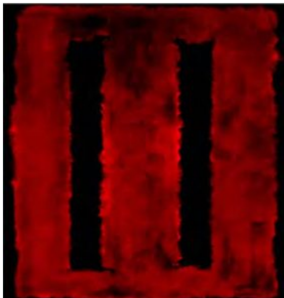
Марк Ротко. Без названия. 1958

Творчество Джексона Поллока, абстрактный экспрессионизм и феномен «Живописи действия» | 4 техника. Именно из-за этого он получает кличку Джек Разбрызгиватель (Jack the Dripper). Присуждение «Гран-при» на Венецианском биеннале Поллоку утверждает всемирный престиж этого движения.