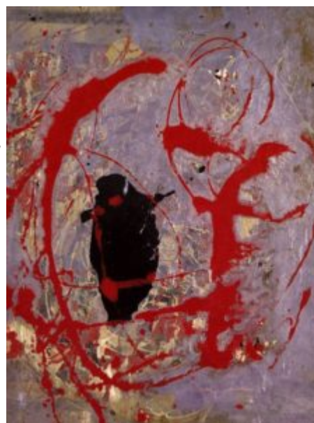
Джексон Поллок. Красный, черный и серебряный. 1956

Ключ к разгадке оригинальности Поллока заключается в определении «конкретное живописное восприятие». Восприятие такого рода, конечно, существенно в любом пластическом виде искусства, но целью Поллока было испытать эти конкретные ощущения, другими словами, освободить их от образов, которые хранятся в памяти и неизбежно вмешиваются в работу воображения, в любую попытку извлечь образы из сферы подсознательного. В 1944 году Поллок как-то признался, что на него произвели большое впечатление некоторые европейские художники (он упомянул Пикассо и Миро), поскольку они считали источником искусства бессознательное. Для сюрреалистов бессознательное было источником символических метафор. Другими словами, они создавали живописные образы, которые могут быть узнаны и идентифицированы, так что от обычных перцептивных образов их отличали только иррациональные ассоциации. Как ассоциируются зонт и швейная машина — можно объяснить, интерпретировать или проанализировать, но