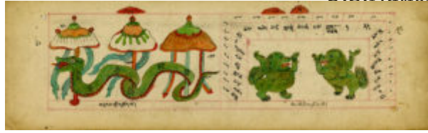
Путешествия и львы