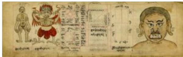
Затмения и Зодиак