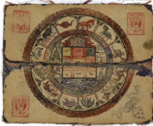
«Основы монгольской астрологии»