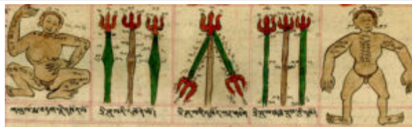
Деталь со страницы в рукописи «Отъезд в путешествие 2»