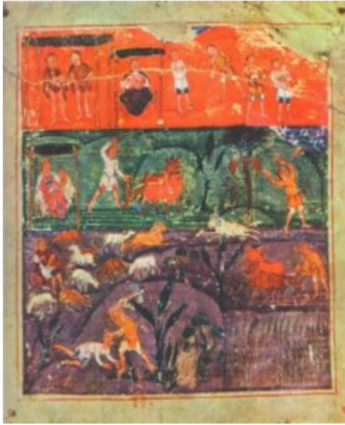
История Адама и Евы. Миниатюра «Пятикнижия Ашбернхема», VII в. Париж, Национальная библиотека

Италия, Испания | 4 VIII века — так называемого «Пятикнижия Ашбернхема» (Париж, Национальная библиотека). Название рукописи происходит от имени ее прежнего владельца лорда Ашбернхема.