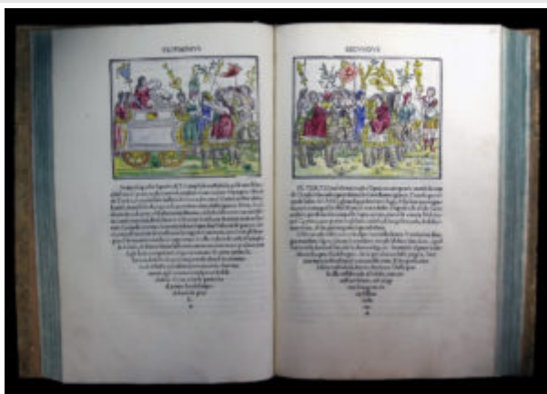
Франческо Колонна. Гипнеротомахия Полифила