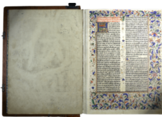
Библия Гутенберга. Т.1

Ну что такое Библия, никому объяснять не надо — это собрание текстов, являющихся священными в иудаизме и христианстве и составляющих Священное Писание в этих религиях. Иоганн Гутенберг — немецкий первопечатник, первый типограф Европы. В середине 1440-х годов создал способ книгопечатания подвижными литерами, оказавший огромное влияние на европейскую культуру и всемирную историю в принципе.