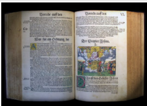
Издание Полной Библии в переводе Мартина Лютера, «заново уточненное».