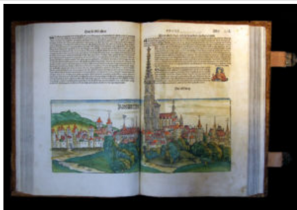
Гартман Шедель. «Книга хроник».

Выставка «Библия Гутенберга. Начало нового времени» в Ивановском зале РГБ | 8 Тойерданк, или Опасные приключения достопочтенного, храброго и знаменитого героя и рыцаря Тойерданка.