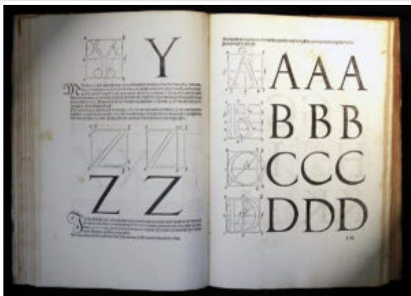
Альбрехт Дюрер. Наставление к измерению циркулем и линейкой линий, плоскостей и объёмных тел.