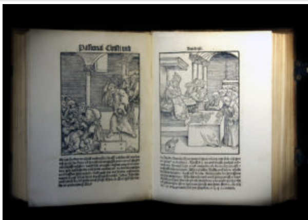
Издание Полной Библии в переводе Мартина Лютера, «заново уточненное»