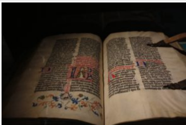
Бревиарий. т. 1 Нюрнберг 1452