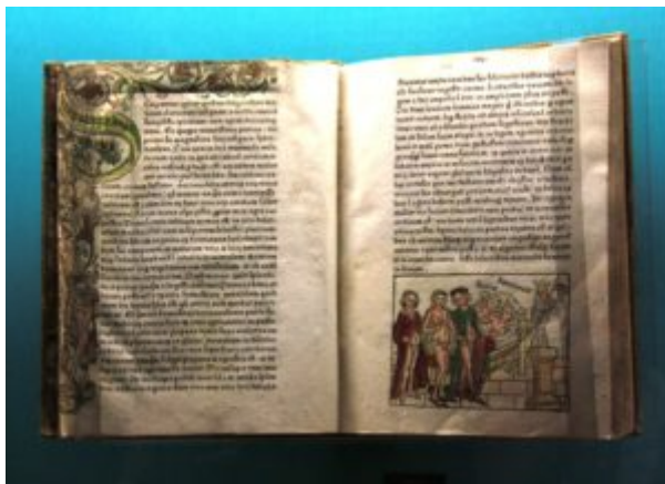
Убейте не помню что это