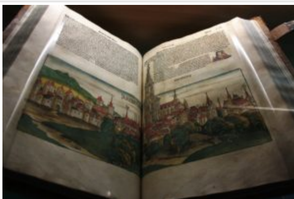
Гартман Шедель. «Книга хроник»