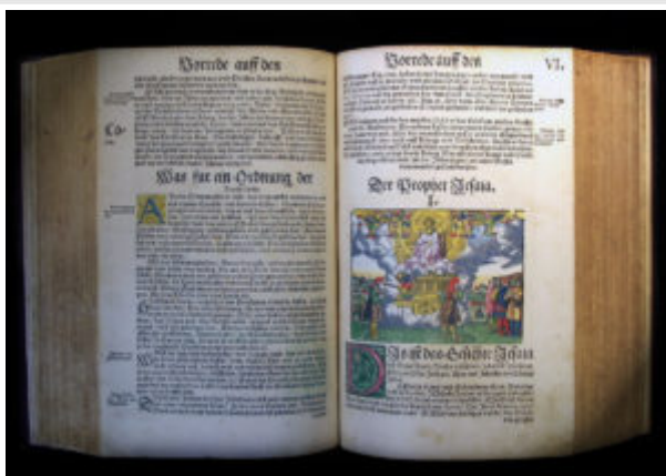
Издание Полной Библии в переводе Мартина Лютера, «заново уточненное».