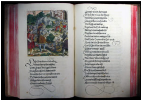
Тойерданк, или Опасные приключения достопочтенного, храброго и знаменитого героя и рыцаря Тойерданка.