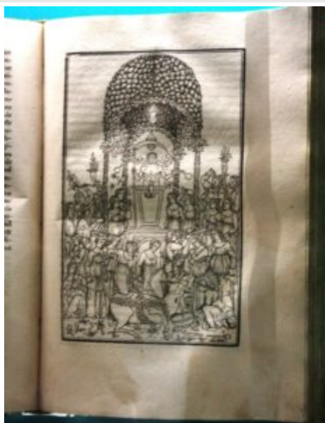
Тоже хорошая книга.