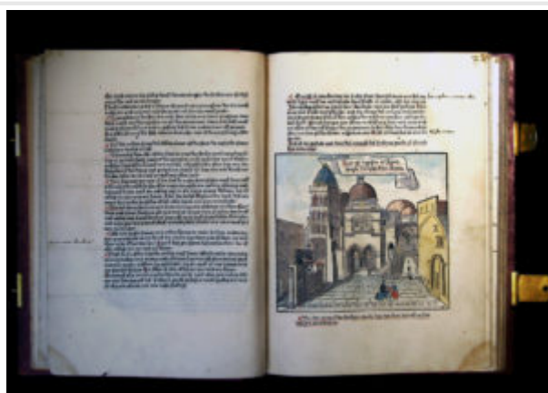
Бернхард фон Брейденбах «Паломничество в Святую Землю».