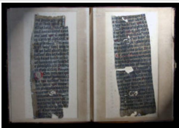
Учебник латинского языка «Грамматики» Элия Доната