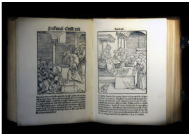
Издание Полной Библии в переводе Мартина Лютера, «заново уточненное»