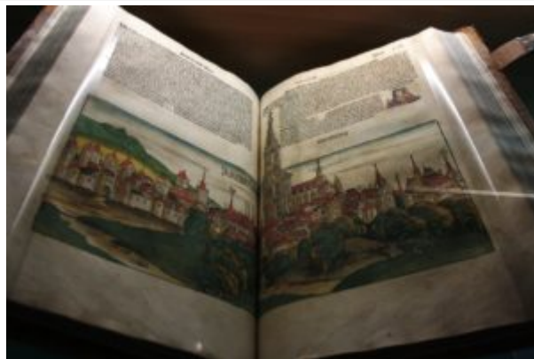
Гартман Шедель. «Книга хроник»