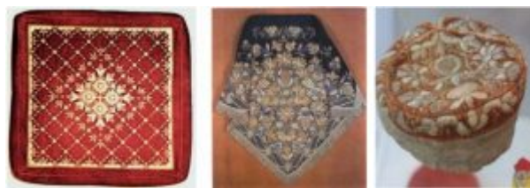
Золотое шитьё на головных уборах

Головные уборы чрезвычайно разнообразны. Шитые золотом и серебром, они надевались к праздничным костюмам и часто являлись самой нарядной и драгоценной его частью. Особенно славилась красотой и качеством нижегородские платки (Огородец, Арзамас и др.) с драгоценной золотой вышивкой.