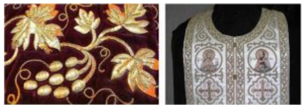
Элементы узора церковного облачения

металлических нитей. При желании создать выпуклый рисунок подкладывали бумагу или вату. Богатство золотого шитья сделало его основным приемом отделки предметов церковного обихода.