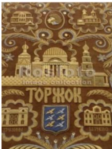
Современное панно мастериц Торжка

Для платков использовали мягкие, легкие ткани: миткаль, шелк, батист, кисея. Растительные узоры выполнялись золотыми и серебряными нитьями, битью, украшались блестками, бахромой, галуном и кружевом.