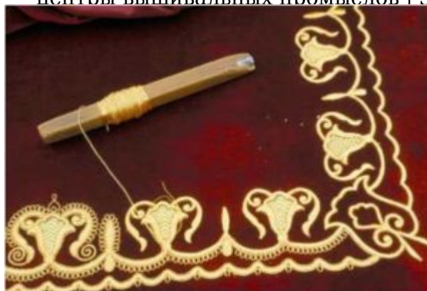
Расположение золотой нити над тканью

На ткань узор мастерицы переносят различными способами, один из самых распространенных — «припудривание» («припорох»). Рисунок на кальке прокалывают иглой или тонким шилом с расстоянием 2-3 мм между проколами. С обратной стороны лист с рисунком протирают наждачной бумагой,