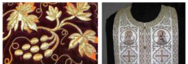
Элементы узора церковного облачения

металлических нитей. При желании создать выпуклый рисунок подкладывали бумагу или вату. Богатство золотого шитья сделало его основным приемом отделки предметов церковного обихода.