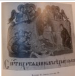
Спасти хотя мир