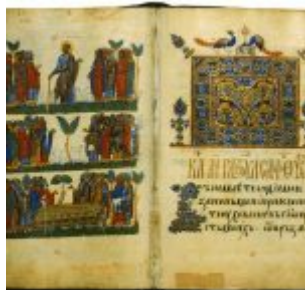
Пророк Моисей ведет евреев через пустыню. Лист с заставкой и инициалом В