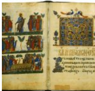
Пророк Моисей ведет евреев через пустыню. Лист с заставкой и инициалом В