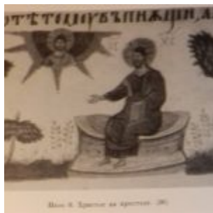
Христос на престоле