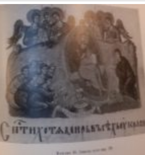
Спаси хотя мир