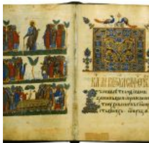
Пророк Моисей ведет евреев через пустыню. Лист с заставкой и инициалом В