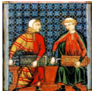
Symphonia de Cantiga 160