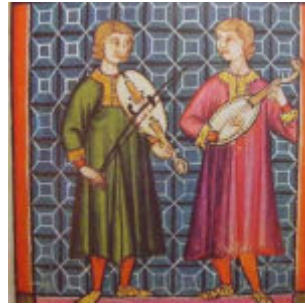
Musicians playing the Spanish vihuela