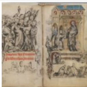
15v-16r, предательство Христа \ Благовещение

Часослов Жанны д'Эврё (1324-1328, Франция \ Метрополитен-Музей, клуатры, № 54.1.2) | 3 Иоланды Фландрской ». Черты лица мужчины, чья жена подделывает гвозди для распятия Христа по просьбе евреев, похожи на черты лица, сидящего на корточках во Христе, несущем крест (61 стих).