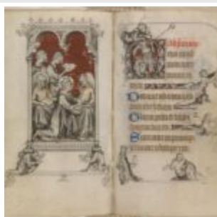
142v-143r, св. Людовик кормит больных