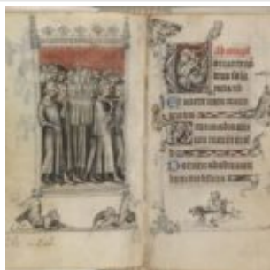
173v-174r, шествие с мощами