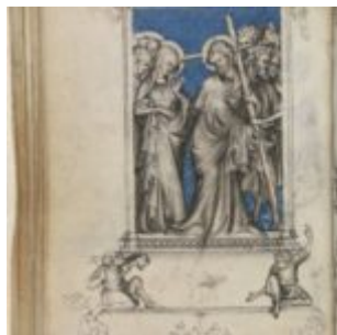
61v, Дорога на Голгофу