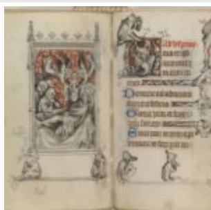
165v-166g, смерть св. Луи