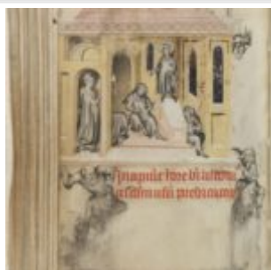
102v, Жанна д'Эврё перед могилой св. Людовика