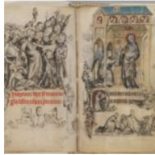
15v-16r, предательство Христа \ Благовещение