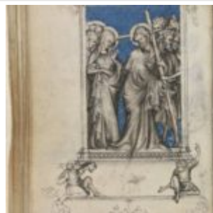
61v, Дорога на Голгофу