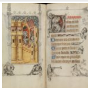
154v-155g, чудо Бревиария