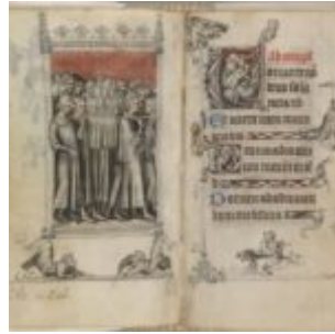
173v-174r, шествие с мощами