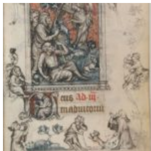
62r, Благовещение пастухам