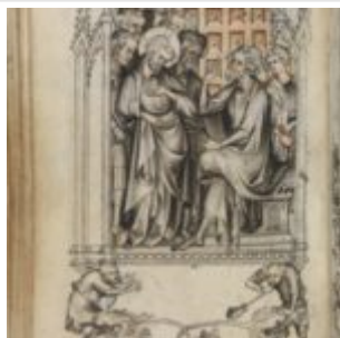
34v, Христос перед Пилатом