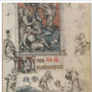
62r, Благовещение пастухам