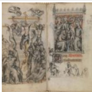
Часослов Жанны д'Эврё, 68v-69r, Распятие \ Поклонение волхвов