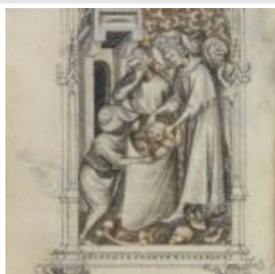
159v, св. Луи закапывает кости крестоносцев