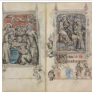
82v-83r, Положение во гроб \ бегство в Египет