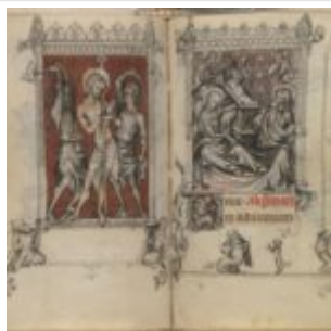
53v-54r, Самобичевание \ Рождество