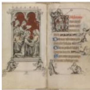
142v-143r, св. Людовик кормит больных