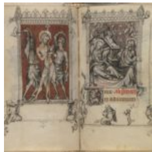
53v-54r, Самобичевание \ Рождество