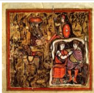
Roman Virgil Folio 108v Aeneas Dido Cave