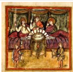
Roman Virgil Folio 100v Aeneas Dido Convivium

Миниатюры Римского Вергилия сохранились несколько лучше, но стилистически они выполнены грубее, чем в Ватиканском. Обратим внимание, что в обеих книгах художники модернизируют материальную культуру седой старины, о которой повествует эпическая поэма Вергилия, посвященная истории бегства Энея и его спутников из захваченной греками Трои. На страницах этих книг Дидона, Эней и другие персонажи одеты по позднеантичной моде (в то время как Вергилий жил в I в. н.э., а Троянская война традиционно датируется XII вв. до н.э.).