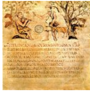
Roman Virgil Folio 001r Eclogues