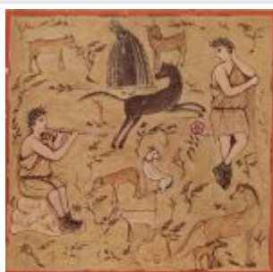
Meister des Vergilius Romanus 001