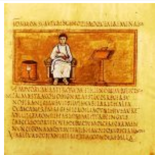
Folio 014r Vergil Portrait