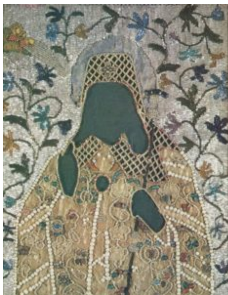
Оклад иконы Дмитрия Ростовского. Вторая половина XVIII в.

При начале работы конец шнура укрепляется следующим образом: два конца льняной нити вдеваются в толстую иголку, образовавшейся таким образом петлей захватывается конец шнура и иголка продевается сквозь ткань возле настила, где начинается шитье жемчугом, на оборотную сторону шитья, где и оставляется. Затем закрепляется шнур и пришивается тонкой крученой шелковиной.