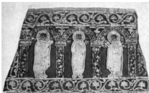
Поручи Варлаама Хутынского. XII в

Шитье жемчугом — «низанье», «саженье» — является почти исключительно женским искусством. Если в кружевном деле иногда встречаются соперники в лице мужчин-кружевников, то в искусстве низанья жемчугом славится долгие века именно умение женщины. Это искусство было распространено у нас на Руси повсеместно с очень давних времен. Иностранцы, которых нельзя заподозрить в излишних похвалах мастерству русских, и те отмечают большое умение наших женщин шить жемчугом.