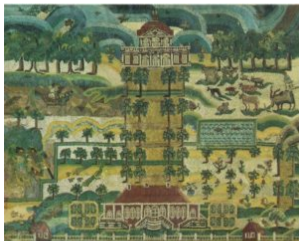
Вышивка декоративная 1757

Более двух столетий бисер и стеклярус служили любимыми материалами для отделки праздничного народного костюма на всей территории европейской России, в северной и, еще в большей степени, в ее центральных и южных областях. На Севере издревле господствующее положение занимал жемчуг, который нашивали и нанизывали на женские и девичьи головные уборы, серьги и другие украшения. В XVIII веке в народный костюм, бытовавший как в сельской местности, так и среди городского населения, начинают проникать бисер и стеклярус, а наряд молодой женщины и девицы XIX столетия уже невозможно представить без обильного применения этих материалов.