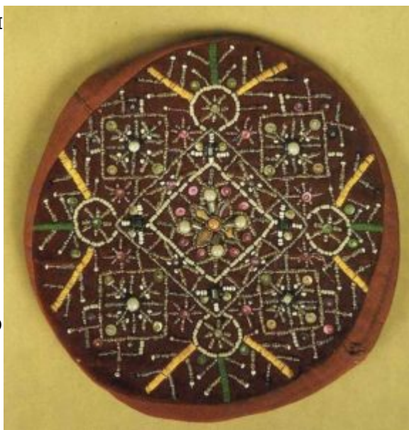
Повойник. 1920-е гг. Архангельская обл.

таких количествах, что становится более доступным сельскому населению. Сравнительно невысокая стоимость и необычайная привлекательность игры то прозрачных, то глухих тонов стекла дают возможность пользоваться им в наиболее ценных предметах народного костюма — головных уборах. В результате даже такие давно сложившиеся типы, как хорошо известный олонецкий (каргопольский) кокошник сушками, и другой, из города Торопец Псковской губернии, с шишками на очелье, сохранив свою оригинальную форму, исполнялись как из жемчуга, так и целиком из бисера. Подобные явления наблюдаются на достаточно обширной территории севера и северо-запада России.