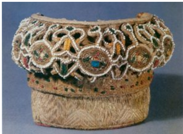
Коруна. Первая половина XIX в.

Прежде чем нанизать жемчуг на нити, жемчуг рассыпается на черном сукне или вообще на черной поверхности — на бархате, либо какой другой черной гладкой, преимущественно матовой ткани. Потом