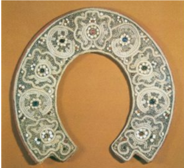
Ожерелье. XVIII в.

дощечка-планка как устой, упор для руки, чтобы во время работы не помять шитья. При работе больших вещей, в особенности, когда шитье жемчугом делается по бархату, который при работе не складывается, не закатывается, середина шьется жемчугом отдельно, а потом вшивается. Работа в таком случае проводится двумя вышивальщицами: вдоль всей ткани кладется на пальцы большая планка-дощечка так, чтобы упор ее был на концах пальцев, не касаясь шитья. Одна вышивальщица находится на полу, под пальцами, а другая, облокотясь на положенную планку, пришивает вышитую жемчугом середину. Сидящая внизу пропускает иголку с ниткой, закрепленной узлом, в край или в середину шитья. Вышивальщица, находящаяся сверху, принимает иголку и, пропуская ее обратно, делает требуемый стежок в четверть, в половину или в целый сантиметр. Эта же вышивальщица, находящаяся наверху, указывает, где надо шить, и для этого толстой иголкой прокалывает отверстие, куда вышивальщица, сидящая внизу, должна направить иголку с ниткой.