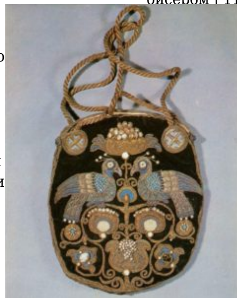
Сумочка темно-синего бархата. Конец XIX — начало XX в.

На Московской Руси высоко ценилось шитье жемчугом, и вышивальщица, создававшая жемчужный узор, шила его так, что по изнашиванию ткани, то есть фона, жемчужное шитье, которое являлось более долговечным, можно было, вырезав по краю и не повредив пришивки шнура, переложить на новую ткань. Это обшивание жемчужного сажения золотым шнуром отмечается и в древних описях.