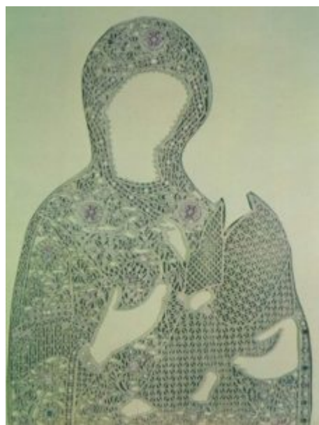
Риза иконы богородицы Грузинской. Конец XVIII — начало XIX в.

Пряденое золото в виде «веревочки» вокруг жемчужного узора очень часто встречается на народных женских головных уборах. Этот технический прием сохраняется и в XVIII веке.