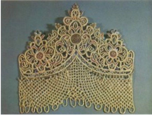
Девичий головной убор. Вторая половина XVIII в.

Говоря о шитье жемчугом, употребляют термины «низанье» и «саженье». Техника шитья «низанья» и «саженья» жемчугом довольно сложная. В шитье жемчугом надо различать два основных вида работы: работы первого рода — это низание насквозь, нанизывание жемчуга на нитку без ткани, сквозной сеткой, что имело много общего с кружевной работой и нередко с ней сочеталось. В XVI и XVII веках было очень распространено на древней Руси золотое плетеное на коклюшках кружево. Нередко в кружево вплеталась жемчужная нить. Это является особенностью именно русского кружева.