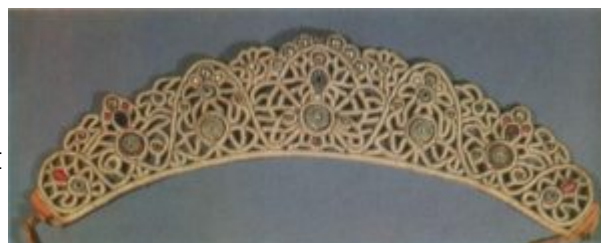
Венец. XIX в

мастерских занимали царские «светличные палаты». Известны работы светлиц князей Старицких, бояр Годуновых, «торговых гостей» Строгановых и других. Такая же организованная работа шла и в женских монастырях, где часто шитье выполнялось на заказ, например Вознесенский монастырь в Кремле, Новодевичий и пр.