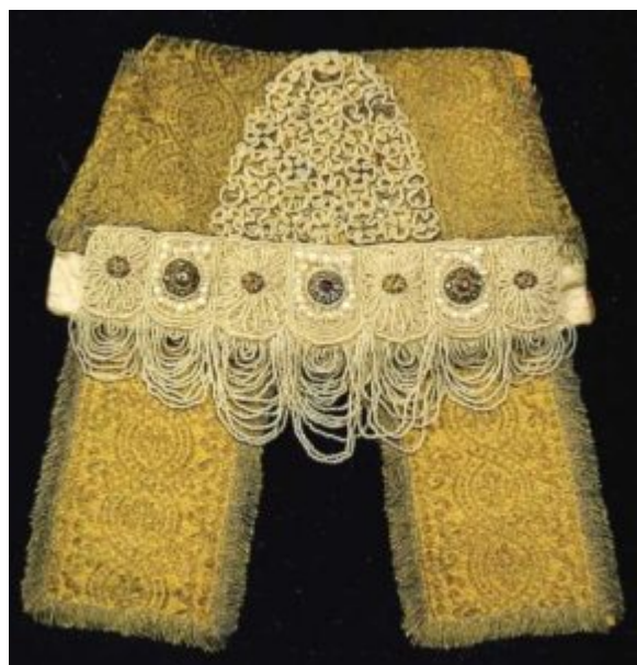
Повязка. Вторая половина XIX в. Костромская губ.

В силу исторических условий на Севере сложился определенный комплекс женской одежды с сарафаном и твердым кокошником. Головной убор являлся главным, завершающим предметом всего наряда, на него обращалось особое внимание: при его исполнении не жалели ни усилий, ни материальных затрат.