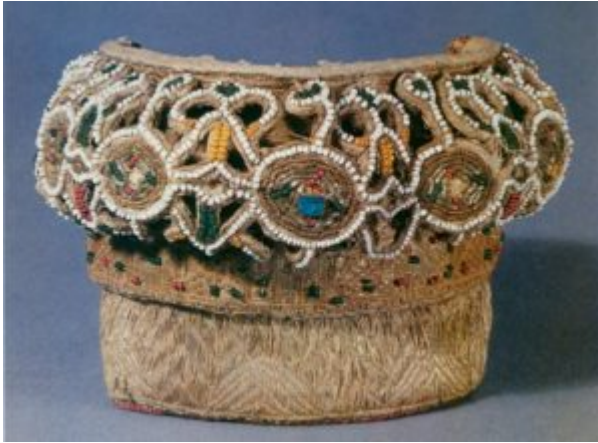
Коруна. Первая половина XIX в.

Традиционное шитье жемчугом, перламутром, стеклярусом, бисером | 9