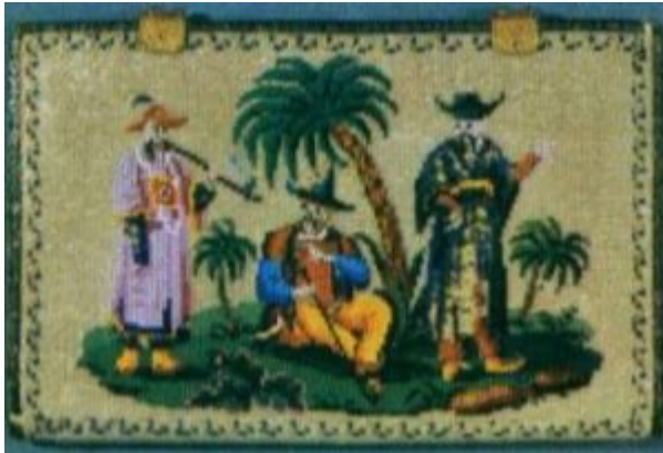
Шитье мелким бисером на холсте. Бумажник. 1830—1840-е гг.

Существенные изменения происходят в оформлении интерьеров дворцов и особняков знати. Во внутренней отделке и обстановке помещений, соответственно требованиям господствовавших стилей — барокко, позднее — рококо, наряду с расписными плафонами, шпалерами, коврами, обоями из кожи и шелковых тканей, все более значительную роль начинают играть вышитые отделки, панно, ковры, скатерти. Разумеется, не все дворянские семьи имели возможность перестроить свой быт соответственно новым требованиям времени. В доме мелкопоместных дворян еще долго продолжали существовать, соседствуя с наиболее доступными европейскими изделиями или их подражанием, выполненным рукою местного умельца, полотенца, простыни с подзорами, скатерти, отделанные вышивками в традициях народного искусства.