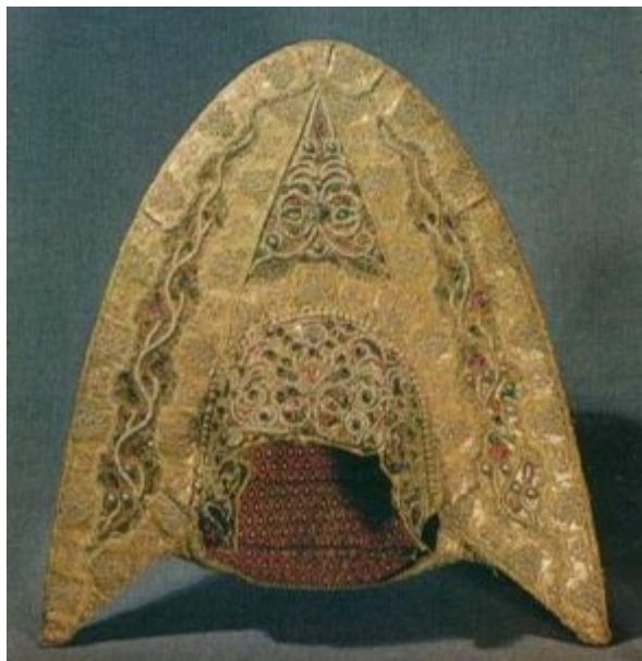
Шитье перламутром, стеклами в гnezдах и металлической нитью по красному бархату. Кокошник. XIX в.

Вышивка — один из наиболее распространенных приемов украшения ткани. С древнейших времен на территории русского государства покрывались шитыми орнаментами предметы одежды и быта. В песнях, былинах и сказаниях упоминалось искусство русских рукодельниц. Со времен Киевской Руси шитье широко использовалось для отделки предметов культового назначения. По рассказу летописца, в 1183 году в одном из соборов города Владимира сгорело множество шитья золотом и жемчугом. Эти «узорочья» и «порты» вешали на праздники «в две верви» от Золотых ворот до храма Богородицы и далее до «владычных сеней».