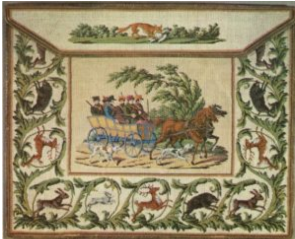
Ягдташ зеленой кожи. Первая половина XIX в.

Бисерные народные украшения и головные уборы XVIII столетия известны по единичным памятникам, сохранившимся в музеях, а также по письменным источникам.