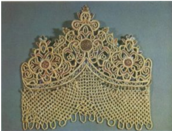
Девичий головной убор. Вторая половина XVIII в.

Говоря о шитье жемчугом, употребляют термины «низанье» и «саженье». Техника шитья «низанья» и «саженья» жемчугом довольно сложная. В шитье жемчугом надо различать два основных вида работы: работы первого рода — это низание насквозь, нанизывание жемчуга на нитку без ткани, сквозной сеткой, что имело много общего с кружевной работой и нередко с ней сочеталось. В XVI и XVII веках было очень распространено на древней Руси золотое плетеное на коклюшках кружево. Нередко в кружево вплеталась жемчужная нить. Это является особенностью именно русского кружева.