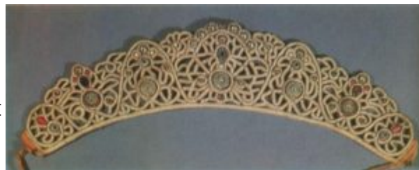
Венец. XIX в

мастерских занимали царские «светличные палаты». Известны работы светлиц князей Старицких, бояр Годуновых, «торговых гостей» Строгановых и других. Такая же организованная работа шла и в женских монастырях, где часто шитье выполнялось на заказ, например Вознесенский монастырь в Кремле, Новодевичий и пр.