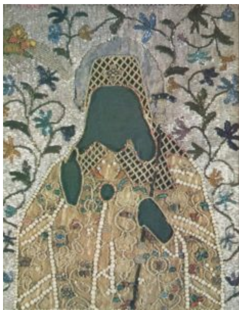
Оклад иконы Дмитрия Ростовского. Вторая половина XVIII в.

При начале работы конец шнура укрепляется следующим образом: два конца льняной нити вдеваются в толстую иголку, образовавшейся таким образом петлей захватывается конец шнура и иголка продевается сквозь ткань возле настила, где начинается шитье жемчугом, на обратную сторону шитья, где и оставляется. Затем закрепляется шнур и пришивается тонкой крученой шелковиной.