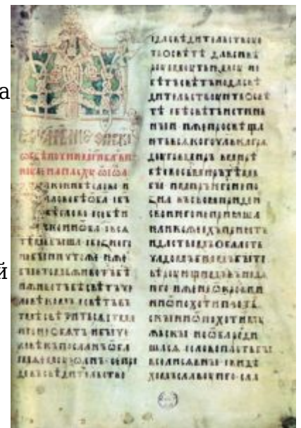
Заставка на первом листе