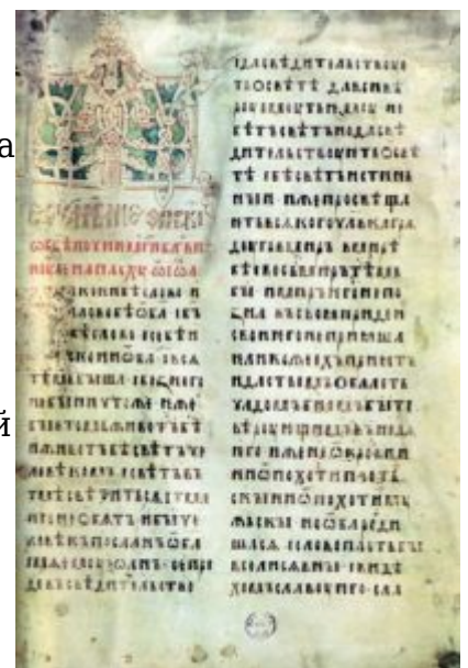
Заставка на первом листе

В Антониево-Сийском монастыре Евангелие в июне 1829 года обнаружил археограф П. М. Строев. По месту обнаружения оно и получило своё название — Сийское. В 1903 году оно поступило в Древлехранилище Архангельского епархиального церковно-археологического комитета. По описи 1922 года Сийское Евангелие находилось в отделении рукописных и старопечатных книг Архангельской Публичной библиотеки, но фактически хранилось в пакгаузах Архангельской таможни. В 1927 году его передали в архив Историко-археографической комиссии в Ленинграде, а в 1932 году — в рукописное отделение библиотеки Академии наук.