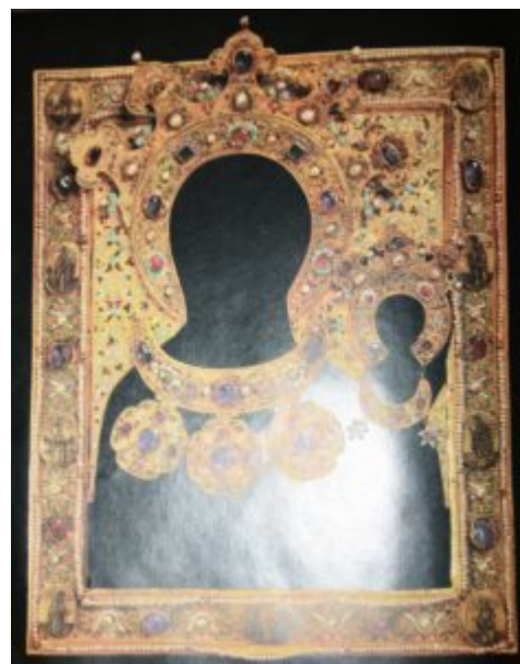
Оклад иконы «Одигитрия». Москва. XVI в.

Развитию золотого и серебряного дела в Москве немало способствовало создание художественных мастерских при великокняжеском дворе — Оружейной, Пастельной, Серебряной палат и др. В столицу со всех концов страны устремляются талантливые ремесленники-умельцы. Не утратив древних традиций художественного мастерства, московские мастера-ювелиры добиваются высокого совершенства в целом ряде новых технических приемов обработки и украшения драгоценных изделий.