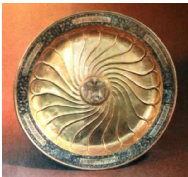
Блюдо. Мастерские Московского Кремля. 1561 г.

Особого совершенства в этот период достигает техника черни. К лучшим памятникам черного искусства относится золотое блюдо, подаренное Иваном Грозным в 1561 году своей жене Марии Темрюковне. Центр его занимает стилизованное изображение большого цветка, выполненного в технике плоской чеканки. Лепестки, слегка закручиваясь по спирали, заполняют почти всю поверхность блюда. Лишь по борту проходит полоса тонкого бархатисто-черного узора в виде сетки из красиво изогнутых переплетающихся стеблей цветов.