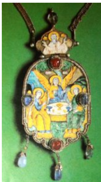
Панагия. Вятка, конец XVII в.

почерк. Предметы отличаются особой декоративностью, жизнерадостным колоритом, близостью к народному творчеству.