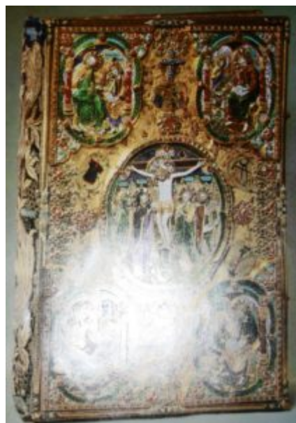
Евангелие. Мастерские Московского Кремля. 1678 г.

родной природы и стремившегося отразить ее в своем произведении. Необыкновенно яркая и глубокая по цвету эмаль соперничает с блеском драгоценных камней — чистых и прозрачных. Подхваченные золотыми кастами в обрамлении белых эмалевых лепестков драгоценные камни оживают, напоминая диковинные цветы природы.