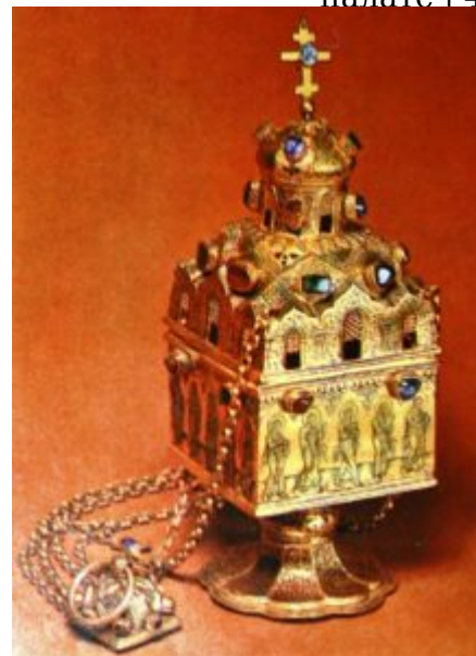
Кадило. Мастерские Московского Кремля. 1598 г.

золотое кадило, сделанное по заказу царицы Ирины в 1598 году. По форме это одноглавый храм в миниатюре. Черневой растительный орнамент из множества трав, побегов, цветов заполняет верхнюю часть кадила. Боковые стенки занимают черневые изображения фигур апостолов. Изображения апостолов несколько вытянуты, что облегчает нижнюю часть храма, сообщает ему движение вверх. Особую роскошь этому изделию придают круглые драгоценные камни.