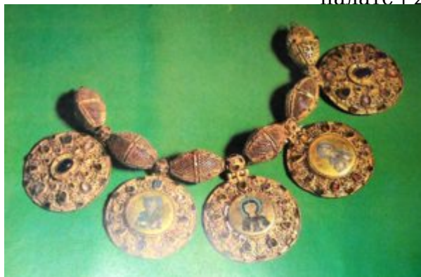
Бармы. Рязань. XII в

найденного в 1822 году на территории Старой Рязани, разрушенной в 1237 году ордами Батыея. Клад представляет собой золотой парадный женский убор, состоящий из нескольких разных по назначению, но стилистически единых украшений: круглых массивных колт, которые прикреплялись к головному убору в качестве подвесок, барм (ожерелий), браслета, перстней и серег. Форма предметов, сочетание техник, цветовая гамма эмалей свидетельствуют о том, что эти украшения сделаны в XII веке мастерами Рязани.