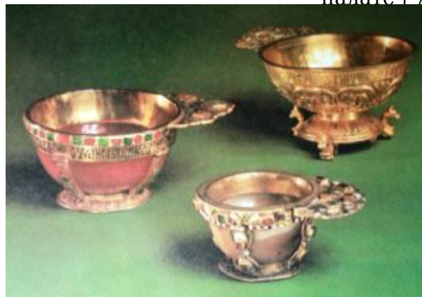
Чарки. Мастерские Московского Кремля. XVII в.

Больших художественных успехов в серебряном деле достигли в XVII веке и местные центры — города Ярославль, Нижний Новгород, Кострома и другие. В формах и орнаментации изделий мастеров этих центров присутствует местный стилистический