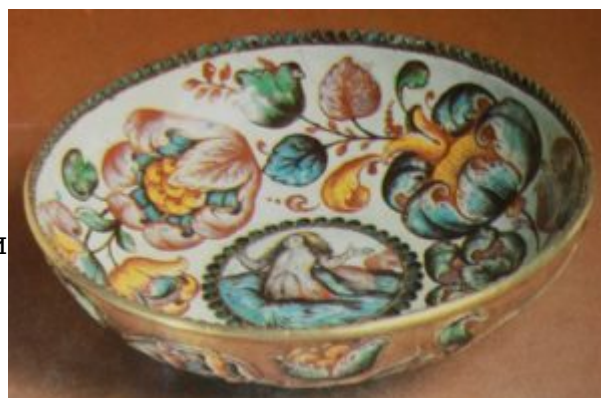
Чаша. Сольвычегодск. XVII в.

прикладного искусства в XVII веке внес Сольвычегодск. В эмалирном искусстве он занимает особое место. Здесь в последней четверти XVII века, раньше, чем в Москве, получила широкое распространение совершенно новая для того времени техника живописной эмали. В сольвычегодских эмалях, носивших название усольских, явственно проступили черты искусства нового времени. Растительные мотивы в усольских эмалях сочетаются с изображением птиц, животных, пейзажей и даже человеческих фигур.