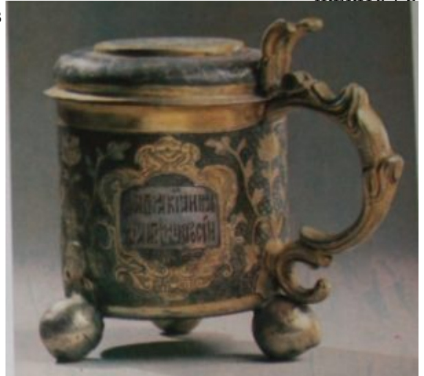
Кружка. Мастерские Московского Кремля. XVII в.