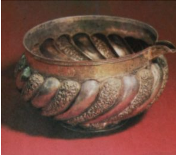
Ендова. Мастерские Московского Кремля. 1644 г.

использовались также различные породы камней — яшма, оникс, сердолик, хрусталь.