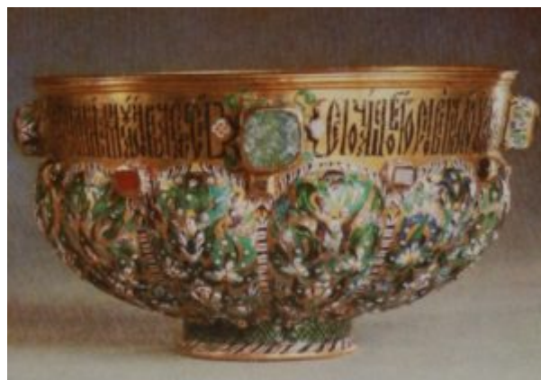
Чаша. Мастерские Московского Кремля. 1653 г.

боярыней Морозовой. Все в нем проникнуто поэтическим ощущением красоты — чистота линий рисунка, радостные и смелые сочетания цветов; композиция оживлена драгоценными камнями — изумрудами, рубинами, сапфирами. Эти же черты проявились и в оформлении золотой чаши в форме полураспустившегося цветка, подаренной патриархом Никоном в 1653 году царю Алексею Михайловичу. В украшении ее сказалось исключительное мастерство художника-эмальера, тонко чувствовавшего красоту