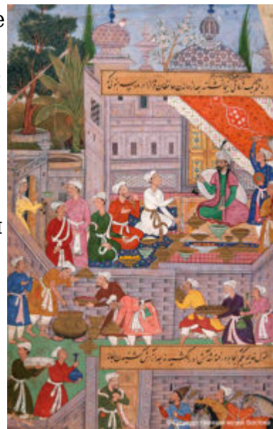
Миниатюра из рукописи «Бабур-наме». Пир Бабура во дворце Музаффар мирзы в Белом саду в Герате. Событие года 912 (1506-1507). Индия, XVI в. Музей искусств народов Востока.

У ацтеков, миштеков, майя близки к пиктографии уверенные и смелые, сочные по цвету рисунки (миштекский «Кодекс Борджа», 14—16 вв., Ватиканская библиотека).