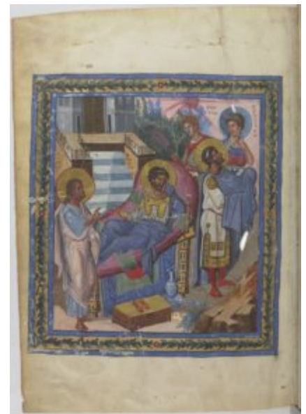
Парижская Псалтырь, 446v

господствуют условность, плоскостность изображения, экспрессивность жестов; появляются и жизненно-непосредственные, политически полемичные сцены (« Хлудовская псалтирь », 9 в., Исторический музей, Москва).