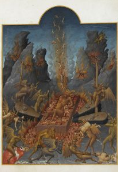
Роскошный часослов, Ад. (fol. 108r)

характерны для миниатюр братьев Лимбург (« Богатейший часослов герцога Беррийского ») и братьев ван Эйк. Во 2-й половине 15 в. Ж. Фуке и С. Мармион применяют в миниатюре элементы линейной и воздушной перспективы, воссоздают напоенные светом и воздухом сельские и городские пейзажи Франции (« Часослов Этьена Шевалье » Ж. Фуке, 1450-1455, разные музеи Европы).