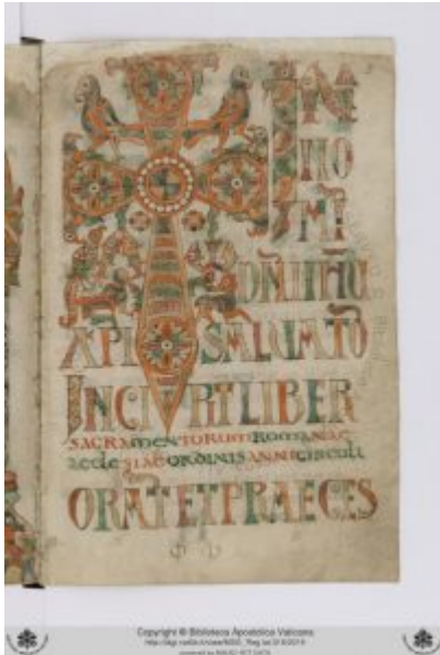
Гелазианский сакраментарий 0004r

рукописи 7—9 вв, украшались миниатюрами крупных размеров, в которых экспрессивные изображения евангелистов заключены в стилизованную орнаментальную рамку, а развороты страниц сплошь покрыты узорами отвлеченного, но полного