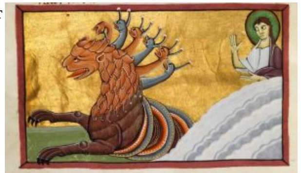
Бамбергский апокалипсис. 32v

миниатюру проникают элементы народного творчества (« Моралия » св. Григория Великого, 1109—33, Муниципальная библиотека, Дижон, https://en.wikipedia.org/wiki/C%C3%A9teaux_Moralia_in_Job ).