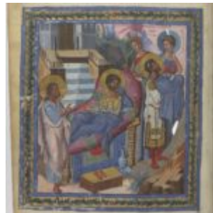
Парижская Псалтырь, 446v