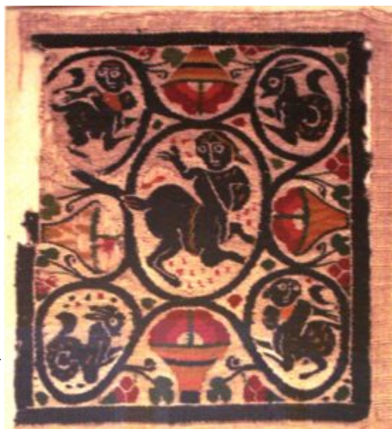
Полихромная вставка с изображением кентавра

связаны с культом Диониса, они появлялись в его свите вместе с музыкантами и воинами, сатирами и вакханками. Яркий насыщенный цвет, подчеркивающий жизнерадостный характер образа, отличает ткани с изображением кентавра. Важно отметить двойственность символики этого образа: Климент Александрийский уподобляет человека кентавру, образно сравнивая человеческую душу и тело с разумным и неразумным началами. В то же время, согласно Житию Антония Великого, дорогу к отшельнику Павлу Фивейскому ему указали кентавр и сатир. На тканях, в данном случае кентавр, подобно всаднику, несет благопожелательную символику. Изображение всадника и кентавра в медальоне символизировало победу над смертью, а композиции по сторонам фриза обещали вечную жизнь и пребывание в райском саду.