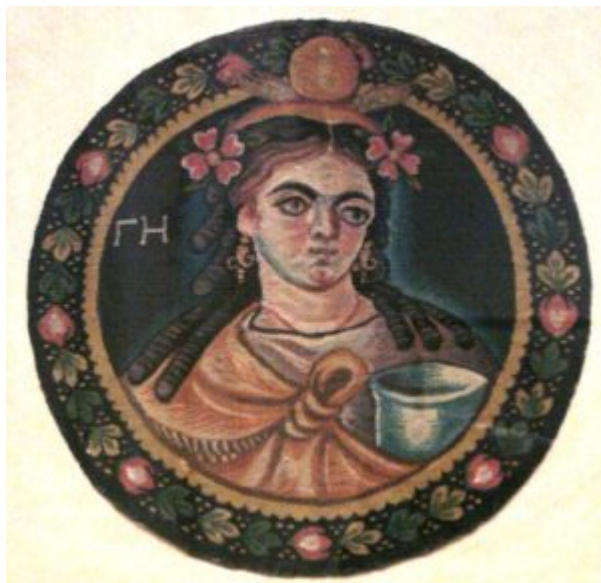
Медальон с изображением Геи

месяцев, богини земли Геи и Океана, рек, водных источников, персонификации городов и домашнего очага, аллегории возрождения и процветания, веры, надежды, доблести. Ткани с персонификациями, относящиеся к раннему периоду IV-V веков, сохранились в сравнительно небольшом количестве. Блестящим образцом подобного рода памятников может служить тканый медальон с изображением богини земли Геи.