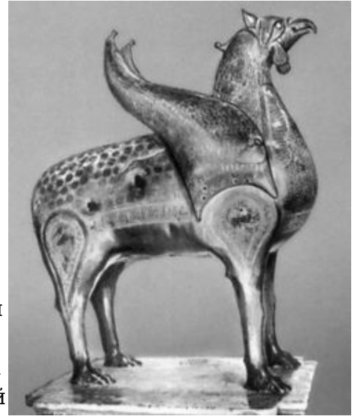
«Грифон». Бронза. 11—12 вв. Кампосанто. Пиза.

По своим формам и общему характеру декора художественное стекло Египта очень близко к сирийскому, но для египетских изделий характерны каллиграфические надписи с выражением благопожеланий, нередко покрывающие широкими поясами почти всю поверхность сосуда. Изображения животных, рыб, птиц и даже человека часто встречаются в росписях фаянсовых и глиняных блюд и чашек. Среди египетских художественных изделий из бронзы 10 — 12 вв., так же как в Сирии и Ираке, выделяются фигурные сосуды — водолеи и курильницы в виде различных птиц и животных. Характерным примером является бронзовый водолей-павлин (10 — 11 вв., Лувр). Ручка водолея заканчивается стилизованной головкой кречета, вцепившегося клювом в шею павлина. Тонкий чеканный орнамент передает оперение. В более позднем памятнике этого рода — большом крылатом грифоне (11 — 12 вв., Пиза) — орнаментальное начало доминирует над пластической формой.