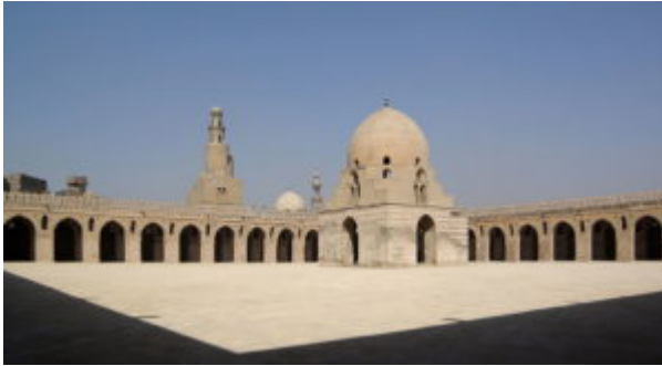
Внутренний двор мечети Ибн Тулуна

поступала туда через специальные проходы. Колодец состоит из трех отсеков, уменьшающихся с глубиной: два в форме куба, один цилиндрический; вниз ведет лестница. Как ни парадоксально, но это идущее под землю полое сооружение схоже с винтообразным минаретом самаррской мечети аль-Мутаваккиля.