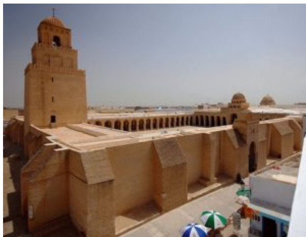
Великая мечеть Кайруана

Убранство помещения отличается торжественностью. Тяжеловесность несущих пилонов с колонками по углам уравнивается сдержанной пышностью полосы растительного орнамента из стука, непрерывно тянущейся над ними и обрамляющей пространство между арками. Лепные капители колонок вазообразны и согласуются со вторым самаррским стилем. Арки стрельчатые и лишь у основания слегка подковообразны. Значительные, но бережные реставрационные работы проводились здесь в 696/1296 году, при мамлюкском султানে Ладжине. Тогда же обрели свой нынешний вид купол перед михрабом, фонтан и минарет.