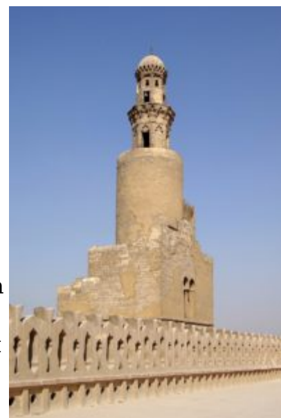
Минарет со спиральной лестницей

между двойными стенами. Он представляет собой уменьшенную копию знаменитого минарета в Самарре, а нижняя часть построена в форме квадрата. Дата постройки минарета до сих пор точно не определена. Одни исследователи склоняются к тому, что он был построен во времена правления Ахмеда ибн Тулуна и имел полностью спиралевидный вид. Однако спустя некоторое время постройка начала крениться в сторону и возникла необходимость ее перестроить. В процессе реконструкции ее нижняя часть приняла форму квадрата. Существует гипотеза о том, что Ахмед ибн Тулун лично распорядился построить копию минарета, который находился в Самарре и который он очень любил. Считается, что правитель вызвал в Египет архитектора — автора минарета в Самарре, что вполне вероятно, так как промежуток между датами построек составлял всего несколько десятилетий. Другие исследователи относят постройку минарета к XIII в., поскольку возведен он, как и весь комплекс, из камня, а не из кирпича, к тому же конструкция, соединяющая минарет с мечетью, была выполнена с ошибками.