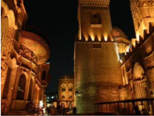
Комплекс султана Калауна

д. Мозаикой выложен пол здания. Обработка камня достигла высокого уровня. Появился цветной кирпич, что позволило строителям делать разнообразную по орнаменту кладку.