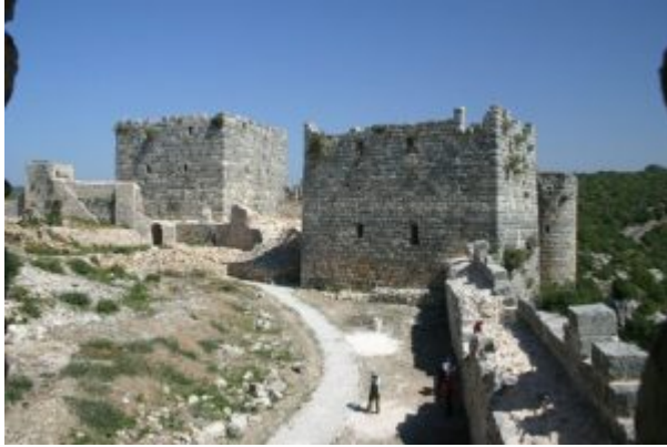
Цитадель Салах ад-Дина

Со времен Айюбидов до наших дней дошла одна из крупнейших по строек того периода — цитадель Салах ад-Дина : правитель большое внимание уделял городским укреплениям. Сооружение цитадели началось в 1176 году, площадь ее в итоге оказалась довольно внушительной — около 18 га. Именно эта цитадель была на протяжении многих столетий резиденцией египетских правителей.