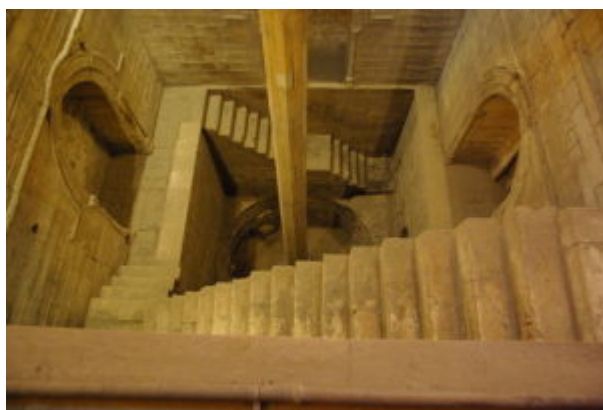
Ниломер на острове Рода в Кауре (ок. 861 г.)

Несмотря на многократные позднейшие перестройки, здание сохранило основные черты планировки 7 в.: обширный двор с фонтаном посередине окружен колоннадой, которая со стороны михрабной стены образует глубокий колонный зал. Колонны, увенчанные коринфскими капителями, поддерживают полукруглые арки.