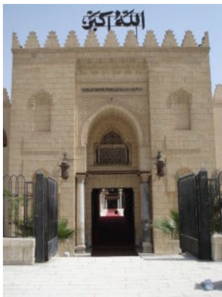
Мечеть Амра ибн аль-Аса

Нельзя сказать, что первые города мусульманского Египта появлялись в соответствии с заранее разработанным планом и с одобрения халифа. Пример тому — Фустат. Город был основан случайно, после взятия Вавилона. Осада Вавилона продолжалась несколько месяцев. Около города находился лагерь арабов. Когда крепость была завоевана и надо было сниматься с места, чтобы двигаться дальше, выяснилось, что на палатку полководца Амра голубка не только свила гнездо, но и снесла яйца. Увидев это, Амр сказал, что негоже прогонять тех, кто ищет спасения. Таким образом был заложен город Фустат и появилось первое культовое сооружение мусульман в Египте — мечеть Амра.