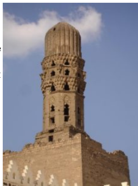
Минарет мечети аль-Хакима

Мечеть ал-Хакима, как и построенные ранее культовые здания, была выполнена из кирпича, однако некоторые элементы, такие как фасад и минареты, были каменные, что говорит о постепенном приобщении к материалу, принятому в Египте. Именно этим двум архитектурным элементам стоит уделить внимание. Фасад, спроектированный с северной стороны, имеет портал, где впервые в мусульманском Египте использован достаточно большой по размерам резной орнамент, сделанный на