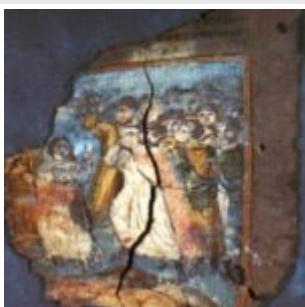
Коттоновский генезис, Дом Лота. Фрагмент 4v