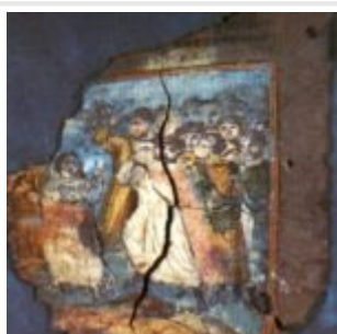
Коттоновский генезис, Дом Лота. Фрагмент 4v