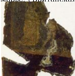
Fragment 03r_God, Adam, Eve.