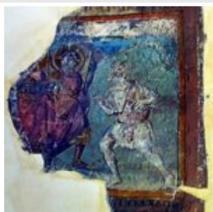
26v. Коттон Встреча Авраама и трех ангелов