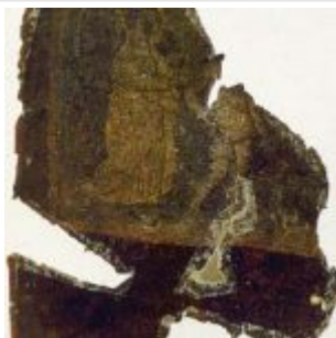
Fragment 03r_God, Adam, Eve.