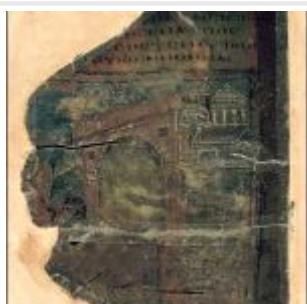
Fragment 27v. Story Of Lot.