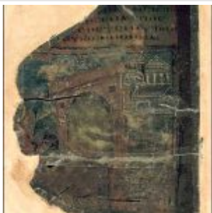
Fragment 27v. Story Of Lot.