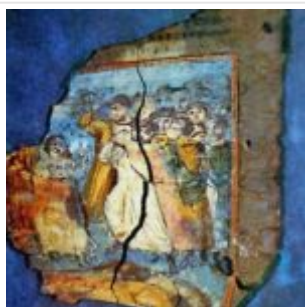
Коттон Разделение Авраама и Лота

В миниатюрах отразились как общие черты античной живописи — скажем, дни Творения изображаются как фигуры ангелов, Творец направляет в уста Адаму душу-Психею в виде крылатого человечка, так и влияния александрийского богословия, например, Творец изображен безбородым и с крестчатым нимбом — он ассоциируется с Премудростью, Логосом — Словом, а стало быть, с Христом, предвечно бывшим с неизобразимым Отцом. Плотность иллюстрирования такова, что, видимо, на 300 страниц приходилось около 330 миниатюр. Эта рукопись вызвала к жизни целую широкую традицию в монументальной живописи и в миниатюре, в частности, была в сокращении повторена в начале 13 в. в мозаиках венецианского собора Сан Марко.